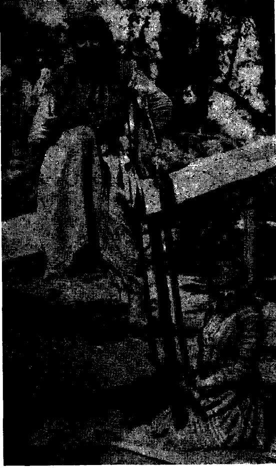
Antalya tahtacılarından iki kadın

halde — Kızılbaşlıkları hesabıle camia arasında hor görüldüklerinden olacak ki — tab'an mülâyim ve bödük olmuşlardır. Orman ve kereste sahipleri olan müte-gallibe ağa ve tüccarın boyunduruğunda yaşamak, geçinmek mecburiyetinin de bu tabiat üzerinde amil olduğu şüphesizdir.