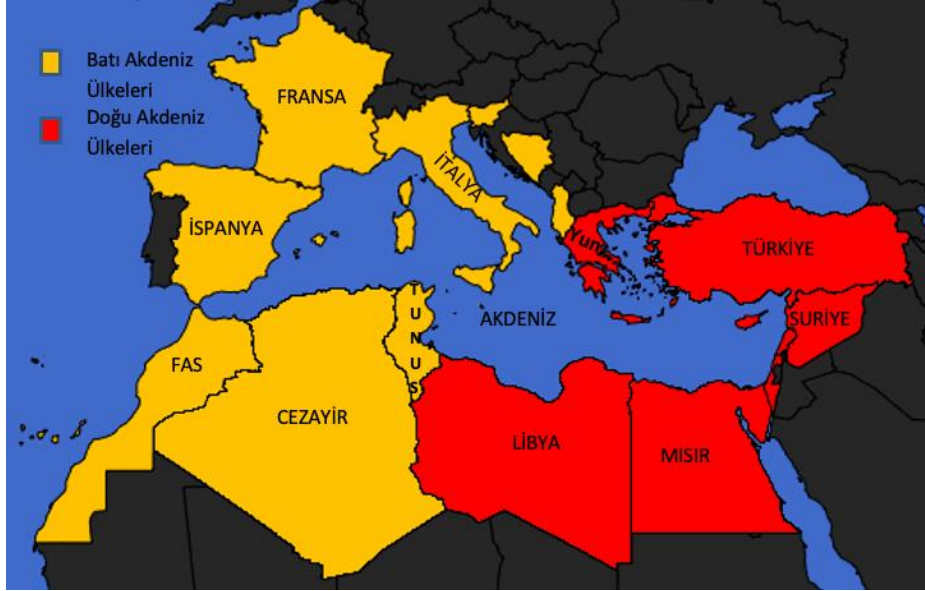
Şekil 1. Akdeniz Ülkeleri

Yunanistan, Türkiye, Suriye, Lübnan, İsrail, Filistin-Gazze Yönetimi, Mısır, Libya, KKTC ve GKRY'nin ise Doğu Akdeniz'e kıyıları bulunmaktadır (Yıldız, 2006, s. 618). Üç kıta arasında kavşak konumda olan Akdeniz'in ticaret, ulaşım ve enerji aktarımının merkezinde yer aldığı görülmektedir (Madihah, 2020, s. 37). Başka bir ifade ile Akdeniz dünyanın üç kıtası arasındaki ana temas alanını temsil ettiği için önemli bir coğrafi konuma sahiptir ve bu kıtaların her birinin kendi siyasi ve ekonomik önemi vardır. Ayrıca Akdeniz sadece coğrafi buluşma noktası değil, jeopolitik ve jeoekonomik çağdaş küresel strateji eksenlerinin de ana odak noktasında yer almaktadır (Bala, 2021); (Bkz. Şekil 1. Akdeniz Ülkeleri).