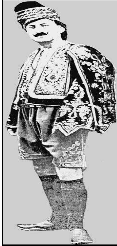
Resim 3 (Kadın ve Erkeğin Zeybek Kıyafeti)