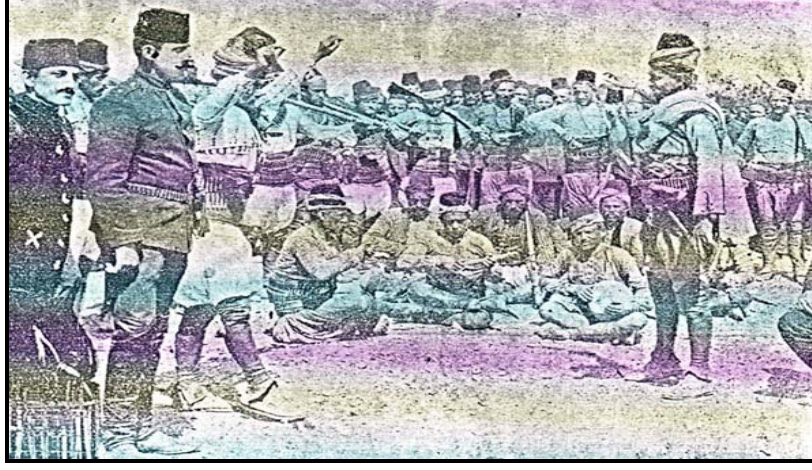
Resim 2 (Türkün Zarif Zeybek Kıyafeti)