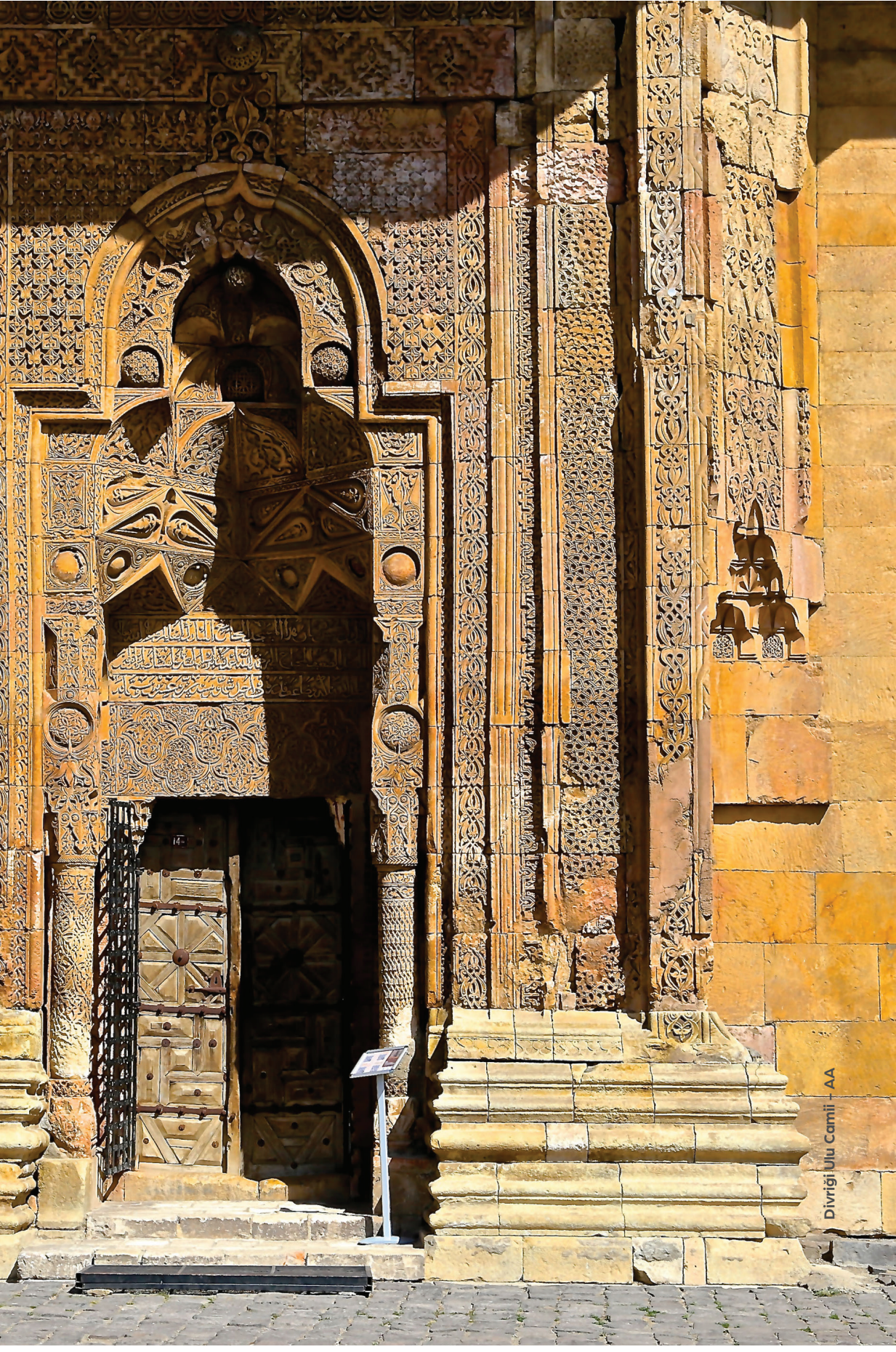
Divriği Ulu Camii