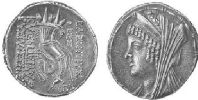
Res. 1. Kleopatra Thea Sikke (Ake-Ptolemais) (BMC Seleucids, XXIII.1).