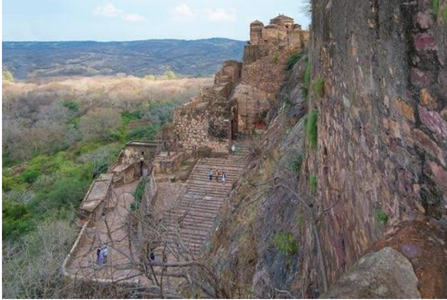
Resim-1: Ratanpûr Kalesinden Bir Görünüm.

sefer, İltutmuş'un da öncelediği bir sefer olmuş ve başarıyla sonuçlandırılmıştır. Kalenin korunaklı oluşunun ve sağlamlığının Hindistan'ın genelinde bilinen bir husus olduğu bahsi ise, tarihçinin devre ve döneme yönelik -toplumsal hafızada meselerin yer edinilişine- bir gönderme olarak durmaktadır. Yine yetmiş padişahın kale önlerine gelip, ele geçiremediklerine dair bahis ise İltutmuş özelinde geliştirilen ve ona yüklenen bir başarı algısı olarak durmaktadır. Burada aslına bakılırsa İltutmuş'un Delhi merkezli olarak devraldığı hâkimiyeti coğrafi açıdan bir bütünlüğe kavuşturma ve devletin geleceğinde o bölgeyi kalıcı hale getirme isteğinin ve planının varlığı görülmektedir ki, öncesi ve sonrası itibarıyla bölge özelinde yaşanacak gelişmeler de bunu destekler mahiyettedir. Dolayısıyla İltutmuş, sultanlık makamına ulaşmadan evvel devletin ilgili birimlerinde edindiği tecrübelerin bir sonucu olarak güçlü ve muktedir bir hükümdar olarak tahta çıkmış ve saltanatının sonuna kadar da bu ve benzeri özelliklerini devam ettirmiştir. Görev aldığı akınlarda ve devlet kademelerinde bulunduğu sırada elde ettiği başarılar -Ratanpûr Kalesi- örneğinde olduğu gibi ona cesaret kazandırmıştır.