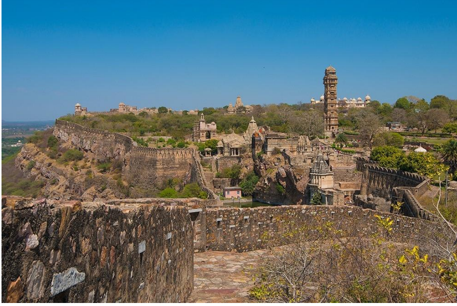
Resim-2: Racastan Tepelerindeki Hisarlardan Bir Görünüm.