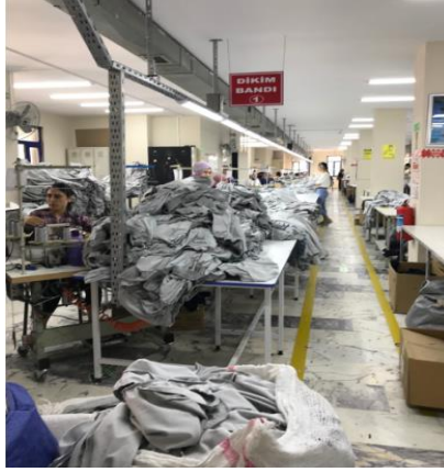
Şekil 2: Dikim bandı çalışma alanı