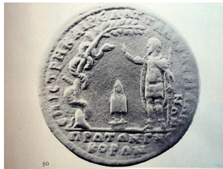
Şekil 11. Telesphoros, Asklepios ve yılanlı buğday ağacı. MS. 3.yyCaracalla Dönemi. (Argın, 2013, Lev. XV)