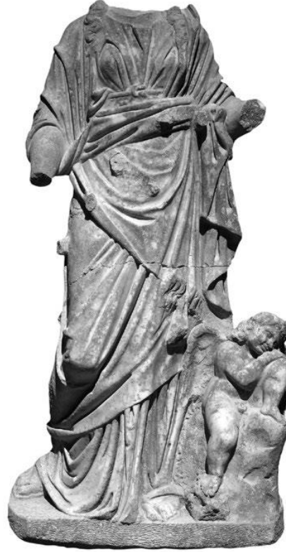
Şekil 12. Anavarza Antik Kentinde Bulunan Hygieia-Hypnos Heykeli. (Gülşen ve Durugönül, 2020)