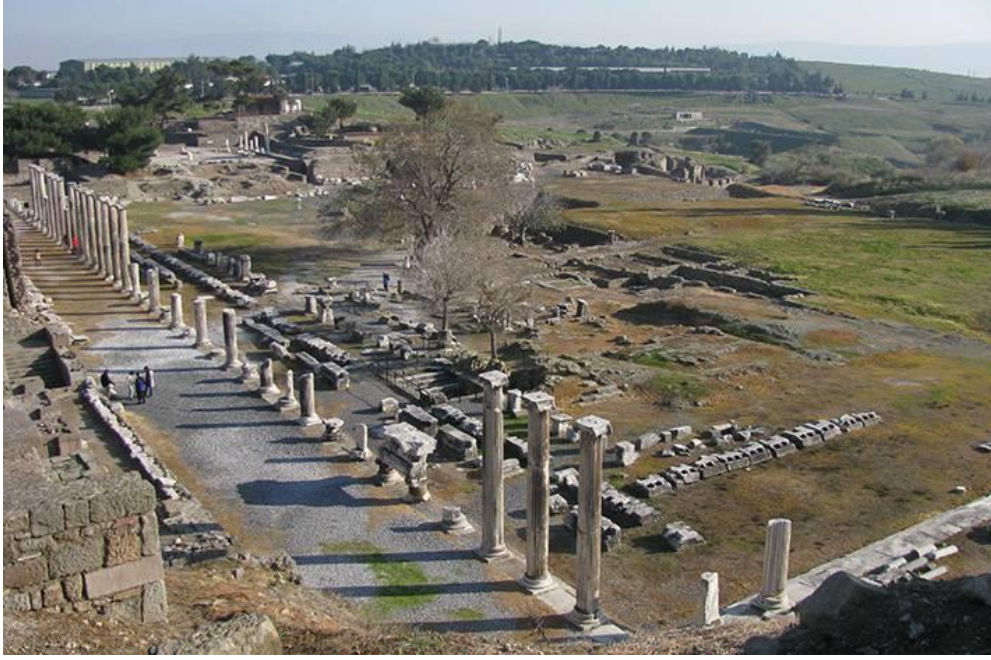
Şekil 4. Pergamon Asklepion’u Kutsal Yol (Bergama Müzesi, t.y.)