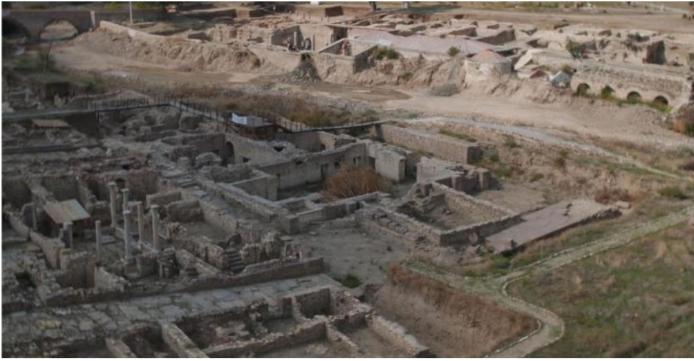
Şekil 3. Allianoi Merkez Yerleşimi Kuzey Doğudan Genel Görünüm (2006) (Baykan, 2019)