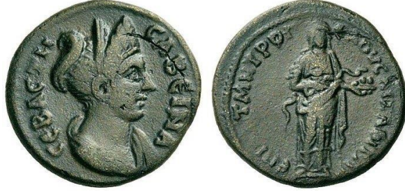
Şekil 8. Hygieia, ellinde tuttuğu tasta kutsal hayvanı yılanı (yumurta? ile) besliyor. Phrygia - Aizanoi. Sabina (Hadrianus'un karısı) M.S. 117-138 (AcSearch, t.y.)