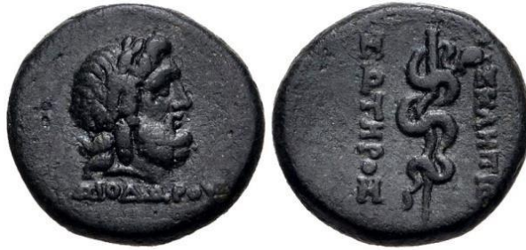
Şekil 5. Asklepios – Yılanlı âsâ Pergamon. M.Ö. 2.yy