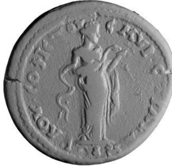
Şekil 10. Bronz Smyrna Sikkesi, Arka Yüz, Hygieia, M.S. 161-169 MarcusAurelius Dönemi. (Akar Tanrıver, 2017)