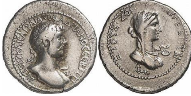
Şekil 9. Hygieia – omzundan kıvrılarak uzanan yılan - altta şehrin simgesi keçi. Aigeai - Hadrian, M.S. 117-138. (AcSearch, t.y.)