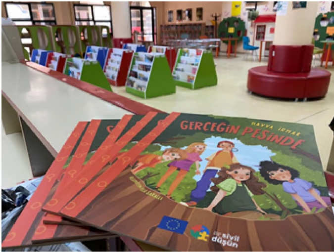
Şekil 4: Gerçeğin Peşinde Kitabı Kütüphanelerde

Bunun yanında, konunun uzmanlarınca Gerçeğin Peşinde adında bir resimli çocuk kitabı ve destekleyici 2 farklı poster (1000 adet) ve broşür (1000 adet) hazırlanmıştır. Kitap 250 adet basılmış olup dijital ve sesli olarak çevrimiçi kullanıma sunulmuştur. Dijital ortamda kısa sürede 2000'e yakın okunmuştur.