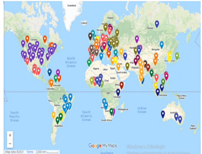
Şekil 1: Etkinliklerin Coğrafi Dağılımı