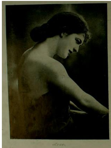
Resim 16. Yirminci Asırda Zekâ dergisi 13. sayı iç kapak görseli