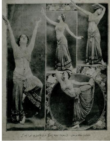
Resim 20. Yirminci Asırda Zekâ dergisi

1 Teşrin-i evvel 1328 tarihli 16. sayı iç kapak görseli