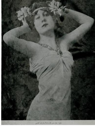
Resim 5. Yirminci Asırda Zekâ dergisi 12 Nisan 1328 tarihli 4. sayı dış kapak görseli

Derginin 4. sayısının dış kapağı için tercih edilen görselde, dekolte kıyafet giymiş, saç aksesuarı ile poz veren bir kadın göstereni yer almaktadır. “Tablo: alem-i maneviyyenin saha-i maddiyatta tecellisi” alt yazısıyla ulviyet parantezi açılarak sunulan göstergenin gösterileni, kadını cinselliği üzerinden yorumlayan, giyimi ve kollarını kaldırarak verdiği pozla bu vurguyu kuvvetlendiren yananlamıdır. Böylece kadının cazibesi ve cinsel kimliği toplumsal kabule, basın aracılığıyla yeni bir inşa olarak sunulmuştur. Zira Türk basın tarihinde kadın figürünün cinsel çağrışımlı kullanımı dönem itibariyle yaygın bir tutum olmamakla birlikte, fikir cereyanları arasında bir tartışma meselesi de değildir.