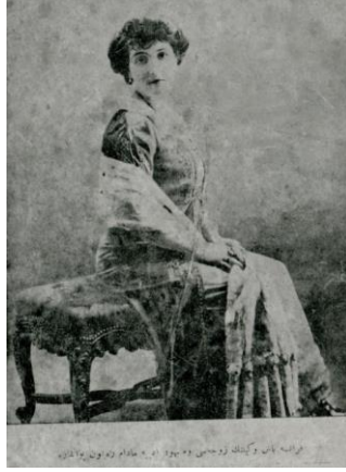
Resim 2. Yirminci Asırda Zekâ dergisi 5 Mart 1328 tarihli 1. sayı iç kapak fotoğrafı

“Fransa başvekilinin zevcesi ve meşhur edibe madam Raymond Poincare” alt yazısıyla derginin 1. nüshasında iç kapak görseli olarak kullanılan fotoğraf, Batılı bir siyasetçinin eşi olan yazar kadını göstermektedir. Fotoğrafın gösterileninin Batılı, zarif, modern kadın olduğu, diğer taraftan zihinlerdeki Şarklı-Garplı zıtlığını tesis ettiği görülmektedir. Batılı kadının yazarlığına vurgu medeniyet bağlamında ele alınmış, aydın kadın kimliği sembolize edilmiştir.