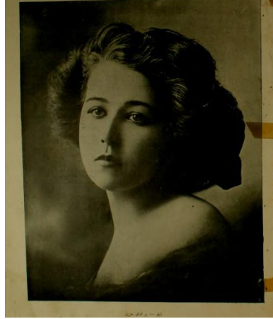
Resim 8. Yirminci Asırda Zekâ dergisi 28 Mayıs 1328 tarihli 7. sayı dış kapak görseli

Derginin 7. nüshası da dış kapakta bir kadın portresiyle yayınlanmıştır. Gösteren olarak omuzları açık, yapılı saçlarıyla bir kadın göstereninin yer aldığı gösterge, “Bir eday-ı hüznün” alt yazısıyla verilmiştir. Göstergede, hüznün, güzellik gibi vasıfların kadınlara atfedildiği bir yananlam tespit edilmiştir.