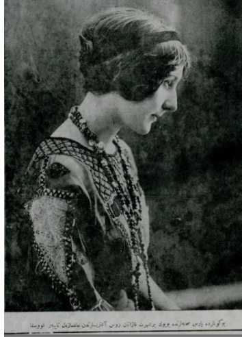
Resim 17. Yirminci Asırda Zekâ dergisi 2 Eylül 1328 tarihli 14. sayı dış kapak görseli

Derginin on dördüncü nüshasının dış kapak görselinde yer alan kadın portresi, “Bu günlerde Paris sahnelerinde büyük bir şöhret kazanan Rus Aktristlerinden Matmazel Napyor Koska.” alt yazısıyla verilmiştir. Profilden çekilmiş bir kadın portresi göstereniyle fotoğraf, gizemli, Batılı, görsel sanatlarla uğraşan modern kadın gösterilenlerden oluşmaktadır. Elbette daha önce de ifade edildiği gibi dönem şartlarında Osmanlı toplumunda kadınların icra etmedikleri bir meslek olan görsel sanatlar hakkında bir görsel ancak Batılı unsurlar içeren gösterenlerden oluşmaktadır.