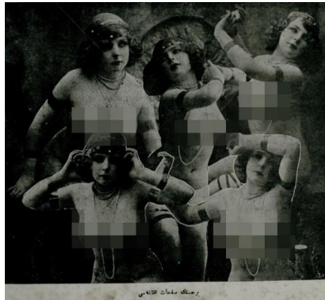
Resim 19. Yirminci Asırda Zekâ dergisi

17 Eylül 1328 tarihli 15. sayı iç kapak görseli