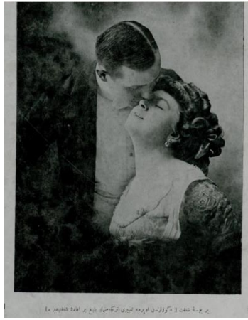
Resim 14. Yirminci Asırda Zekâ dergisi 6 Ağustos 1328 tarihli 12. sayı dış kapak görseli

Derginin 12. nüshasının dış kapak görselinde yer alan gösterge, bir kadın ve bir erkek göstereni ile ve “Bir buse şefkat. ‘Gözlerinden öperim’ tabiri Türkçemizin beliğ bir ifade-i şefkatidir.” alt yazısıyla yer almaktadır. Göstergenin gösterilenleri ise bir kadını gözünden öpen erkek sembolizasyonu, erkeğin kadına gösterdiği şefkate yoğunlaşmaktadır. Kadın-erkek ilişkilerinde cinslere biçilen rollere dair işaretler taşınması bakımından zihinsel bir inşayı temsil etmektedir.