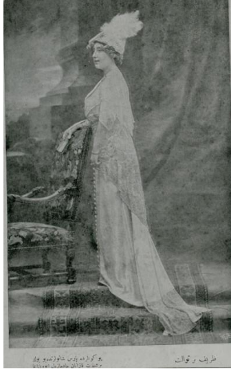
Resim 3. Yirminci Asırda Zekâ dergisi 18 Mart 1328 tarihli 2. sayı dış kapak fotoğrafı

Derginin 2. sayısının dış kapağında yer alan göstergede ise yine Batılı giyimi ile dikkat çeken bir kadın yer almaktadır. Fotoğrafın gösterenlerinde ayakta duran bir kadın, berjer koltuğa tutunarak uzun tuvaletiyle poz vermiştir. “Zarif bir tuvalet. Bu günlerde Paris’te büyük bir şöhret