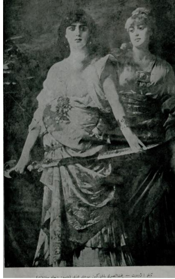
Resim 6. Yirminci Asırda Zekâ dergisi 30 Nisan 1328 tarihli 5. sayı dış kapak görseli

Miladi takvime göre 13 Mayıs 1912 tarihli 5. nüshanın dış kapak görseli olarak kullanılan görsel, meşhur “Judith” tablosudur. Gösterge, birçok ünlü ressam tarafından resmedilen hikayenin kahramanı olan, bir Yahudi kadının portresidir. Gösterge, Yahudilere eziyet eden Asur kralının generali olan Halofernes’i öldürerek Yahudi halkını kurtaran, bunun için günah işlemekten çekinmeyen dindar kadının hikayesini temsil eden tablodur. Elinde bir kılıçla ön planda yer alan kadınla, onun arkasında konumlandırılmış ikinci bir kadın göstereni, yananlamsal bakımdan, hikayenin arka planında yer alan milletini kurtaran kadını sunmaktadır. “Tablo: Judith. Baht-ı Nasırın başını kesen Yahudi kız” alt yazısıyla verilen gösterge, cesur, dindar kadın söylemini sunmaktadır. Dönem metinlerinde Batıcı aydınların dahi dine atıfta bulunarak kadın meselesine vurguları hatırlandığında 1 (Kurnaz, 1991, s. 68) kadını milletin kurtarıcısı sembolizasyonu üzerinden ele alan görselde dindar kadına medenileşme bağlamında biçilen role atıftan bahsetmek yanlış olmayacaktır.