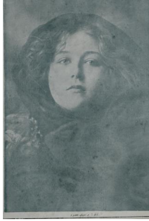
Resim 4. Yirminci Asırda Zekâ dergisi 2 Nisan 1328 tarihli 3. sayı dış kapak görseli

Derginin 3. nüshasında dış kapak için yine bir kadın görseli kullanılmıştır. Şapkalı, genç bir kadının gösteren olarak tespit edildiği görselde, “Tablo: Bir sima-yı masum” alt yazısı yer almış, kadının masumiyeti temsil ettiği vurgusu göstergenin gösterileni ve dolayısıyla yananlamı olarak tespit edilmiştir. Bu bağlamda toplumsal cinsiyet kabulleri bakımından kadını masumiyetle bağdaştıran bir inşa söz konusudur.