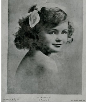
Resim 12. Yirminci Asırda Zekâ dergisi 25 Haziran 1328 tarihli 9. sayı dış kapak görseli

Derginin dokuzuncu nüsha dış kapağında “Masumane bir tebessüm” alt yazısıyla bir kız çocuğunun profil resmine yer verilmiştir. Saçında büyük kurdelesıyla, küçük bir kız çocuğu göstereniyle sunuln bu göstergede, masumiyet temsili olarak özellikle bir kız çocuğu tercih edilmiştir. Burada masumiyet sıfatı dışil cinsiyete atfedilen bir özellik olarak vurgulanmış, kadın cinsinin kimlik inşasına katkı sağlayan bir yananlam üretilmiştir.