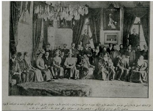
Resim 9. Yirminci Asırda Zekâ dergisi 28 Mayıs 1328 tarihli 7. sayı iç kapak görseli