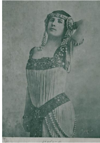
Resim 10. Yirminci Asırda Zekâ dergisi 28 Mayıs 1328 tarihli 8. sayı dış kapak görseli

Derginin 8. nüsha dış kapak görselinde yer alan gösterge, mücevherlerle süslenmiş kıyafet giyen bir kadını göstermektedir. “Tablo: Bir Asuri tuvaleti” alt yazısıyla sunulan göstergede, kolunu kaldırarak poz vermiş bir kadın cinsel kimliğini vurgulayan yan anlamla sunulmuştur.