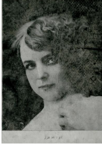
Resim 18. Yirminci Asırda Zekâ dergisi

17 Eylül 1328 tarihli 15. sayı dış kapak görseli