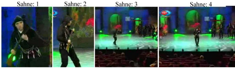
Fotoğraf 3: Çandır Tüfek Oyunu TRT Altın Adımlar GİFSAD (Sahneler: 1-2-3-4)

sahne de kendi etrafında bir tur attıktan sonra, bir el hareketiyle dansçıları sahneye davet eder. Dansçı (çavuş) burada sergilediği vücut hareketleri ile özgüvenini tazelemekte, sahnede ki duruşuyla kendisini biraz sonra başlayacak bir savaşın kahramanlarından birisi olarak göstermektedir; seyirciyi bu ruhsal ve fiziksel duruma odaklamaktadır. Dansçıların sahneye gelmeleri bedensel bir iletişim biçimiyle ilgilidir; komutlar, jest ve mimikler dansın iletişimsel yapısı hakkında önemli bilgiler vermektedir.