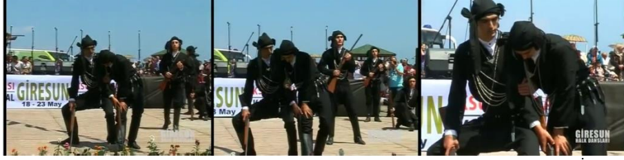
Fotoğraf 6: Giresun Belediye Konservatuvarı Halk Dansları Ekibi Çandır Tüfek Oyunu İcrası

Sunucunun Giresun uşaklarının kahramanlıkları üzerine olan bahislerinden sonra “Çandır” dans müziği başlar. Dans müziğini takiben altı oyuncu sahne ortasında bir çember oluştururken, geriye kalan altı oyuncu da kenarda tek sıra hâlinde dizilirler. Dansçıların tamamında tüfekler çapraz tutuşturulur. Sol-sağ sekmeler eşliğinde çember hâlinde olan dansçılar yüz yüze gelecek biçimde ikişerli eşleşirler ve tüfekleri yatay konumda başlarının üzerine kaldırırlar. Kenardaki altı oyuncu ise hafif diz kırıp ayakları dibine nişan alırlar. Bir sonraki sahnede kenardaki dansçılar yüz yüze gelecek biçimde ikişerli eşleşirler ve tüfekleri yatay konumda başlarının üzerine kaldırırlar. Sahnenin ortasında çember konumunda olan dansçılar da tüfekleri havaya doğrultup nişan alarak ateş ederler.