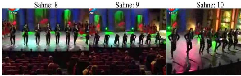
Fotoğraf 5: Çandır Tüfek Oyunu Altın Adımlar GİFSAD (Sahneler: 8-9-10)

belirledikleri ortak bir noktaya aynı anda bir el ateş ederler. Dansçıların hep birlikte ansızın tetiğe basması sonucu çıkan tüfek sesi, izleyicide ani bir sessizliğe, korkuya ve heyecana neden olmaktadır. Dolayısıyla izleyici de artık kendini performansın içine hapsedmiştir. Burada ayrıca sırala biçimi, sayılar ve ritmik hareketler dikkat çekmektedir. Hemen ardından hızlıca tek sıra hâlinde ön tarafa yaklaşıp sağ diz tam, sol diz yarım vaziyette diz kırıp tüfekleri yere bırakırlar ve ayağa kalkıp iki sekme hareketi yaparlar. Dansçılar tüfekleri bırakınca genellikle kızılı erkekli karışımla hızlı bir Giresun karşılaşması oynayarak dansı bitirirler (Performans için ayrıca bakınız: Karekod: 3 ).