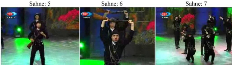
Fotoğraf 4: Çandır Tüfek Oyunu TRT Altın Adımlar GİFSAD (Sahneler: 5-6-7)

Çavuş bu esnada kendi etrafında dönerek dans figürlerinden olan sekme hareketlerini yapar. Buradaki her sekme hareketi, estetik ifade biçimleri yanında kahramanlığın gizil süreçlerini barındırmaktadır. Çavuşun (barutçunun) talimatıyla elinde tüfek bulunan erkek dansçılar da sekme adımlarıyla sahneye gelmektedir. Sekme hareketi eşliğinde sağa ve sola kayan ve kendi içinde arkalı önlü iki sıra hâlinde bir düzen oluşturan dansçılar, çapraz tutuşta olan tüfekleri başlarının üzerine kaldırırlar. Burada sergilenen ritmik hareketler bir av veya düşmana saldırı sahnelerinin canlandırılmasına benzemektedir. Dansta yer alan söz konusu motifler, dansın hikâyesi ve kökeniyle ilgilidir.