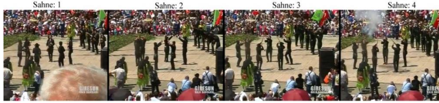
Fotoğraf 7: Giresun Belediye Konservatuvarı Halk Dansları Ekibi Çandır Tüfek Oyunu (Sahneler: 1-2-3-4).

Sunucunun Giresun uşaklarının kahramanlıkları üzerine olan bahislerinden sonra “Çandır” dans müziği başlar. Dans müziğini takiben altı oyuncu sahne ortasında bir çember oluştururken, geriye kalan altı oyuncu da kenarda tek sıra hâlinde dizilirler. Dansçıların tamamında tüfekler çapraz tutuşturulur. Sol-sağ sekmeler eşliğinde çember hâlinde olan dansçılar yüz yüze gelecek biçimde ikişerli eşleşirler ve tüfekleri yatay konumda başlarının üzerine kaldırırlar. Kenardaki altı oyuncu ise hafif diz kırıp ayakları dibine nişan alırlar. Bir sonraki sahnede kenardaki dansçılar yüz yüze gelecek biçimde ikişerli eşleşirler ve tüfekleri yatay konumda başlarının üzerine kaldırırlar. Sahnenin ortasında çember konumunda olan dansçılar da tüfekleri havaya doğrultup nişan alarak ateş ederler.