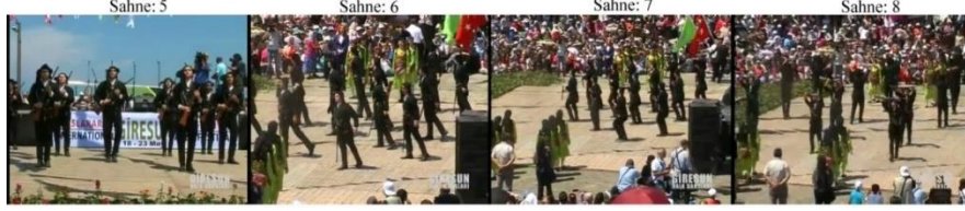
Fotoğraf 8: Giresun Belediye Konservatuvarı Halk Dansları Ekibi Çandır Tüfek Oyunu (Sahneler: 5-6-7-8).

İncelenen her iki içerik birbirine yakın performanslardan meydana gelmektedir. Dansın icra edildiği bağlamsal şartlar, kullanılan kostüm, icraya eşlik eden müzik türü, kullanılan diğer aksesuarlar neredeyse birbirinin aynısıdır. Giresun kültürünün önemli simgelerinden olan Çandır Tüfek Oyununun geleneksel ve günümüz icralarında görülen farklılıklar kültür değişmelerinden kaynaklanmaktadır. Köy düğünlerinin salon düğünlerine dönüşümü ve eski geleneksel önemini kaybetmesi, teknolojik gelişmelere bağlı olarak kullanılan aksesuarların dönüşmesi, kentsel yaşamda silah kullanımının sınırlandırılması gibi unsurlardan dolayı oyunun bağlamsal özelliklerinde değişimler kaçınılmaz olmuştur.