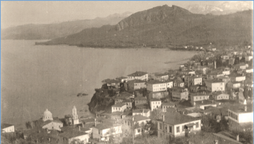
Fotoğraf: 1930'larda Giresun Kalesi ile Gedikkaya arasındaki yerleşim (Ortada Hacıhüseyin Camii) 40