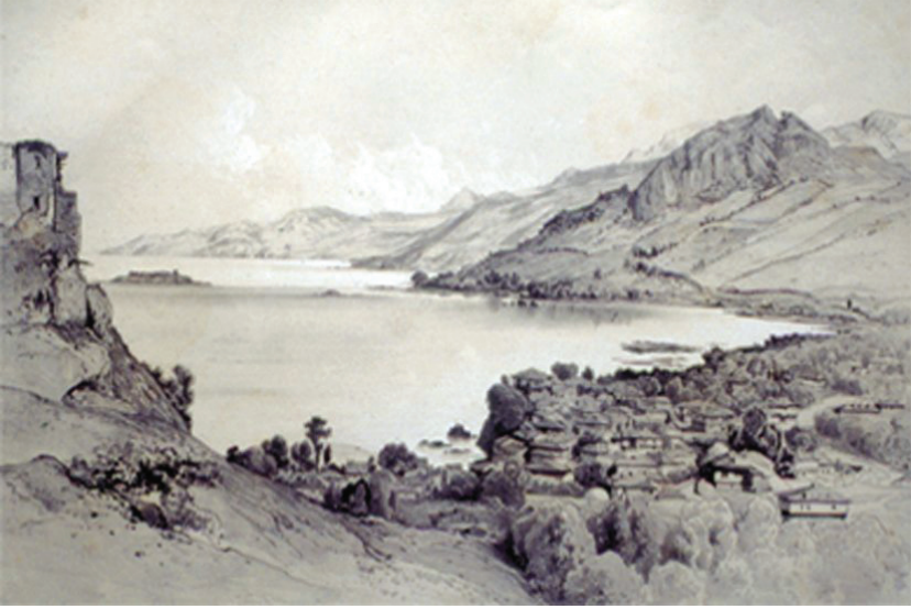
Fotoğraf: 1850'lerde Giresun Kalesi ile Gedikkaya arasındaki yerleşim 39