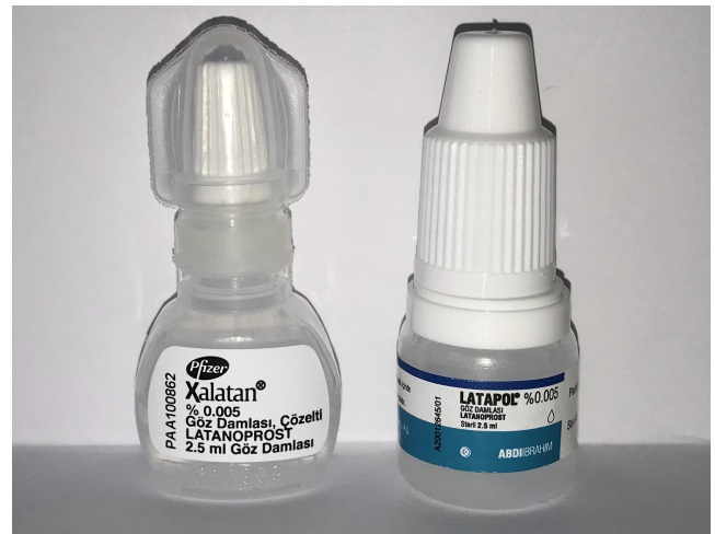
Resim 1. Şişe dizaynlarının dış görünümü

Çalışma insan ya da hayvan ögesi içermediğinden etik kurul onayı gerekmemektedir. Türkiye'de elde edilebilir olan latanoprost etken maddesini içeren 2 firmanın 2 göz damlası çalışmaya alındı (Resim 1).