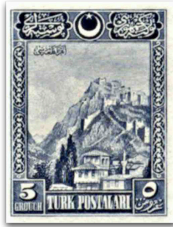
Figure 12: Ankara Kalesi (1926)