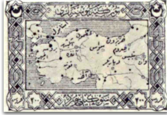
Figure 9: Misak-ı Milli haritası (1922)

bir aidiyet dahilinde kutsal kabul edilen simgesel ve davranışsal öğelerin esasında maddi ve/veya seküler araçlarla dolaşıma sokularak söz konusu araçların barındırdığı söylemi yaygınlaştırdığını düşünmektedir. Böylelikle birtakım mitsel sembollerin referans verdiği kutsal kabuller aracılığıyla toplumsal bir bağ kurulması mümkün olmaktadır.