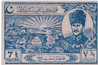
Figure 15: Lozan Sulh Antlaşması hatıra pulu (1924)