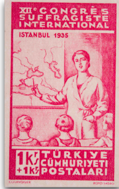
Figure 13: Kadın Hakları Cemiyeti kongre hatıra pulu (1935)

Tayyare Cemiyeti Yardım Pulları serilerinde uçakların koruduğu hem de Cumhuriyetin On Beşinci Yıldönümü Serisi'nde ideal üretim ilişkilerinin olduğu Atatürk Orman Çiftliği (AOÇ) gibi mekânlarla birlikte temsil edilmeyi sürdürdüğü takip edilmektedir.