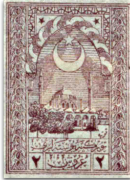
Figure 8: Ayyıldız, Nusretiye Camii ve İstiklal Marşı (1922)

Ankara Hükümeti'nin kendi nam ve hesabına bastırıldığı ilk pullar, 1922 tarihinde tipografik baskıyla üretilen Cenova emisyonları olmuştur. Edirne Selimiye Camii Serisi, (milli mücadele temalı) Posta Serisi, Takse Serisi ve Meclis Serisi'nden oluşan bu pullar ulusal kurtuluş mücadelesinin meşruluğunu tesis edecek bir propaganda işlevi görmekle birlikte yeni kurulacak devletin egemenlik haklarının da altını çizen bir niteliğe sahip olmuştur. Özellikle milli mücadele temalı on iki puldan oluşan Posta Serisi, verilen mücadeleyle ulaşılmak istenen ülküyü anlatılaştırmaktadır (Özdemir & Özdemir, 2017, p. 192): İlk olarak yanmakta olan bir şehrin hemen önünde birbirine intikam yemini eden iki askerin olduğu bir pul görülmektedir (Figure 7). Bu pulu uğruna savaş verilen İzmir'in rıhtımından bir görüntüye eşlik eden Bursa Yeşil Cami ile İzmir Saat Kulesi süslemelerinin oluşturduğu bir kompozisyon izlemektedir. Nusretiye Camii'nin olduğu pulda ise Ayyıldız ile İstiklal Marşı'nın son iki dizesi olan "Hakkıdır Hakka Tapan Milletimin İstiklal, Hakkıdır Hür Yaşamış Bayrağımın Hürriyet" yazısı bulunmaktadır (Figure 8). Seri TBMM ordusu üniformasıyla ve süngü tüfeğiyle bir askerin temsilinin yanı sıra, ayaklarını