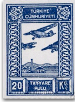
Figure 24: Tayyare Müdafaa Pulları Serisi (1936-1937)