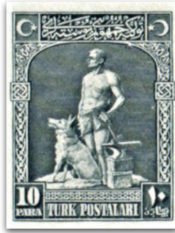
Figure 10: Bozkurt ve demirci (1926)