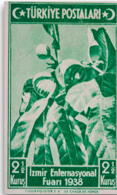
Figure 28: İzmir Enternasyonal Fuarı Serisi pulu (1938)

Söz konusu seri, esasında on beş yılda hayata geçirilen politikalara ve gerçekleştirilen reformların özeti niteliğini taşımaktadır. Yukarıdaki örneklerde anıldığı gibi ulaşım teknolojilerine yapılan yatırımların yanı sıra hem sanayide hem tarımda kalkınma ve modernizasyonun temsillerinin de öne çıktığı görülmektedir. Bu durum “simgelerin iktisadi güç ilişkilerindeki mübadeleyi imleyen konumu”ndan kaynaklı (Bourdieu, 1991b,