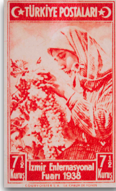
Figure 27: İzmir Enternasyonal Fuarı Serisi pulu (1938)