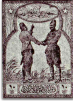
Figure 7: Yanmakta olan bir şehrin önünde intikam yemini eden askerler (1922)