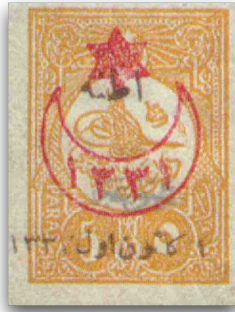
Figure 5: Sürşarjlı Birinci Adana Hatıra Serisi pulu (1921)

sürşarjlanması yoluyla da pullarda temsiline yer verilmiştir. Bunlardan birini de Londra'da taş ve gravür baskı tekniğiyle üretilen İstanbul Manzaralı Posta Pulları Serisinin 1 Ekim 1914 tarihinde İmtiyazat-ı Ecnebiye'nin Lağvı (Kapitülasyonların Kaldırılması) lafzıyla sürşarjlanan seri oluşturmuştur. 16 Mart 1920'de İstanbul'un işgal edilmesiyle yürürlüğe konulan haberleşme yasağının ardından Ankara'da Dahiliye Vekaleti altında doğrudan Mustafa Kemal Paşa'ya bağlı olarak çalışacak Posta ve Telgraf Umum Müdürlüğü kurulmuş (Akan & Kuran, 2019, p. 138) ve milli mücadele döneminde Osmanlı'dan kalan veya Osmanlı tarafından ısmarlanmasına rağmen Ankara Hükümeti'nin kullanımına geçen (Togay, 2008) pullar sürşarjlanarak kullanılmıştır. Meclis Hükümeti'nin 1920-1922 yıllarında kullandığı pullarda sırasıyla "Ankara 3 Guruş" (Figure 4), "Osmanlı Postaları 1336", "Osmanlı Postaları 1337" sürşarjları kullanılmış (Ağaoğulları & Pabuçcuoğlu, 2018, pp. 119-135); 1 Aralık 1921'de Birinci Adana Hatıra Serisi (Figure 5), 5 Ocak 1922'de İkinci Adana Hatıra Serisi (Figure 6) sürşarjları tedavüle sokulmuştur. Bu seriler Ankara ve Fransız hükümetleri arasında Sakarya Meydan Muharebesi'nde TBMM ordularının kazandığı zaferin ardından imzalanan Ankara Antlaşması ile güneydeki savaşın resmen sona erip, Fransızların Adana ve çevresini tahliye etmesi üzerine sürşarjlanması sebebiyle bir ilk olmuştur (Garmiryman, 1979, p. 5; Alp, 2016a).