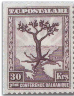
Figure 11: Balkan Konferansı hatıra pulu (1931)