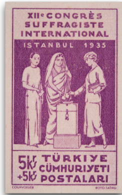
Figure 14: Kadın Hakları Cemiyeti kongre hatıra pulu (1935)