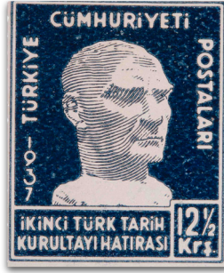
Figure 20: İkinci Türk Tarih Kurultayı hatıra pulu (1937)