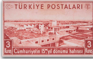
Figure 26: AOÇ (1938)