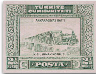
Figure 22: Kızılırmak Köprüsü (1929)