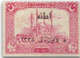
Figure 6: Sürşarjlı İkinci Adana Hatıra Serisi pulu (1922)