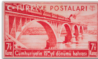
Figure 23: Akçay Köprüsü (1938)