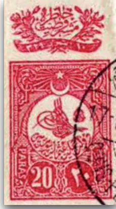
Figure 3: II. Meşrutiyet'in ilan edilmesi sonrası mebuslara hediye edilen pul (1908)