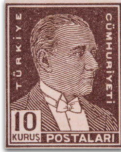
Figure 16: Birinci Atatürk Serisi (1931-1932)

Pullarda yapılanmış yapı olarak ulus temsillerinin son görünümü ulusun geçmişe dönük kökensel referansların yanı sıra çağdaşlık hedefleri de barındırması üzerinden şekillenmektedir. Bu çerçevede Bourdieu'nün (2013a, p. 95) aynı zamanda "erdemle dönüşmüş bir zorunluluk" olarak kavradığı habitüsün Cumhuriyetin kurucu kadrolarının muhayyilesinde kadının toplumsal formasyonun tüm yapılarına katılımında cisimleşen bir erdem şeklinde tezahür etmiş olduğu görülmektedir. Dolayısıyla ulusun tüm bileşenlerinde kadına yönelik dogmatik ve sınırlayıcı engellerin kaldırılması noktasında bir ortak duyunun yaratılması hedeflenmiştir. Bunun Erken Cumhuriyet Dönemi pullarına yansımaları da Türk kadınının bir çiftçi olarak tarlada çalışırken, bir öğretmen olarak sınıfta tahtanın başında ders anlatırken (Figure 13), bir memur olarak daktilonun önünde otururken, bir pilot olarak uçağın kokpitinde bulunurken ya da bir seçmen olarak sandık başında siyasal katılım süreçlerinde yer alırken (Figure 14) çerçevelenmesi şeklinde olmuştur.