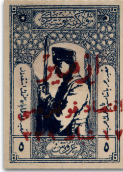
Figure 21: İzmir İktisat Kongresi sürşarjlı hatıra pulu (1923)

bağımsızlık sorunu olarak ortaya çıkmıştır” (as cited in Goloğlu, 2017, p. 157) ifadeleri demiryollarına dair temsillerin çokluğunu da açıklayan bir anlam içermektedir. Öyle ki bu durum hem Cumhuriyetin On Beşinci Yıldönümü Serisi’nde yer alan yedi puldan birinin Nazilli – Bozdoğan tren yolu üzerindeki Akçay Köprüsü’ne ayrılmasında (Figure 23) hem de Ankara – Erzurum hattı açılışı için müstakil bir seri basılmasında da görülmektedir. 20 Ekim 1939 tarihli söz konusu müstakil seri, bu temsillerin Erken Cumhuriyet Dönemi sonrasında da sürdüğünü göstermektedir.