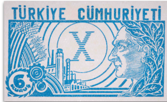
Figure 19: Cumhuriyetin Onuncu Yıldönümü hatıra pulu (1933)