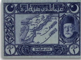
Figure 2: Çanakkale Cephesi ve Sultan Mehmed Reşad'ın portresi (1917-1918)