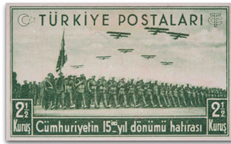
Figure 25: Cumhuriyetin On Beşinci Yıldönümü Serisi pulu (1938)

Ulaşım teknolojilerindeki bir diğer temayüz çabasının pullardaki temsilinin havacılık alanında olduğu görülmektedir. Bizzat Atatürk'ün emriyle kurulan ve "uçan bir Türk Gençliği yaratması" hedeflenen (Damalı, 2003, p. 94) Türk Tayyare Cemiyeti için gelir temini amaçlı çeşitli yıllarda tedavüle sokulan yardım pullarının tarihsel süreç içerisindeki değişimi milli kalkınma programıyla paralel ilerlemektedir. 1926 yılındaki seride Ayyıldız altında süzülürken görülen bir tayyare, 1927 emisyonunda yeni devletin başkenti Ankara'nın tarihi hisar bölgesinin üzerinde görülmektedir. Hisar üzerindeki bu temsil, 1931 tarihinde yeni harflerle basılan seride de görülmekte, 1936-1937 tarihli tipografik baskı Tayyare Müdafaa Pulları Serisi'nde ise uçakların artık yapılaşmış bir kentin ve fabrikaların üzerinde uçtuğu takip edilmektedir (Figure 24). Bu düşüncelere paralel olarak Cumhuriyetin On Beşinci Yıldönümü Serisi'nde yer alan bir diğer pulda askeri bir kıta üzerinde yer alan uçakların resmedilmesi, temayüz çabasında konuya verilen önemi serimlemektedir (Figure 25).