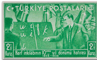
Figure 18: Harf İnkılabının Onuncu Yıldönümü Serisi (1938)