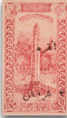
Figure 4: Ankara Hükümeti'nin kullandığı sürşarjlı pul (1920)

Pullardaki padişah portreleri yer yer Dolmabahçe Sarayı gibi sembolik yapılarla yer de Birinci Dünya Savaşı'nda Osmanlı ordularının savaştığı Çanakkale ve Hicaz gibi cepheleri tasvir eden resimlemelerle birlikte pullarda yer almış (Figure 2), bunları II. Meşrutiyet'in ilanı gibi dönüşümleri (Figure 3) ya da Hürriyet Bayramı gibi özel günleri anmak için bastırılan pullar izlemiştir. Osmanlı'nın yanı sıra hem milli mücadele hem de Cumhuriyet dönemlerinde zaman zaman pulların sürşarj denilen teknikle yeniden üretildikleri ve kullanıma sokuldukları da görülmüştür. Mevcut pulun üzerine sonradan baskı yoluyla yapılan manipülasyonu ifade eden sürşarjlama işlemi, pullara yeni mali değer kazandırılmasının yanı sıra birtakım tarihsel olay ve olguların pullar aracılığıyla anılması amacıyla yapılmıştır. Böylelikle söz konusu olay ve olguların mevcut pulların