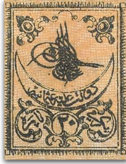
Figure 1: Sultan Abdülaziz tuğrası [Tedavüle sokulan ilk pul] (1862)

dininin sembolü olarak hilal ve hem Anadolu hem de Rumeli sancaklarında bulunan ay ve yıldız bu dönemde tedavüle sokulan pulların resimlemelerinde önemli yer edinmiştir. Sultan Abdülaziz'in yönetimden el çektiği ve Anayasal monarşinin ilan edildiği 1876 yılının Eylül ayında bastırılan Aylık Pullar Serisi'nde Osmanlı İmparatorluğu lafzı ilk kez Latinize harflerle "Emp. Ottoman" şeklinde geçmiştir. Bu tarihten sonra basılan pulların mali değerlerine hem Arap hem Latin rakamlarıyla ve harfleriyle yer verilmiştir. Toplumsal ve siyasal hayattaki modernizasyona dair politikaların pullara yansıdığı bir diğer gelişme, yüzyıllarca minyatür sanatı aracılığıyla ikame edilen İslam inancının Hanefi yorumundaki resmetmeye ve tasvire dair ihtilafın aşılımaya başlaması olmuştur; Sultan Mehmet Reşad döneminde basılan pullar hem İstanbul ve Edirne gibi kentlerden manzaraların hem mimari yapıların hem de bizatihi padişahın portrelerinin yer aldığı kompozisyonlardan oluşmuştur.