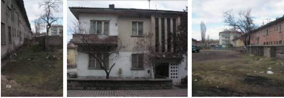
Şekil 7: Belediye Lojmanları

1960lardan sonra bölge dört katlı yapılanmaya başlamıştır. Bu tarihlerden kalan birçok yapının da yok olmuş olmasına rağmen, mahallenin genel görünüşünü bugün de bu yapılar oluşturmaktadır. 1980 ve 90larda her ne kadar bazı yeni yapılar da gabari olarak eskiyi korumuşlarsa da, bu yılların kendi üslubunu yansıtmışlardır. 2000den sonra gabari de değişerek sekiz katlı yapılaşma başlamış ve eski dokunun değişmesine sebep olmuştur.