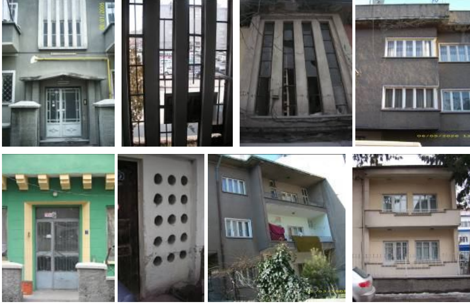
Şekil 3: Sahabiye Mahallesinden Detaylar

Mahallenin, İstasyon Caddesi ve Ahmet Paşa Caddesi boyunca görülen dokusu hariç, aslında birçok kişiye göre (focus gruplar) asıl Sahabiye Mahallesi olarak düşünülen, ya da inanılan iç bölümü, Belediye Bloklarının dışında çok benzer bir doku sergilemektedir. Modernist geleneğin daha sonraki örnekleri oldukça karakterless bir çevre oluşturmuşsa da ilk örnekler hassas detaylar ve insan ölçeğinde sıcak komşuluklar oluşturmuştur. 1960 ve 70lerin karakterini belli eden büyük ve söveli pencereler, yatay çizgiler ve benzer görünüşler bu yapıların kolaylıkla ayırt edilmesini sağlamaktadır. Doku ve yoğunluk diğer birçok iç Anadolu kentinde olduğu gibi o dönemdeki Türk Konut Mimarisininin bir başka karakterini yansıtmaktadır.