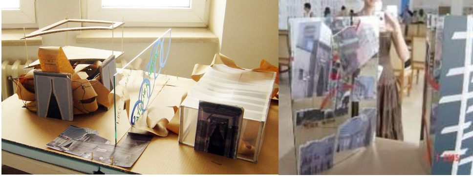
Şekil 6: Yapıların Birbiriyle Etkileşimini Tartışan Öğrenci Çalışmaları 18 .