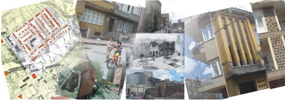
Şekil 1: Sahabiye Mahallesi'nin Anlatısı

lamalar ya da geniş çaplı tanımlamaların anlatılarını araştırma bölgesine taşır. Somers'ın bu tanımlayıcı ve sınıflandırıcı bakış açısı, anlatının geçirgen ve bütüncül bir anlama biçimi olduğunu ihmal ederken, parçaları bütünden önce tanımladığı için bir açıdan indirgemeci bir konuma düşmektedir. Ancak, bu bütünü oluşturmaya yarayan ilişkileri tam olarak ortaya çıkarmasa da, mimarlık ve kent bağlamında bir anlama yöntemi oluşturmaya yardımcı olduğu düşünülerek bu çalışmanın ilişkiler zinciri içinde yer almıştır. Anlatıyı bu şekilde parçalanabilir ve ayrıştırılabilir olarak tanımlamayan diğer araştırmacılar gibi, bu çalışma da anlatıyı, her katmanın birbirini görünür kıldığı bir bütünü okuma yöntemi olarak anlamış, anlatıyı da bu şekilde oluşturmaya çalışmıştır.