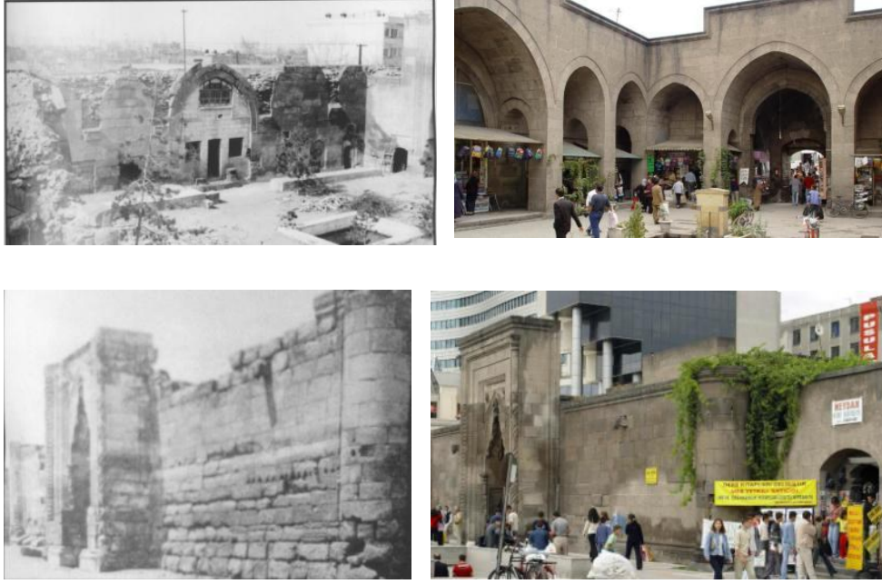
Şekil 5: Sahabiye Medresesi'nin 1923'deki Ve Günümüzdeki Durumu

2000'de Hilton Oteli ve Almer Alışveriş Merkezi açılınca, yan yana duruşları ile otel ile medrese, meydandan mahalleye yaklaşanlar için dikkat çeken bir tezat ortaya koymaktadır. Farklı zamanların farklı mimarlık anlayışlarını ortaya koyan bu iki büyük yapı, birbirini ve Sahabiye Mahallesi'ni etkilemeye devam etmektedirler. Alışveriş merkezinin, medrese kapısını referans alan biçimsel soyutlama girişimi, ağırlığıyla medrese ile rekabet eden kütlelerinin yanında etkisiz bir çaba olarak görünmektedir. Bu etkileşimde ilk izlenim, medresenin yeni tasarımı etkilediği yönündeyse de dikkatli bakışlar karşılıklı bir etkileşimi ayırt edebilecektir. Bir yanda otel medreseyi referans alırken, diğer yandan yeni yapının biçimi ve boyutları da yılların üstüne yığıldığı değer ağırlığıyla 800 yıldır bu köşeyi taçlandıran Sahabiye Medresesinin karakterini ve mahalle ile ilişkisini değiştirmiş, dönüştürmüştür. Birbirlerine bu kadar yakın duran ve farklı zaman ve mekân anlayışına sahip bu iki yapının oluşturduğu, tezatların birbirini var etme mücadelesi, Sahabiye Mahallesi'nin bütününde görülen enerjinin bir parçasını oluşturmaktadır.