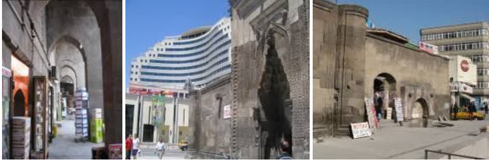
Şekil 4: Sahabiye Medresesi

Medresesi, etrafını sarmalayan ve aurasını deęiřtiren, katkılara raęmen bu mahalleye gelen ziyaretçilere kentin tarihsel altyapısını çarpıcı bir şekilde hatırlatmaktadır. Bu bağlamda medresenin varlığı Somers'ın sınıflaması göz önüne alındığında bir üst anlatı olarak kabul edilebilir.