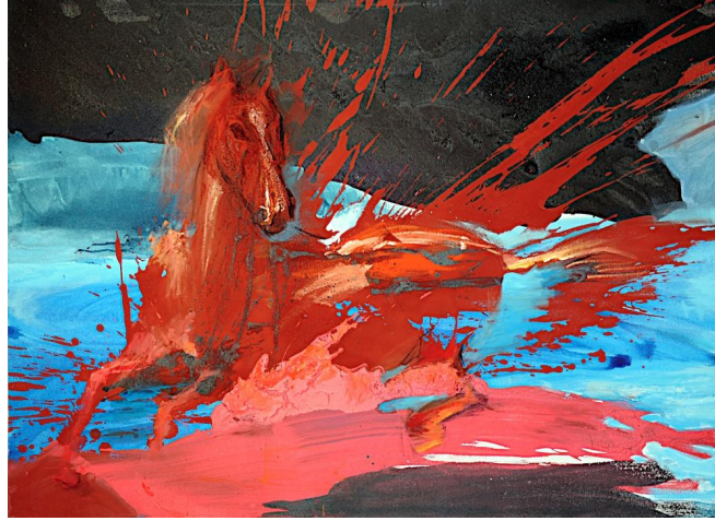
Hakan Pehlivan, Dimitris Vasileau, 110*140 cm T.Ü.Y.B 2010

Karşılıklı diyalog ve işbirliğini teşvik, barış temelleri geliştirmek için gerekmektedir. Huzurlu ve müreffeh nesiller için barışçıl bir işbirliği, bir sinerji ile gerçekleşebilir.