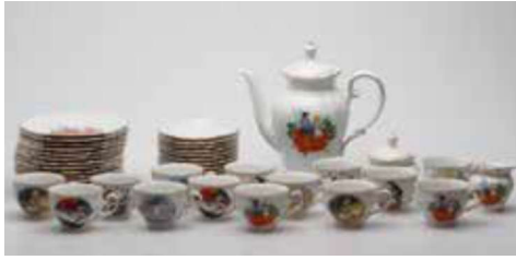
Görsel 22: Fyrklövern, Çay takımı seti.

Bu çay takımında Andersen Masalları'ndan sahnelerin resimleri dekal olarak ürünlerin üzerine transfer edilmiştir. Koleksiyonerlerin listesinde de bulunan bu parçaların her biri Andersen'in farklı bir masalını betimlemektedir.