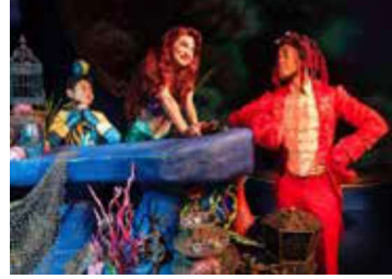
Görsel 6: Küçük deniz kızı müzikali, Şikago, 2015.

Sahne ve müzik sanatları ile ilgili yapılan çalışmaların yanı sıra fotoğraf sanatı ile de Andersen Masalları çok etkili yansıtılmıştır. Reklam çekimleri, moda fotoğrafları ve sanat fotoğraflarına da uyarlanmıştır. Andersen Masalları 'ndan Prenses ve Bezelye Tanesi masalındaki üst üste duran yataklar sembolü birçok fotoğraf sanatçısına ilham olmuştur.