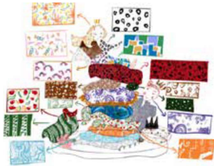
Görsel 31: Yazar tasarımı, Prenses ve Bezelye Tanesi tasarımı, 2022.

Bu tasarımın uygulama aşamasında malzeme olarak beyaz çamur ve teknik olarak da serbest şekillendirme yöntemi kullanılmıştır. Şekillendirilen form, kurutulduktan sonra sıraltı fırça dekoru ile tasarımda görülen dekorlar uygulanmıştır (Görsel 32). Bir kere