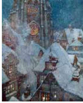
Görsel 1: Edmund Dulac, Andersen Hikâyeleri, Karlar Kraliçesi Masalı İllüstrasyonu 1911.