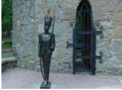
Görsel 18: Soldan sağa, Kurşun asker ve Küçük denizkızı, Andersen Grad.

la ve bulduğu farklı malzemeleri birleştirerek eşsiz bir eser oluşturmuştur (Görsel 17) (URL-15). Karlar Kraliçesi masalından ilham alarak yaptığı bu art doll eserinde izleyiciye görsel bir şölen sunmaktadır. Sanatçı; eseri oluştururken kâğıt, ahşap ve polimer kilden yararlanmışır.