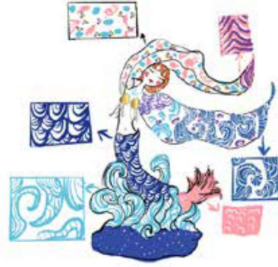
Görsel 30: Yazar tasarımı, Küçük Denizkızı tasarımı, 2022.

Andersen Masalları'ndan biri olan Küçük Denizkızı Masalı'ndan esinlenilerek bir tasarım oluşturulmuştur. Küçük Denizkızı adı verilen bu tasarımda sıraltı tekniği ile özgün dekorlar kullanılması planlanmıştır (Görsel 30). Bu tasarımın manifestosu: "Okyanuslarda tek başına yaşayan küçük bir denizkızı yalnızca özgürce dünyayı dolaşabilmek istedi. Bir anda oluşan kanat uzuvlarıyla derin suların üzerine, yeryüzüne çıktı. Etrafına bakındı ve izbe sokakların arasından geçerek ilerledi. Tek amacı ait olduğu yeri bulmaktı."