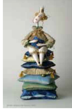
Görsel 14: Olga Egupets, Prenses ve Bezelye Tanesi.

Kumaş çeşitleri ve polimer kil kullanarak tasarımlarını oluşturan Olga Egupets ise sevimli figürleri ve eşsiz kumaş seçimleri ile insanları gerçek dünyadan bir an olsun uzaklaştırabilmeyi başaran art doll sanatı ile ilgili önemli çalışmalar yapmıştır (Görsel 14) (URL-12).