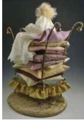
Görsel 13: Cindee Moyer, Prenses ve Bezelye Tanesi.