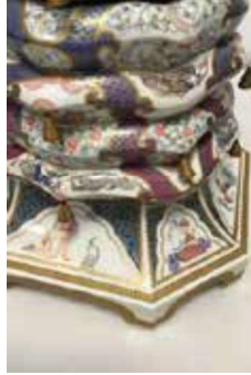
Görsel 25: Cathy Akers, Prenses ve Bezelye Tanesi.