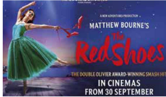
Görsel 4: Matthew Bourne, Kırmızı Ayakkabılar, Bale Gösterisi, 2016.

Kırmızı Ayakkabılar masalı aynı zamanda bale olarak 2016 yılında Matthew Bourne tarafından sahneye taşınmıştır (Görsel 4) (URL-2). Ayrıca İngiliz şarkıcı ve söz yazarı Kate Bush'un yedinci albümü “The Red Shoes” yine Andersen Masalları'ndan etkilenerek oluşturulmuştur (Görsel 5) (URL-3).