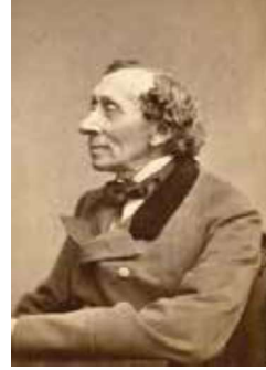
Görsel 2: Hans Christian Andersen Portresi, 1869.