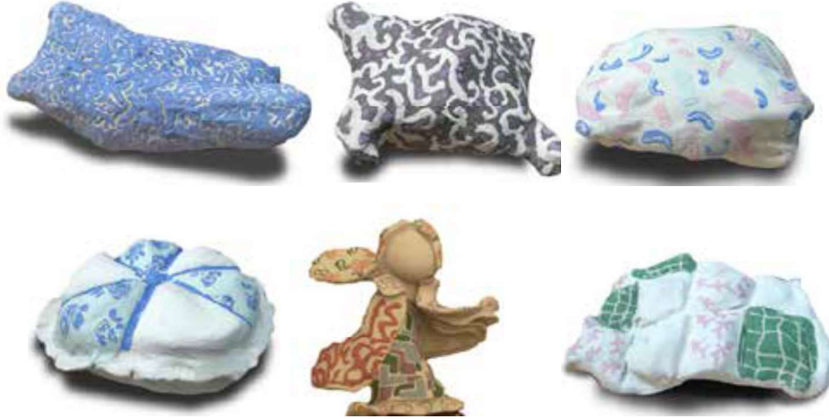
Görsel 33: Yapılan seramik uygulamanın dekor aşamaları.