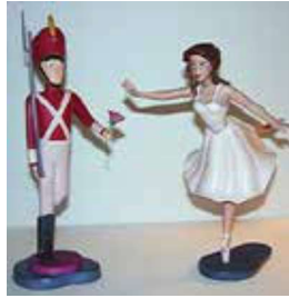
Görsel 16: Disney, Fantasia serisi, Kurşun Asker, 2000