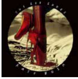
Görsel 5: Kate Bush, Kırmızı Ayakkabılar Albüm Kapağı, 1993

Andersen Masalları' nın en sevilenlerinden biri olan Küçük Denizkızı müzikali 2015'te Şikago'da sahnelenmiştir (Görsel 6). Büyük ilgi gören müzikal birkaç yıl boyunca sahnelenmeye devam etmiştir (URL-4).