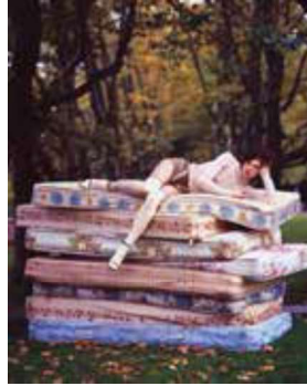
Görsel 7: Walker, Tim. Dreaming of England.2007 U.K Vogue.

Hans Christian Andersen masallarını yazmaya başladığından beri basılan kitaplar için birçok resim ve illüstrasyon çalışmaları yapılmıştır. Geleneksel yöntemler kullanılarak yapılan çizimlerin yanı sıra dijital ortamda ortaya