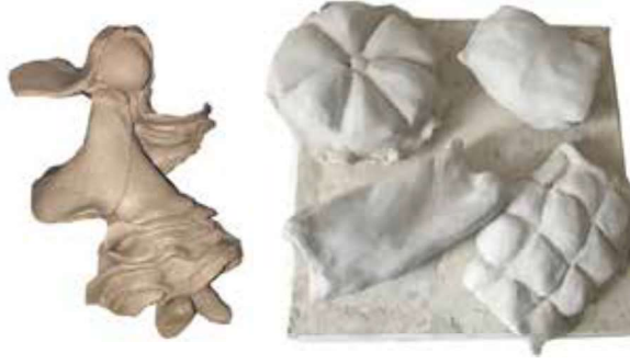
Görsel 32: Yapılan seramik uygulamanın şekillendirme ve dekor aşamaları.

fırlandıktan sonra şeffaf sır ile sırlanıp elektrikli fırında 1060°C sıcaklıkta tekrar pişirilmiştir (Görsel 33).