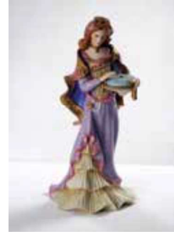
Görsel 20: Keld Moseholm, Kralın Yeni Giysileri, 1936.