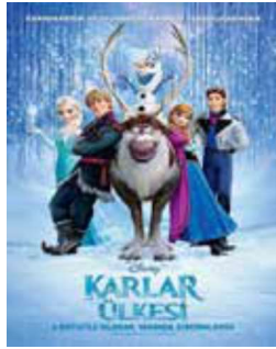
Görsel 3: Walt Disney- KarlarÜlkesi; 2013

Andersen'in çağdaş sanat uyarlamalarından en bilinenleri de müzikallerdir. Andersen Masalları'nın film ve müzikal dışında edebiyat alanında yazılan kitapları, operaları, bale gösterileri, video oyunları ve televizyon şovlarıyla ilgili uyarlamaları da yapılmıştır.