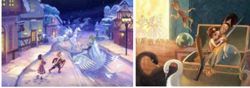
Görsel 9: Sumi Blumina, Karlar Kraliçesi ve Kurşun Asker Masalı illüstrasyonları.

Kuri Huang dijital illüstrasyonlarının yanı sıra Andersen Masalları kitap kapağı tasarımı ve mockupları da yapmıştır (Görsel 11) (URL-8). Anna Fedotova'nın da yaptığı Andersen Masalları kitabı kapağı için mockup çalışması masalların içeriğini yansıtmaktadır (URL-9). Kullandığı altın yıldız efektleri ile yediden yetmişe tüm yaş grubunu kitabın içine çekmeyi başarmıştır (Görsel 12).