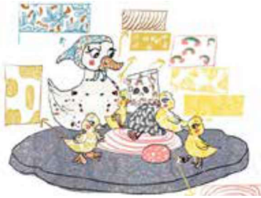
Görsel 29: Yazar tasarımı, Çirkin Ördek Yavrusu tasarımı, 2022.

Tasarlanan bu seramik heykeller ile Hans Christian Andersen'in güçlü hayal gücü ile yazılmış Andersen Masalları'nı keyifle göz önüne sermek amaçlanmıştır. Bu tasarımlardan ilki Çirkin Ördek Yavrusu Masalı'ndan esinlenilmiş olan tasarımdır (Görsel 29).