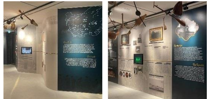
Şekil 2. “Bizdeki Dünya, Dünyadaki Biz”, Atatürk Kültür Merkezi Müzik Platformu sergisi (URL-1).

Türkiye’nin müzik mirasında; Anadolu, Asya ve Akdeniz kültürlerinin yanı sıra Türk ve İslâm kimliklerinin, ayrıca Osmanlı ve Cumhuriyet dönemlerinde Avrupa ile kurulan ilişkilerin de önemli rolü vardır. Bu etkileşimin izleri, Türkiye’ye komşu olan ülkelerin müzik kültürlerinde de görülmektedir. Asya, Akdeniz ve Avrupa kültürleri de Türk müziğinden etkilenmiş, bu birlikteliklerden yeni çalgılar ve eserler üretilmiştir (URL-1; Rona, 2021).