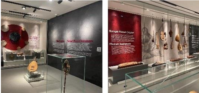
Şekil 3. "Türk Çalgıları", Atatürk Kültür Merkezi Müzik Platformu sergisi (URL-1).

Türk müzik kültürü, tarih boyunca geniş bir coğrafi alana yayılmış olan Türklerin farklı kültürlerle etkileşimleri sonucunda pek çok koldan beslenmiştir. Türklerin kullandığı, ilk izleri Orta Asya'da görülen çalgılar, tarihsel süreç boyunca bu etkileşimlerle malzeme ve biçim gibi yapısal değişimlere uğramıştır. Türk topluluklarının kullandıkları çalgıların gelişiminde yerleşik yaşama geçtikleri Anadolu ve Trakya toprakları da önemli bir rol oynamıştır (Rona, 2021).