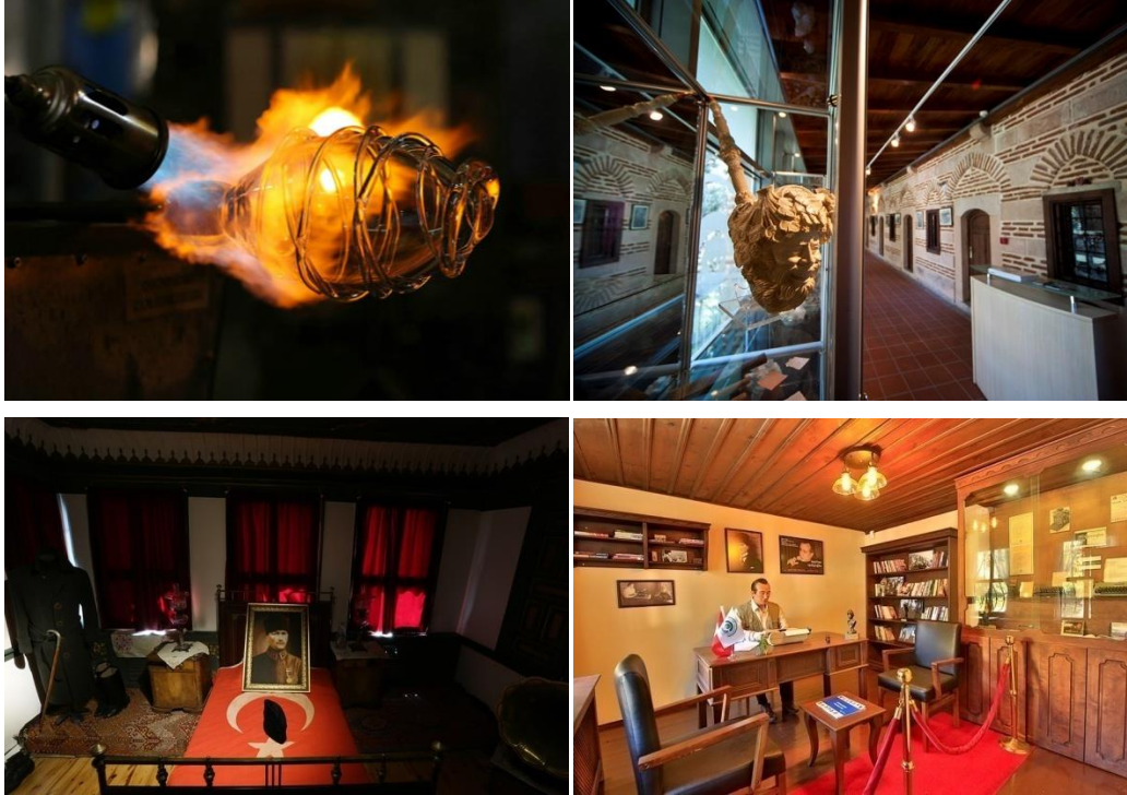
Şekil 3. Odunpazarı kentsel sit alanında bulunan atölye ve müzelerden görünüm.

Turizm sayesinde festival ve etkinlikler arttı. Konserler, ahşap festivalleri ve toprak festivalleri yapılıyor (K17).