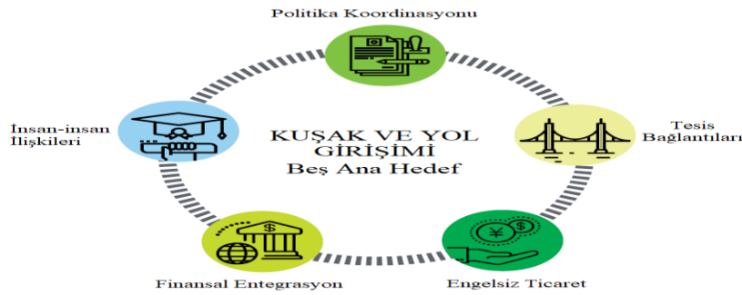
Şekil 2: Bir Kuşak Bir Yol Beş Ana Hedef