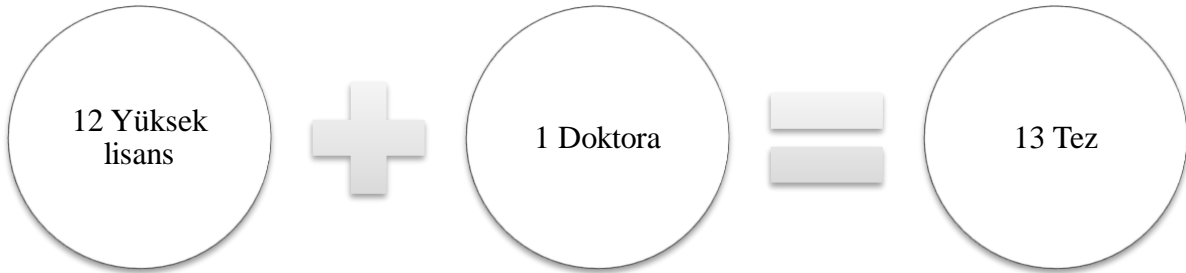
Şekil 2. Özel gereksinimli bireylerin ailelerine yönelik yapılan araştırmaların kademesi

Araştırma kriterlerine uyan özel gereksinimli bireylerin ailelerine yönelik yapılan araştırma sayısı toplamda 13'tür.