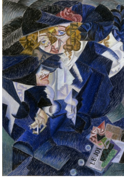
Şekil 4. Gino Severini, "Madam S'nin Portresi", 1912 (URL-2, 2020).