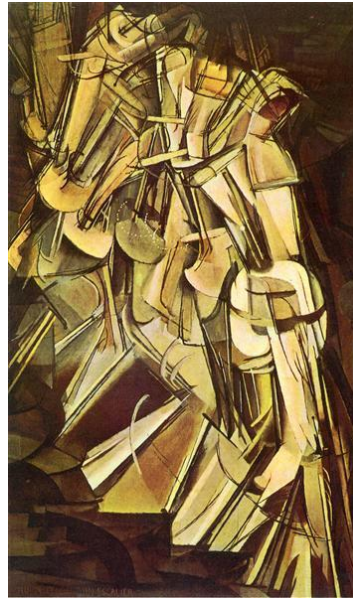
Şekil 11. Marcel Duchamp, "Merdivenden İnen Çıplak No:2", TÜYB, 146x89 cm, 1912, Philadelphia Sanat Müzesi, Philadelphia (URL-6, 2019).

"Bir Dansçının Dinamizmi" adlı çalışma (Şekil 10), Severini'nin en ünlü resimlerindedir. Resimde, bir kadın figürünün dans ederken oluşturduğu hareketin farklı aşamaları bir arada betimlenmiştir. "Hareket"in tasvir edildiği bu çalışma, eşzamanlı betimleme yönteminin görüldüğü önemli Fütürist resimlerdendir.