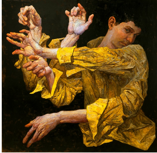
Şekil 17 (Sağdaki). Denis Sarazhin, "Pantomim 12" Tüyb, 2016 (URL-16, 2020).

"Pantomim 5" ve "Pantomim 12" adlı eserler (Şekil 16, 17) sanatçının "Pantomim" serisindeki en bilindik örneklerdendir. Resimlerde, vücudun çeşitli uzuvlarının (Şekil 16'da portre, kollar ve bacakların; 17'de ise yalnızca kolların) birden fazla görüntüsünü birbiri üzerine bindirilmiş çeşitli pozisyonlarda betimlendiği görülmektedir.