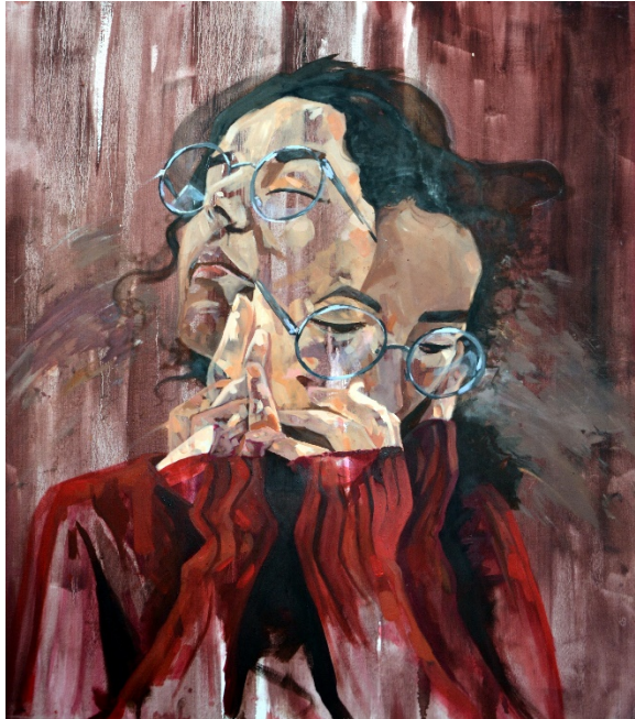
Şekil 18. Mehmet Erkan Turan, "Derin Düşünceler 1", Tüyb, 90x80 cm, 2019.

"Pantomim 5" ve "Pantomim 12" adlı eserler (Şekil 16, 17) sanatçının "Pantomim" serisindeki en bilindik örneklerdendir. Resimlerde, vücudun çeşitli uzuvlarının (Şekil 16'da portre, kollar ve bacakların; 17'de ise yalnızca kolların) birden fazla görüntüsünü birbiri üzerine bindirilmiş çeşitli pozisyonlarda betimlendiği görülmektedir.