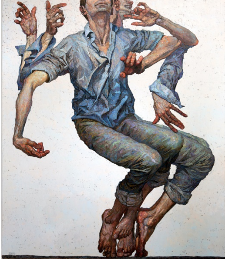
Şekil 16 (Soldaki). Denis Sarazhin, "Pantomim 5" Tüyb, 2015 (URL-15, 2020).

Denis Sarazhin, 1982 doğumlu Ukraynalı sanatçıdır. Sanatçı eşzamanlı betimleme yönteminden faydalanarak hareketi ifade eden yağlı boya tablolar üretmektedir. Özellikle "Pantomim" serisi, bacaklar ve ellerde hareketlere ve dramatik hareket hissine odaklanmaktadır. Çalışmaları Egon Schiele gibi ustalarla karşılaştırılsa da, çalışmalarındaki hareketli doğa ve rengi kullanımındaki karakteristik yönüyle Sarazhin, kendine özgü yaklaşımını ortaya koymaktadır (URL-14, 2020).