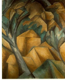
Şekil 1. Georges Braque, "Estaque'ta Evler", TüYB, 73x60 cm, 1908 (Yılmaz, 2013)

1907 yılında ortaya çıkan ve 20. yy.ın en önemli sanat akımlarından biri olan Kübizm, ismini birçok akımda olduğu gibi bir dalga geçme üzerine almıştır: 1908 yılında sergiye katılan Braque'ın "Estaque'ta Evler" adlı resmindeki (Şekil 1) evleri Matisse'in küçük küplere benzeterek dalga geçmesi üzerine Kübizm adını almıştır. Ancak; her ne kadar ismini küplere benzeyen biçimlerden almış olsa da, "Kübizm" denilince akla gelen tek şey küplere benzeyen biçimler olmamalıdır. Kübist eserlerde bundan çok daha fazlası görülmektedir. Bu anlamda verilebilecek en önemli örneklerden biri, "eşzamanlı betimleme" yöntemidir. Kübistler bu yöntemle, nesneyi birçok açıdan göstererek hareket hissi uyandıran resimler üretmişlerdir. Bu anlamda, resme "dördüncü boyut"un dâhil edildiği kabul edilir. Artık nesnelere betimlenirken; genişliği, yüksekliği ve derinliği olan üç boyutlu haliyle değil, bunlara bir de zaman ve hareket kavramları eklenerek dört boyutlu haliyle tasvir edilmiştir (Antmen, 2017: 45-48). Daha basit bir şekilde anlatmak gerekirse: