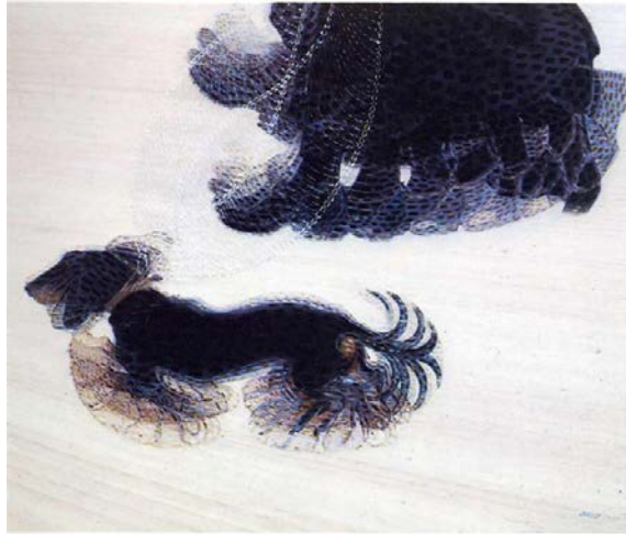
Şekil 9. Giacomo Balla, "Tasmalı Köpeğin Dinamizmi", TÜYB, 89x109 cm, 1912, Albright-Knox Sanat Galerisi, New York (Cumming, 2008).

Fütürizm'in en önemli savunucuların biri olan Giacomo Balla diğer Fütüristler gibi resimlerinde "hareketi" ve "hızı" betimlemeye çalışmıştır. "Uzun süre fotoğrafçılıkla uğraşan Balla, bir olayın art arda gelen evrelerini saptayan kronofotoğraf tekniğinin hareketi çözümleyişinden yararlanmayı amaçlamıştır" (Lynton, 2009: 92). Eserlerinde "hareketi" ifade etmek için, eşzamanlı betimleme yöntemini en başarılı şekilde kullanan Fütürist ressamlardandır.