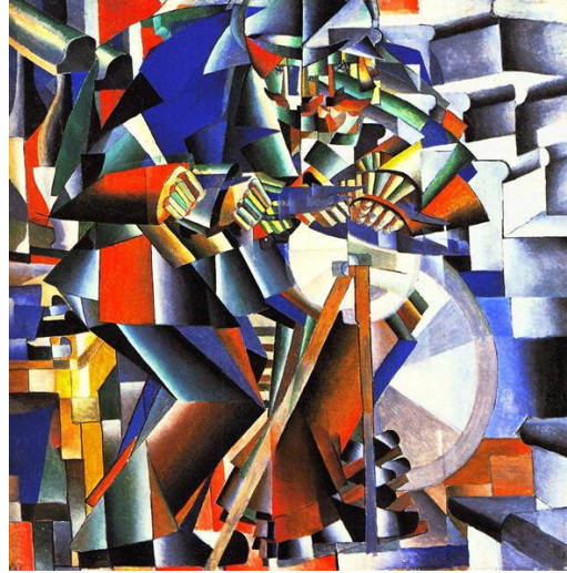
Şekil 12. Kazimir Malevich, "Bıçak Bileyicisi", TÜYB, 80x80 cm, 1912 (Yılmaz, 2013).

"Rus Fütürizmi" olarak da bilinen bu akım, Birinci Dünya Savaşı öncesi, Rusya'da gelişmiştir. Analitik Kübizm'in biçimleri parçalama anlayışı ile Fütürizm'in hareketi eşzamanlı olarak betimleme anlayışının bir sentezi olarak nitelendirilebilir. En önemli temsilcisi Kazimir Malevich'tir (Sözen ve Tanyeli, 2018: 186).