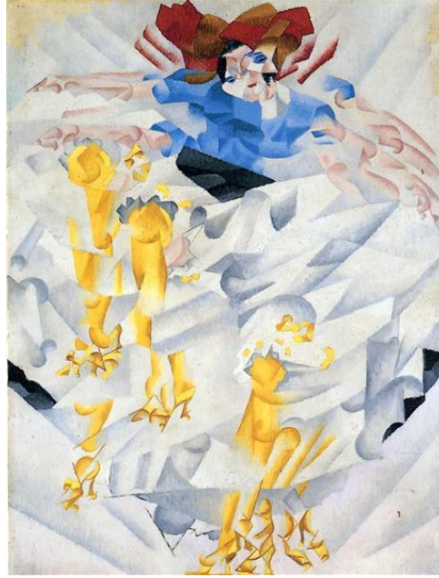
Şekil 10. Gino Severini, "Bir Dansçının Dinamizmi", TÜYB, 60x45 cm, 1912 (URL-5, 2019).

Severini, "hareketin" ve "devininim" resmini yapmayı amaçlamış ve eserlerinde eşzamanlı betimleme yönteminden faydalanmıştır.