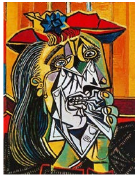
Şekil 2. Pablo Picasso, "Ağlayan Kadın", TüYB, 60x49 cm, 1937, Tate Britain, Londra (URL-1, 2020).

Burada, yeni bir kavramın bir kategori olarak dile getirildiğini görüyoruz. Bu kavram "aynı zamanda" (simultan) kavramıdır... Gördüğümüz natürlük artık yalnız tek bir perspektif içinde bize görünüş olarak verilmiyor, tersine "aynı zamanda" farklı perspektiflerden veriliyor (2003: 171).