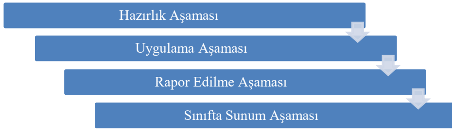
Şekil 2. Sözlü Tarih Araştırma Süreci (Kabapınar, 2019)

Şekil 2’de görüldüğü üzere sözlü tarih aşamalarından ilki olan hazırlık aşamasında konu belirlenir, gerekli kaynaklara ulaşılır ve soruları hazırlanır. Uygulama aşamasında, görüşme yapılır ve kayıt altına alınır. Rapor edilme aşamasında, veriler düzenlenir ve kaynaklar karşılaştırılır ve bir rapor yazılır. Sınıfta sunum aşamasında, çalışma sınıfta sunulur. Bu aşamalarda sözlü tarih öğretim metodu süreçte öğrenciyi aktif kılma özelliğine sahiptir. Öğrenciye tıpkı bir tarihçi gibi araştırma yapma, elde edilen görüşmeleri yorumlama ve sentezleme fırsatı sunar. Bu yönüyle yapılandırmacı yaklaşım temelinde bir tarih öğretme yöntemidir (Dere, 2018; Kabapınar, 2019). Öyle ki sözlü tarih uygulama aşamasında görüşme yaparken sosyal, araştırmacı ve soru sorma becerilerini kullanılır, görüşmeyi video veya ses kayıt cihazı ile kaydeder. Elde ettiği verileri çeşitli kaynaklarla mukayese eder ve sentezler.