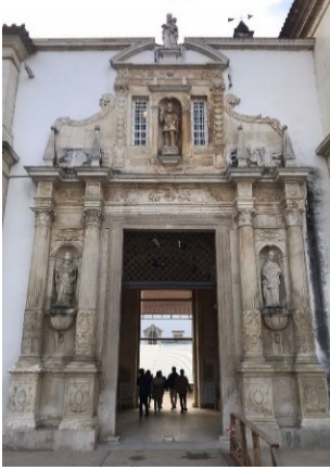
Resim 2. Coimbra Üniversitesi Demir Kapısı

Coimbra Üniversitesinin giriş kapısıdır. 17. yüzyılda inşa edilen bu yapı, adını içindeki Demir Kapı'dan alıyor. Üniversite ile bağlantılı resim ve sembollerle süslenmiş portalın her iki yanında kadın Hikmet figürü yer almaktadır. Üniversitenin tarihine damgasını vuran iki kral da burada tasvir edilmiştir: Her iki cephede de Kral Dinis ve Kral João II. bulunmaktadır. Yanlarda, kadın figürleri zamanın belli başlı bölümlerini temsil ediyor: bunlar hukuk, tıp ve ilahiyattır (UC Afiş, 2020).