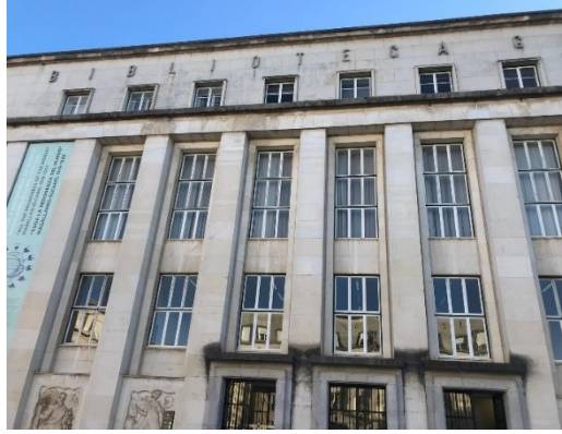
Resim 10. Genel Kütüphane Binası

Genel kütüphane Coimbra Üniversitesi yerleşkesi içinde yer almaktadır. Bu kütüphaneye sadece Coimbra Üniversitesi öğrencileri ve personelleri girebilmektedir. Kütüphane girişlerinde öğrenci veya personel kartı kullanımı zorunludur. Eğer Coimbra üniversitesi öğrencisi veya personeli değil iseniz bu kütüphaneye girmeniz mümkün değildir. Çünkü bu kütüphane temel olarak gezi amaçlı değil çalışma ve okuma için hizmet vermektedir. Girişten sonra kapıda danışma ve güvenlik sizi karşılar. Güvenlik personeli giriş amacınızı sormakta ve bunun neticesinde kütüphaneye yönlendirme yapmaktadır. Ayrıca güvenlik personeli giriş çıkışları kayıt altına almaktadır. Pandemi dönemi içerisinde olduğumuz için girişten itibaren maske kullanımı zorunludur. İçeriye girdikten sonra genel kurallarının uyulması istenmekte ve fotoğraf video çekiminin yasak olduğu bildirilmektedir. Çalışma kapsamında güvenlik görevlisinden sözel olarak izin alınmış ve fotoğraf çekimi yapılmıştır.