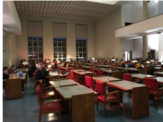
Resim 12. Genel Kütüphane Çalışma Alanı

Genel kütüphane bina dört kattan oluşmaktadır. Zemin katta sadece danışma birimi yer almaktadır. Asıl çalışma ve okuma alanı birinci katta yer almaktadır. Birinci kata çıkıldığında dış alanda yine bir danışma bölümü yer almaktadır. Dış alanda danışma bölümünün yanı sıra bilgisayarlar, çeşitli kitap sergileri, dolaplar ve fotokopi bölümü yer almaktadır. İç alan, okuma odası olarak isimlendirilmektedir. Oldukça geniş bir yapıya sahip ve üç