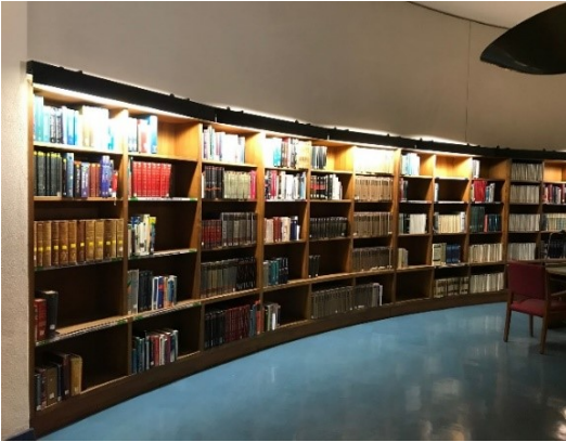
Resim 11. Genel Kütüphane Kitaplıkları

Genel kütüphane Coimbra Üniversitesi yerleşkesi içinde yer almaktadır. Bu kütüphaneye sadece Coimbra Üniversitesi öğrencileri ve personelleri girebilmektedir. Kütüphane girişlerinde öğrenci veya personel kartı kullanımı zorunludur. Eğer Coimbra üniversitesi öğrencisi veya personeli değil iseniz bu kütüphaneye girmeniz mümkün değildir. Çünkü bu kütüphane temel olarak gezi amaçlı değil çalışma ve okuma için hizmet vermektedir. Girişten sonra kapıda danışma ve güvenlik sizi karşılar. Güvenlik personeli giriş amacınızı sormakta ve bunun neticesinde kütüphaneye yönlendirme yapmaktadır. Ayrıca güvenlik personeli giriş çıkışları kayıt altına almaktadır. Pandemi dönemi içerisinde olduğumuz için girişten itibaren maske kullanımı zorunludur. İçeriye girdikten sonra genel kurallarının uyulması istenmekte ve fotoğraf video çekiminin yasak olduğu bildirilmektedir. Çalışma kapsamında güvenlik görevlisinden sözel olarak izin alınmış ve fotoğraf çekimi yapılmıştır.