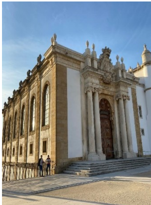
Resim 3. Joanina Kütüphanesi Binası

Barok Kütüphane'nin adıyla anılan kütüphanenin inşaatı, 1717'de Kral V. John'un saltanatı sırasında başlamıştır ve inşaatın 12 yıl sürdüğü söylenmektedir. Bu, toplam gelirin üç yıllık değerine eşdeğer bir meblağ olan 67 contos de reis (1910 öncesi Portekiz para birimi) harcanmış ve Üniversite tarafından ödenmiştir. Barok üslupta dekore edilmiş ve başında Latince yazılı pirinç bir pankart bulunan soylu girişinin dış cephesi, kitapların bilgelik elde etmek için silah olarak kullanılmasını tasvir ediyor. Binanın dışının göreceli sadeliği, içeride bulunabileceklerle güçlü bir tezat oluşturuyor (Coimbra Üniversitesi, 2021b). Şimdi bu muhteşem kütüphanenin içerisine girme vakti geldi.