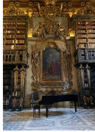
Resim 6. Kral João V'nin kraliyet portresinin olduğu son bölüm

İç alan tamamen Manuel da Silva tarafından 40 ay boyunca yapılmış yeşil, kırmızı ve siyah tonlarında değişen bir arka plan üzerinde, Çin motifleriyle titizlikle dekore edilmiş kitaplıklarla kaplıdır. Her bölümde yeşil veya kırmızı zemin üzerine yıldızlarla süslenmiş, iki katlı olarak inşa edilen 72 raf bulunmaktadır. Üst kattaki raflara gömme merdiven aracılığıyla dar bir balkondan erişilebilir. Rafların neredeyse tamamı Çin kültürüne ait küçük oryantal tablolar ve geleneksel kıyafetler giymiş figürlerle dekore edilmiştir. Ama bu güzellikleri uzaktan görmek zorundayız. Çünkü kitaplıkların yanına yaklaşmak ve onlara dokunmak burada da yasaktır. Hatta alt taraftaki kitaplıklarda önlem amaçlı ince tel örgüler bulunmaktadır. Kütüphanenin bölümlerinden bahsedecek olursak; ilk bölüm, görkemli kapının yer aldığı giriş bölümüdür (tur sırasında çıkış için kullanılmaktadır). Orta bölüme geçildiğinde değerli tropik ağaçlardan yapılan altı kabartmalı masa bulunmaktadır. Odanın sonunda yer alan bölümde ise Kral João V'nin kraliyet portresi bulunmaktadır ve portrenin önünde bir piyano yer almaktadır. 1725 yılından kalma olan bu tuval, hükümdarın gücünü ifade etmek için ressam Giorgi Domenico Duprà'nın yaptığına inanılmaktadır.