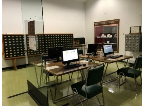
Resim 13. Genel Kütüphane Bilgisayar Alanı

bölümden oluşmaktadır. Toplamda 150 kişiliktir. İç alanının duvarlarına monteli raflarda eski ve yeni basım kitaplar yer almaktadır. Orta alanda masalar yer almakta iken diğer iki bölüm multimedya ve ek oda şeklinde ayrılmıştır. Okuma odası kitap okumak, araştırma yapmak veya ders çalışmak isteyenler için uygun biçimde tasarlanmıştır. Okuma odası içerisinde iki adet danışma bölümü yer almaktadır. Üst katlara giriş izni yoktur.