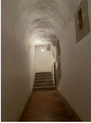
Resim 4. Akademik Hapishane

Joanina Kütüphanesini ziyaret edebilmek için öncelikle bilet alınması gerekmektedir. Bilet çevrim içi olarak veya üniversite yakınında bulunan bilet ofisinden alınabilmektedir. Eğer Coimbra Üniversitesi öğrencisi veya görevlisi olarak çalışıyorsanız, kütüphaneyi ücretsiz ziyaret edebilirsiniz. Bunun için üniversite öğrenci kartını veya personel kartınızı bilet gişesinde bulunan görevliye ibraz etmeniz zorunludur. Bu ibraz neticesinde biletinize ulaşım sağlayabilirsiniz. Eğer Coimbra Üniversitesi bünyesi dışındaysanız, 2021 fiyatlarına göre, 65 yaş ve üzeri 10,00 €, 19-64 yaş arası 12,50 €, 19- 25 yaş arası 10,00 €, 13 ila 18 yaş arası 6,25 € ve 3- 13 yaş arası çocuklar ücretsiz şekilde bilet alınmaktadır. Ama bu bilet sadece kütüphane girişinde kullanılmamaktadır. Aynı zamanda St. Michael Şapeli, Kraliyet Sarayı ve Kimya laboratuvarı da (Bilim Müzesi'ne ait) ziyaret edilebilmektedir. Bu ziyaretler belli saat aralıklarında gerçekleşmektedir. Bunlar 9:00- 13:00/14:00- 17:00 saatleri arasındadır. Kütüphane gezisi sadece 20 dakika süre ve 60 kişi ile sınırlandırılmaktadır. Tüm gezi boyunca Covid-19'dan dolayı maske kullanımı zorunlu tutulmuştur.