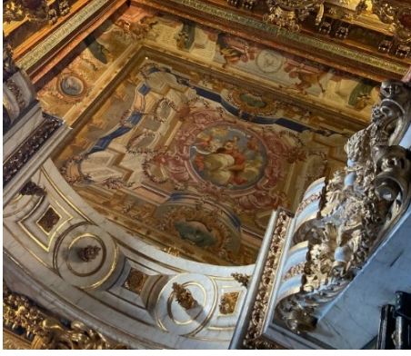
Resim 8. Orta Bölüm Tavanı