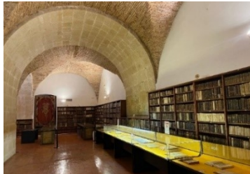
Resim 5. Kütüphane Birinci Kat Bölümü

birinci kata geçiş yapılmaktadır. Birinci katta el yazması nadide eserler sergilenmektedir. Bölümlere ayrılan raflarda eski zamanlara ait birçok cilt kitap bulunmaktadır. Ancak kitaplara dokunmak kesinlikle yasaktır. Bu katta fotoğraf ve video çekimine izin verilmektedir. Bu katta da ziyaret beş dakika ile sınırlı tutulmuştur. Daha sonra asıl kat olan üçüncü kata geçiş yapılmaktadır.