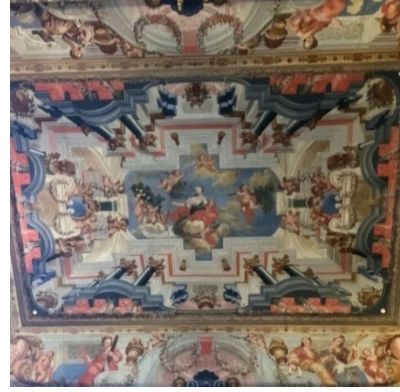
Resim 9. Son Bölüm Tavanı

Son olarak Kral João V'nin kraliyet portresinin bulunduğu bölümün tavanı ise, evrensel bilginin sentezi "Ansiklopedi" olarak tasvir edilmiştir. Taç kalıplamada gören figürler, İlahiyat ve Kanonlar için "Sacra Pagina"; Hukuk için "Astraea"; Doğa Bilimleri, özellikle Tıp için "Natura"; ve Sanat için "Ars" efsaneleri olarak tasvir edilmiştir.