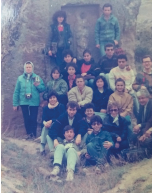
Ege Üniversitesi arkeoloji öğrencileri ile Küçük Kapıkaya'da, 20 Mart 1986.