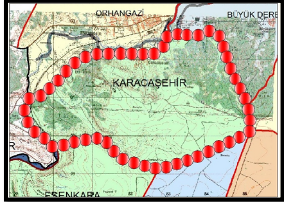
Şekil 3. Eskişehir Karacaşehir köyü sınırları