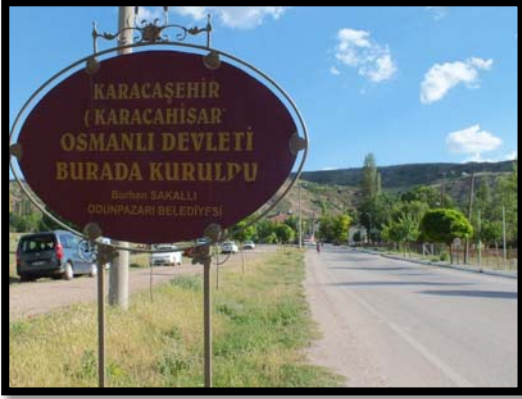
Şekil 5. Karacaşehir köyü

Yüzde olarak ise: %49,89 erkek, %50,11 kadındır. Yüzölçümü 13.925 km 2 olan Eskişehir ilinde kilometrekareye 58 insan düşmektedir. Eskişehir iline bağlı 14 ilçe bulunmaktadır. Odunpazarı ilçesine bağlı 42 adet köy bulunmaktadır.