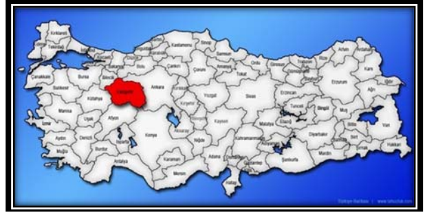
Şekil 2. Eskişehir ili coğrafi konumu

Karacaşehir, Eskişehir ilinin Odunpazarı ilçesine bağlı bir köydür (Şekil 2.). Karacaşehir köyü 39.7377778 enlemi ve 30.4566667 boylamı koordinatlarında yer alır. Eskişehir merkezine 6 km uzaklıktadır. Porsuk Çayının güneyinde yer alır (Şekil 4.).