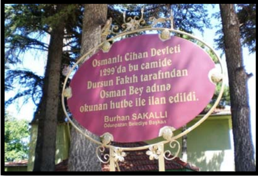
Şekil 6. Karacaşehir köyünde Osmanlı Devleti'nin ilk hutbe okutulularak ilan edildiği cami

Karacaşehir köyünün nüfusu, 1997'de 356 iken 2000 yılında göçler nedeniyle 125'e düşmüştür. Üretim araçlarının sınırlılığı ve iş olanaklarının kıtlığının yanısıra yeni evlenen çiftlerin de köyün dışında bir yaşam kurma istekleri Karacaşehir köyünden büyük şehirlere göçü hızlandırmıştır. Karacaşehir'de okul olmadığından ilköğretim çağına gelen çocuklar eğitimlerine Eskişehir ilinde devam etmektedirler. Karacaşehir köyünden göç edenler çoğunlukla eğitim, meslek edinme, iş bulabilme veya evlenme gibi nedenlerle yapmaktadırlar. Köyden kente göç etmiş olan ailelerin büyük çoğunluğu, köy ile olan sosyal ve ekonomik bağlarını halen sürdürmektedirler. Bu durum, köye doğru geçici nüfus hareketlerinin artmasına da yol açmıştır. Eskişehir'in 8 km güneybatısında bulunan Karacaşehir köyü, Eskişehir merkezine 6 km uzaklıktadır. Köye ulaşımı sağlayan yol asfalt olup köyde elektrik ve sabit telefon vardır. Köyde içme suyu şebekesi bulunmamaktadır. Köyde kanalizasyon bulunmamaktadır. Köyde, ilköğretim okulu vardır ancak kullanılamamaktadır. PTT şubesi yoktur ancak PTT acentesi vardır. Sağlık ocağı ve sağlık evi yoktur. Köye ulaşımı sağlayan yol asfalt olup köyde elektrik ve sabit telefon bulunmaktadır.