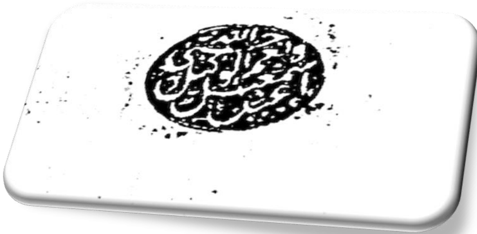
Görsel 2: Kalınbacakoğlu’nun Vazifede Kullandığı Mühür

“Hasbüne’llâhü ve ni’me’l-vekîl İsmail Abduhu (BOA, HAT., 1246-48333).”