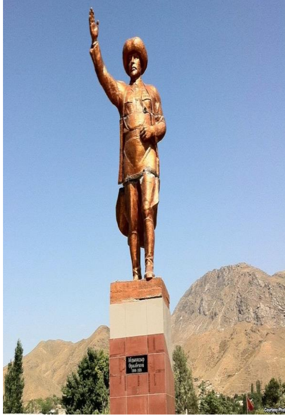
Resim 4. Abdikadir Orozbekov'un memleketindeki heykeli

Orozbekov'un aklanması ile ilgili dilekçe ile Kırgızistan Devlet Güvenlik Komitesi 'ne başvurmuştur. O dönemdeki Kırgız Sovyet Sosyalist Cumhuriyeti Komünist Partisi Merkez Komitesi'nin birinci sekreteri İshak Razzakov'un bizzat inisiyatifi ile Orozbekov ile ilgili materyalleri gözden geçirmek için Mayıs 1956'da hükümet komisyonu kurulmuştur. Bu hükümet komisyonunun çalışmaları sayesinde A. Orozbekov'un siyasi rehabilitasyon ile ilgili karar çıkartılmıştır. 21 Mayıs 1956'da Kırgızistan Komünist Partisi Merkez Komitesi Bürosu kararıyla 1937'de iptal edilen Komünist Parti'ye üyeliği tekrar düzenlenmiştir. 1994 senesinde ise Kırgızistan kendi egemenliğini kazandıktan sonra A.Orozbekov tamamen aklanmıştır.