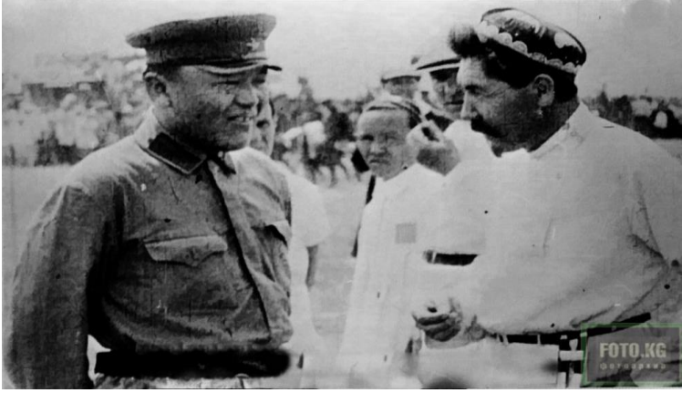
Resim 2. A.Orozbekov ve 1927-1933'te Kırgız Muhtar SSC Halk Komiserler Kurulu başkanı C. Abdrahmanov

A. Orozbekov'un Kırgız halkının millî devletçiliğinin oluşumu ve gelişimine de katkı sağlamıştır. 1924'te Kara Kırgız Muhtar Vilayeti 3 kurulduktan sonra sınırları belirleme işlerinde aktif faaliyetler yürütmüştür. 1926 yılında Moskova'da Tüm Rusya Merkezi İcra Komitesi'nin III. Kongresinde yaptığı konuşma sırasında Kırgızistan'ın gelişmesi için Kırgız Muhtar Vilayeti'nin cumhuriyet olarak tekrar kurulmasını hararetle şekilde savunmuştur. Kırgızistan'ın önce 1926'da Kırgız Muhtar Sovyet Sosyalist Cumhuriyeti daha sonra 1936'da Kırgız Sovyet Sosyalist Cumhuriyeti statüsünü almasında A.Orozbekov'un büyük emeği geçmiştir. 1929'da kabul edilen Kırgız Muhtar Sovyet Sosyalist Cumhuriyetinin ilk anayasası A.Orozbekov'un başkanlığında hazırlanmıştır. 1937'de yürürlüğe giren Kırgız Sovyet Sosyalist Cumhuriyeti'nin ilk anayasasının tasarı komisyonu çalışanları arasında yer almıştır.