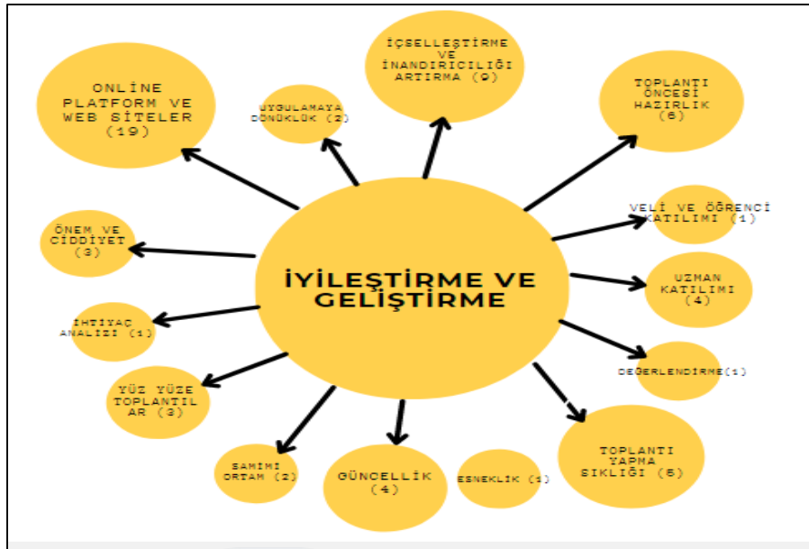
Şekil 4. Zümre Toplantılarının İyileştirilme ve geliştirilmesine İlişkin Çıkarımlar

Zümre Toplantılarının İyileştirilmesi ve Geliştirilmesine İlişkin Bulgulara göre zümre toplantıları mevcut haliyle oldukça işlevsiz ve verimsizdir ve bu durumu düzeltmek için bazı alternatif karar ve uygulamalar mevcuttur. Katılımcı görüşlerine ilişkin kodlardan oluşan bu alternatifler şekil 4'te ki gibidir.