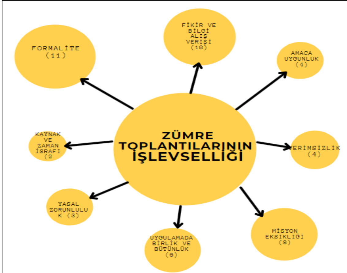
Şekil 1. Zümre Toplantılarının İşlevselliğine İlişkin Çıkarımlar

Araştırmaya katılan öğretmenlerin zümre toplantılarının misyonuna ilişkin çeşitli düşünceleri mevcuttur. Bu düşünce ve ifadeler zümre toplantılarının işlevselliği boyutunda incelenmiştir ve oluşturulan kodlar şekil 1'de gösterilmiştir.