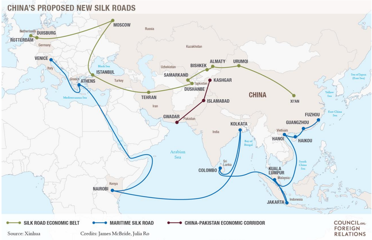
Harita 2: Çin'in Yeni İpek Yolu Güzergâhları (Kaynak: Council On Foreign Relations)

( https://www.cfr.org/backgrounder/building-new-silk-road )