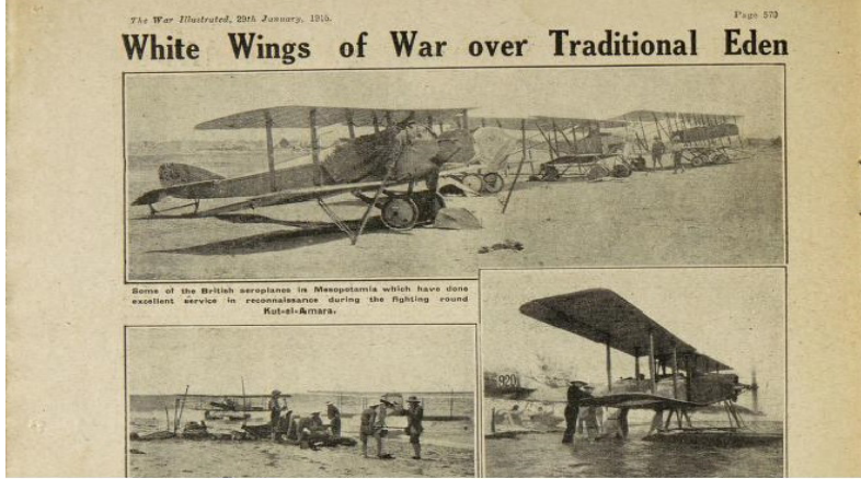
Resim 3: The War Illustrated, 22th January, 1916.

The War Illustrated, İngilizlerin merhametli bir ulus olduklarını savaş koşullarında da gösterdikleri yönünde türlü haberlere yer vermiştir. Örneğin, Türkler tarafından Kut'ül Amare'de esir alınanlar arasındaki hasta ve yaralıların İngiliz hatlarına doğru gönderilmelerine rağmen 46 İngilizlerin esir aldıkları Türk askerlerine yeni kıyafetler ve çizmeler verdikleri ve onlara temizliklerini yapacakları uygun koşulları sağladıkları ifade edilmiştir. 47