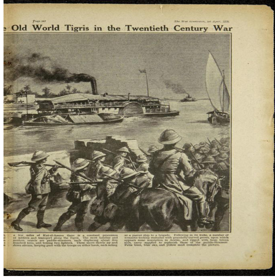
Resim 2: The War Illustrated, 1st April, 1916.

buharlı gemilerin bir tezat oluşturduğunun aktarıldığı bölümde Dicle Nehrinin Arap edebiyatındaki romantik yerine vurgu yapılmıştır. 41