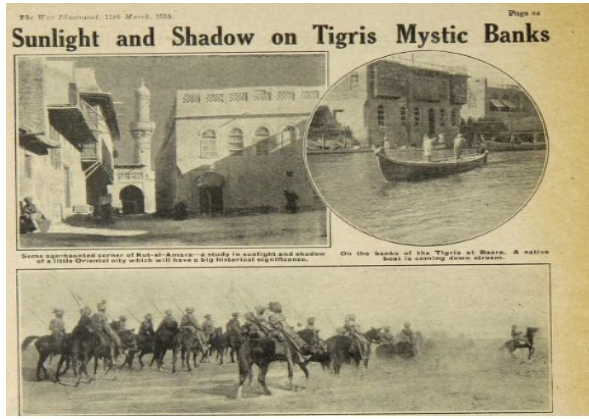
Resim 4: The War Illustrated, 12th March, 1916.

dönüştüreceği iddialarını doğrular niteliktedir. 49 24 Şubat 1917'de Kut'ül Amare'nin İngilizler tarafından geri alınması ve 11 Mart'ta da Bağdat'ın ele geçirilmesi, The War Illustrated'ta sıkça başvurulan bir anlatım tekniği olan romantizme vurgu yapılarak aktarılmıştır. Buna göre, üç yüz yıldan fazla bir süre boyunca Türklerin egemenliği altında kalan Bağdat artık kültür, eğitim ve ticaretin merkezi haline getirilecektir. Yapılan bir yorumu göre Arapların "aslanların babası" olarak tanımlanan General Maude, Bağdat'ı alarak Almanların heveslerini sonlandırmıştır. General Maude'nin koleradan ölmesi üzerine komutayı devralan astı General Marshall 18 Kasım'da Kerkük'ü alarak Mezopotamya Harekâtını ileri bir aşamaya taşımayı başarmıştır. 50 Beklenebileceği gibi bu gelişmeler The War Illustrated başta olmak üzere İngiliz yazılı medyasında yoğun bir şekilde işlenerek Kut Kuşatması sonucunda İngiliz ordusunun aldığı büyük darbenin izleri silinmeye çalışılmıştır.