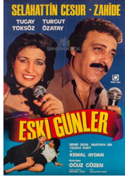
Afiş-3: Eski Günler Filmi

Eski Günler : 1984 yılında gösterime giren filmin yönetmeni Oğuz Gözen'dir. Film geçim sıkıntısı nedeniyle yanlış işe bulaşan ve ceza alan, hayatının büyük kısmını sıkıntı ve sefalet içinde sürdüren bir gencin hikâyesini anlatmaktadır.