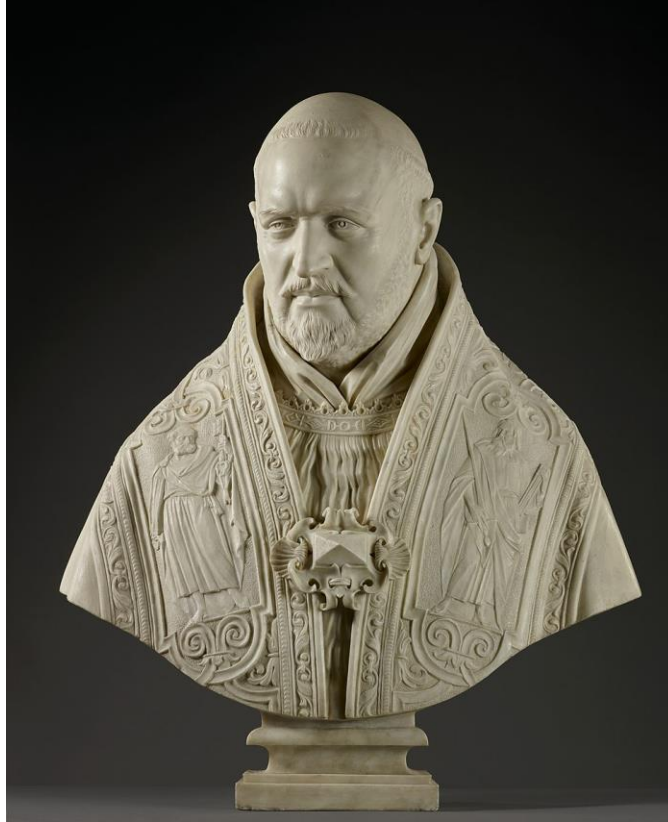
Görsel 2. Papa V. Paulus'un G. L. Bernini tarafından yapılan büstü (Bernini, 1621).

resmedilen portresi ve Bernini tarafından yapılan iki ayrı büstü kilisenin sanatsal reforma duyduğu ilgiyi göstermektedir.