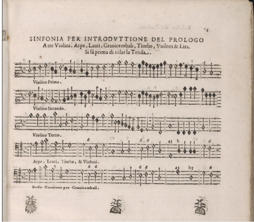
Görsel 3. Stefano Landi, Il Sant'Alessio Operası, Basso Continuo partisi (Landi, 1632, s.8)

Bukofzer'e göre müzik tarihinde ilk kez Barok çağda çok çeşitli formlar, teknikler ve terimler yaratılmış ve günümüze kadar çeşitli dönüşümlerle hayatta kalan bir müzik hazinesi oluşturulmuştur. Barok dönemde opera, oratoryo, kantat, solo sonat, üçlü sonat ve oda müziği düetleri gibi birçok yeni form ortaya çıkmıştır. Barok dönem Prelüd füg, koral prelüd ve koral fantezinin çağıdır. Konçerto grosso ve solo konçerto formları yine bu dönemde kullanılmaya başlanır. Barok dönemde, opera tarihinin zirvesine Scarlatti ve Handel'in eserleriyle, konçerto formunun zirvesine Vivaldi ve Bach eserleriyle, oratoryo formunun zirvesine ise Handel eserleriyle ulaşıldığı düşünülmektedir. Dönemde benzersiz dramatik konçertant stilini Gabrieli, Monteverdi ve Schutz gibi önde gelen ustalar yaratır. Org müziğinin ve Protestan kilise müziğinin en muhteşem dönemi ise Bach'ın eserleriyle yine Barok dönemde temsil edilmektedir (Bukofzer, 1947, s.34).