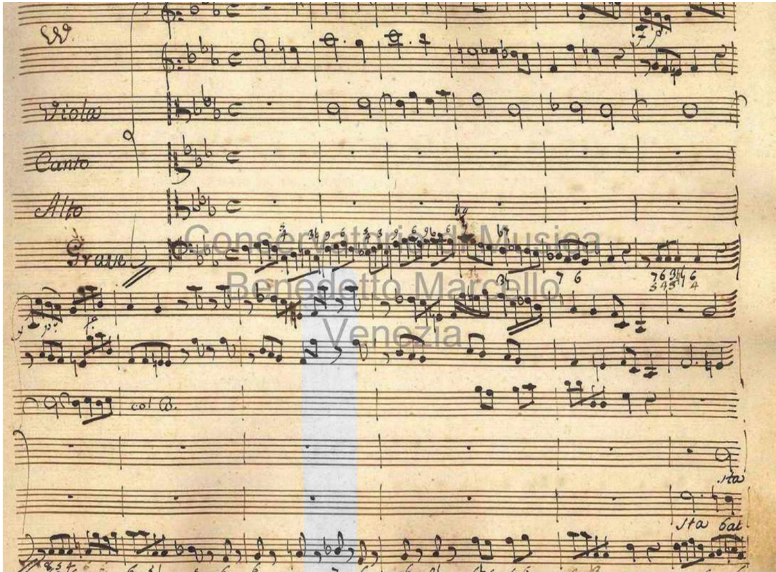
Görsel 6. G. B. Pergolesi, Stabat Mater, Napoliten altılı akor örneği (Pergolesi, 1736, s.5).

akorsal alterasyondan çok Phrygian modunun major ve minor mi dizisiyle birleşmesinden gelmektedir. Bu durum Barok dönemde armoni pratiğinin dizi esaslarını kavramasıyla gerçekleşmiştir. Bu armonik gelişimin tam olarak bu dönemde üç büyük C olarak adlandırılan Cavalli, Carissimi ve Cesti'nin eserlerinde ortaya çıktığı gözlemlenmektedir (Bukofzer, 1947, s.414).