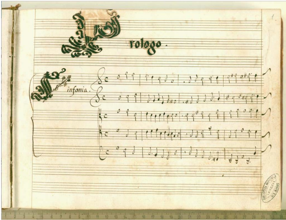
Görsel 6. Francesco Cavalli'nin La Didone Operası, Sinfonia girişi. Venetian Opera (Cavalli, 1640, s.7).

Katolik kilisesinin etkisi ile gelişen dini müzikler dışında, İtalyan barok müziğinin döneme kazandırdığı en büyük formun opera olduğu düşünülmektedir. Bukofzer'e göre, Kuzey İtalya'da (Floransa Operası) operanın ilk örneklerinin yeşermesinden sonra, önderlik 1620'de Roma'ya ve yaklaşık 20 yıl sonra Venedik'e geçer. Bu sebeple erken opera örneklerini üç gruba ayırmak mümkün olur; Florentin resitatif operası, Roma Koral Operası ve Venetian Solo Opera (Bukofzer, 1947, s.77).