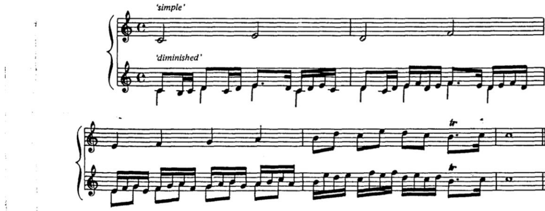
Görsel 5. Diminution örneği (Veilhan, 1979, s.49).

Neumann'a göre, 16. yüzyılda ortaya çıkan süsleme tekniklerinden diminution geç dönem Rönesans motet ve madrigal temalarının ve enstrümantal karşılıklarının nasıl süsleneceğini gösterir. Erken Barok dönemi başlatan stildeki kırılma sonrasında ve monodik müzikte, vokal partide yapılan diminution büyük ölçüde gölgede kalır. Buna karşın passaggi süslemeleri hece ve sözcükleri desteklemek için kadanslarda yerini korumayı sürdürür. Rubato kullanımı ve nüans bu dönemde öne çıkar (Neumann, 1978, s.47).