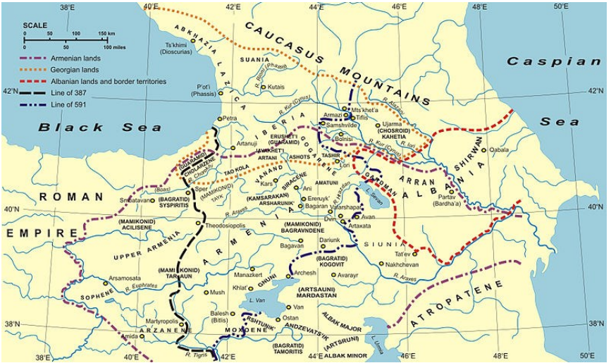
Harita 2: Kafkasya

http://en.wikipedia.org/wiki/File:Ancient_countries_of_Transcaucasia.jpg 30 Eylöl 2011