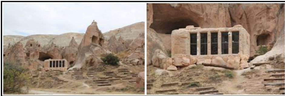
Foto 5: Zelve Açık Hava Müzesi'nde gerçekleştirilen mapping uygulama projesinin görüntü sistem merkezi.

Açık hava müzesinde mapping uygulama projesi ile saha oluşumu ve özelliklerinin anlatılacağı bir etkinlik düzenlenmektedir. Mapping uygulama projesi doğal dokuya uygun hazırlanan içerik, film ve animasyonların dokuya tam olarak uygulanması işlemidir. Bu uygulamada daha önceden belirlenmiş bir yüzeyin yapısına uygun bir şekilde görsel ve işitsel projeler hazırlanmakta ve hazırlanan yüksek kalitedeki sunumlar projeksiyon mapping olarak gösterime sunulmaktadır. Bunun için görüntü verilecek alandan 110-150 m ileride bir sistem merkezi oluşturulmuştur (Bknz: Foto 5). Bir konteynırın içerisinde düzenlenmiş olan sistem merkezi içinde bir (1) sistem bilgisayar ve 14 projeksiyon cihazı bulunmaktadır. Konteynırın etrafı bölgenin doğal dokusuna uyum sağlayacak şekilde imitasyon kaya ile kaplanmıştır. Sit alanı içerisindeki doğal dokuya zarar vermemek için konteynır, ahşap traversler üzerine yerleştirilmiştir (Nevşehir Kültür Varlıklarını Koruma Bölge Kurulu Müdürlüğü, 2015). Katılımcıların bir kısmı bu ışık gösterisinin doğal yapıya zarar vereceğini düşünürken, projeyi ekonomik açıdan değerlendirenler ise bu etkinliğin olumlu olacağını ifade etmiştir.