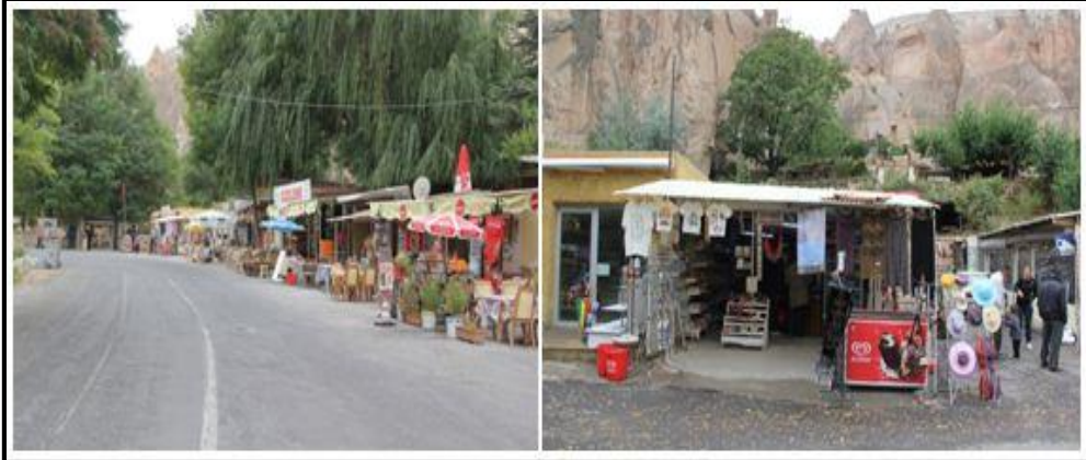
Foto 2: Zelve Açık Hava Müzesi girişinde bulunan hediyelik eşya dükkânı, kafeterya ve gözlemeciler.