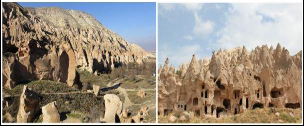
Foto 3: Zelve Açık Hava Müzesi ve dik kayalara oyulmuş meskenler.