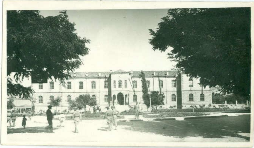
Ek 1: Niğde Hükümet Konağı'ndan bir görünüş