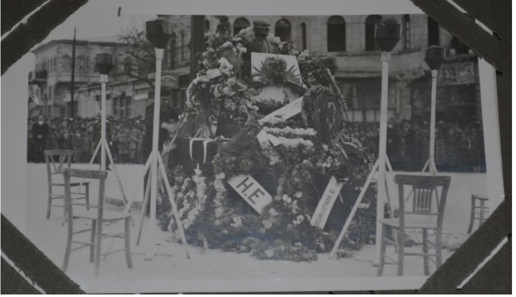
Ek 3: Niğde Hükümet Meydanında Yapılan Cumhuriyet Bayramı Kutlaması (1933)