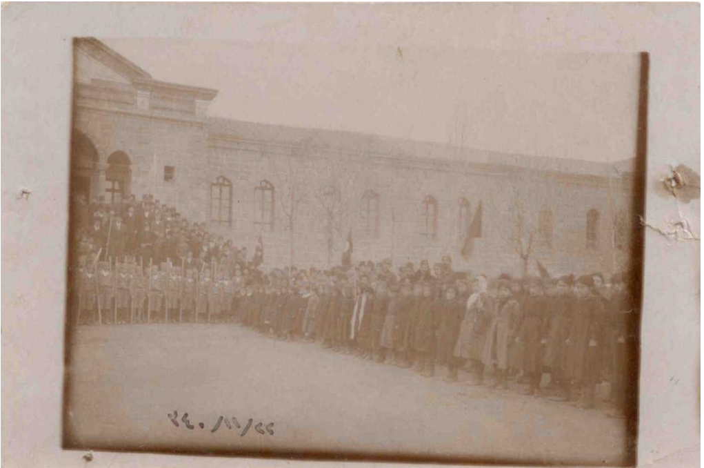
Ek 2: Niğde Orta Mektep Önünde yapılan Cumhuriyet Bayramı Kutlaması