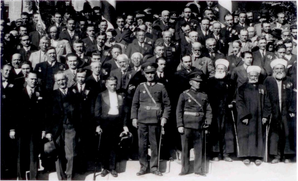
Ek 4: 29 Ekim 1933 Cumhuriyet Bayramı Kutlamasına Katılan Heyet (1933)