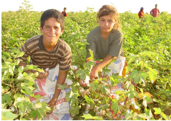
Foto 2. Pamuk toplayan çocuklardan bir görünüş