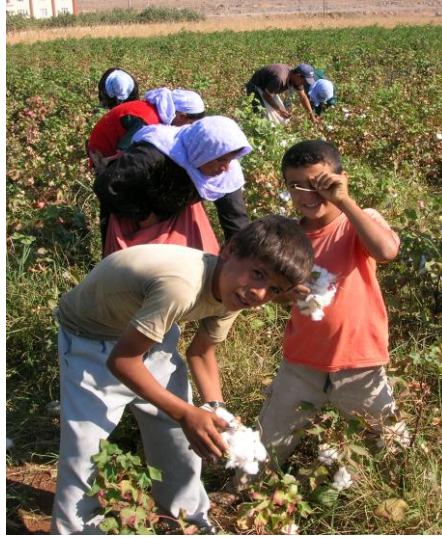
Foto 1. Ailenin tüm fertlerinin katılımıyla pamuk toplanması sırasından bir görünüş

Dolayısıyla mevsimlik tarım işçilerinin yaşam koşulları kapsamında; katılımcıların profili, araçlar ve taşınma, barınma, ücret ve ücretin belirlenme şekli, çalışma süresi, çocukların eğitimi, sağlık ve öncelikli sorunları irdelenmiştir.