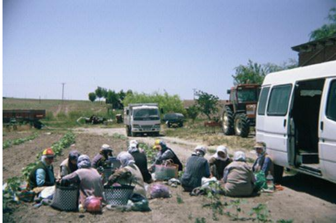
Foto 3. Mevsimlik tarım işçilerinin öğle yemeği sırasındaki görüntüleri

Tarım işçilerinin gittikleri yerlerde çalışma ortamlarına ilişkin yaşadıkları sorunlara bakıldığında; bunların başında beslenme ve ortamın sağlıksız koşulları geldiği açıkça görülmektedir (Foto 3). Bunları düşük ücret takip etmektedir (Tablo 21).