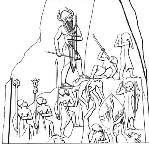
Figür 1: Naram-Sin Steli Çizimi (William J. Hamblin, Warfare in the Ancient Near East to 1600 BC , Fig. 3)