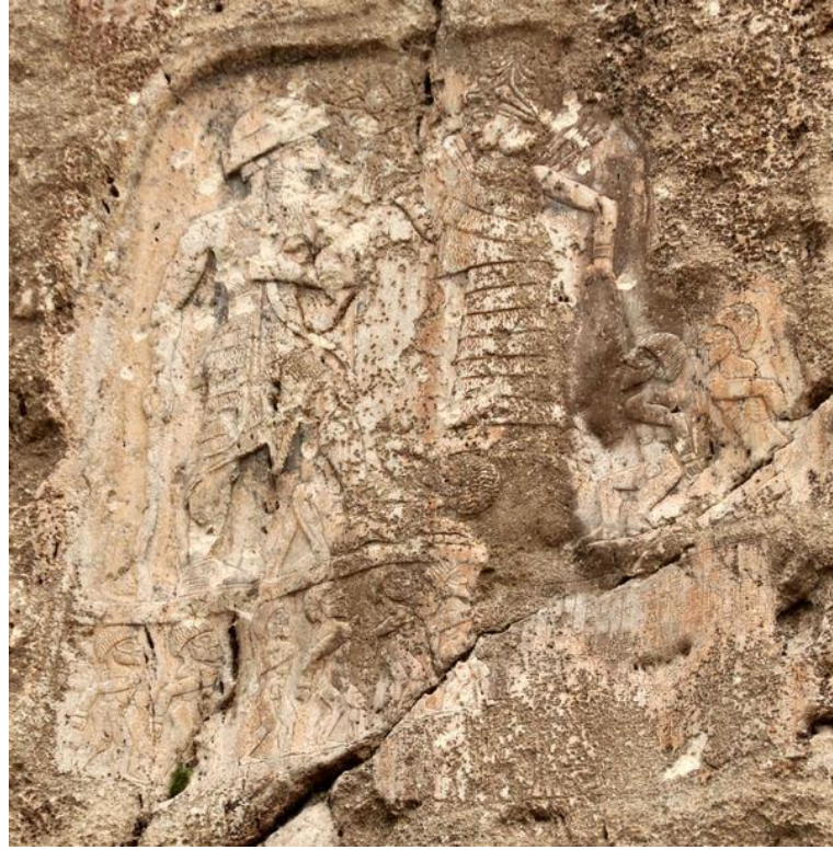
Figür 2: Anubanini Kabartması İran/Kirmanşah ( https://www.livius.org/pictures/iran/sar-e-pol-e-zahab/sar-pol-e-zahab-anubanini-relief )