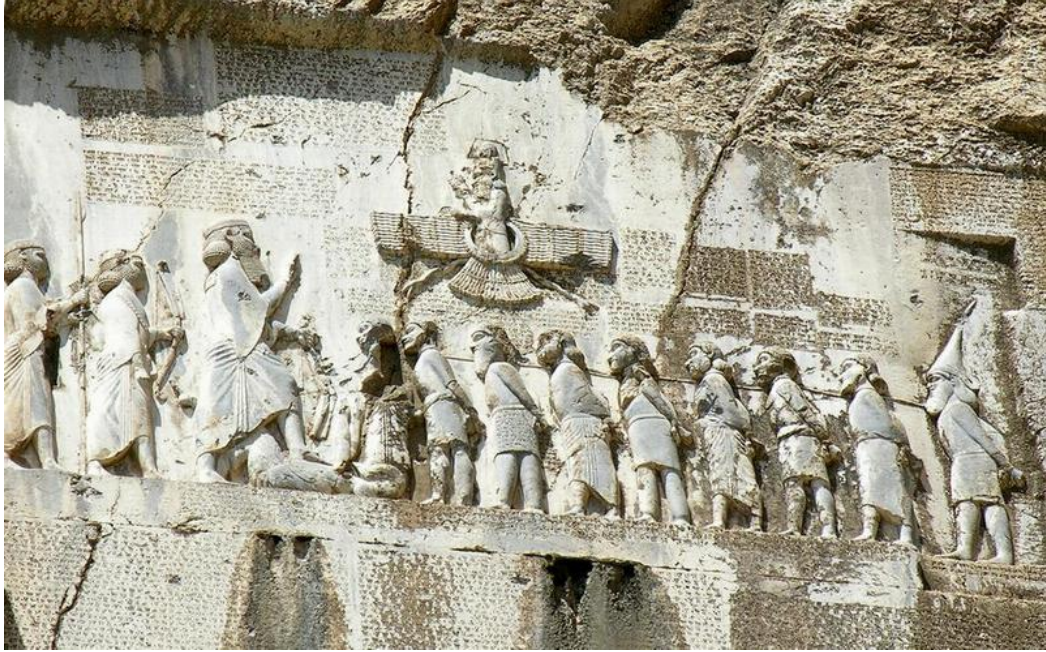
Figür 4: I. Dareios'un Kirmanşah Yakınlarındaki Bisutun (Behistun) Kabartması