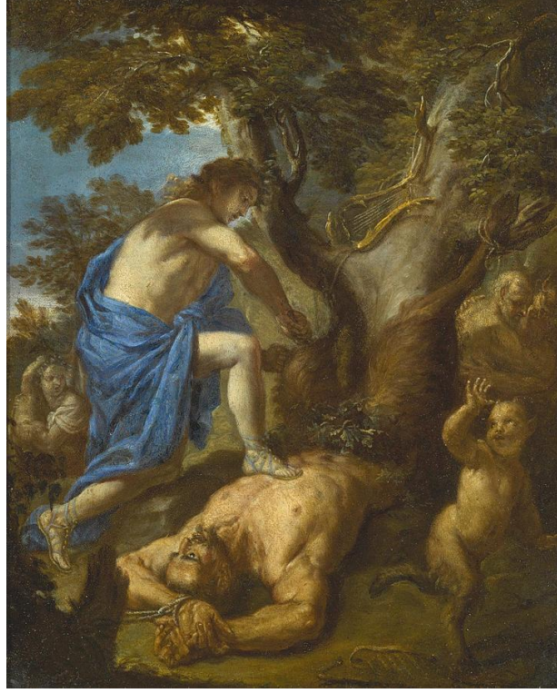
Şekil 25. Francesco Trevisani (1656- 1746) - Apollon ve Marsyas