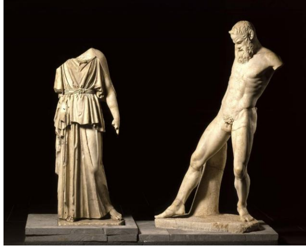
Şekil 1. Myron (M.Ö. 450)- Athena ve Marsyas.