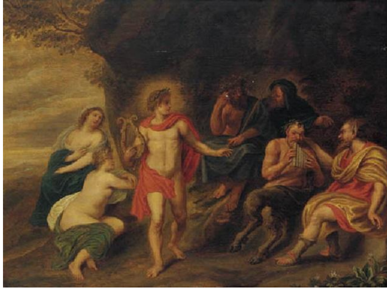
Şekil 29. Peter Paul Rubens (1577-1640) – Apollon ve Marsyas.