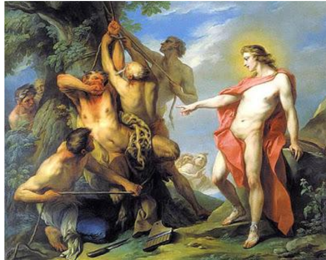
Şekil 20. Charles Andre Van Loo (1735) – Apollon'un emriyle Marsyas'ın derisinin yüzülmesi.

Marsyas'ın derisi yüzülürken baş aşağı asıldığı örnekler daha sınırlıdır. Rönesans resminin Venedik'teki en büyük ustası Titian bu mitolojik temanın en seçkin örneklerinden birini yapmıştır.