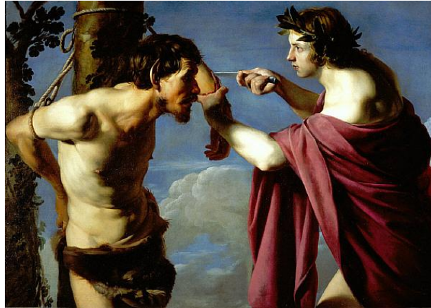
Şekil 10. Bartolomeo Manfredi (1615-1620)- Apollo ve Marsyas