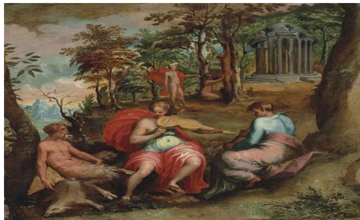
Şekil 8. Jacopo Bertoia (16. yy) – Apollon ve Marsyas'ın Yarışması