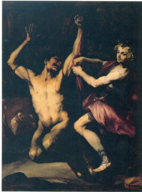
Şekil 12. Luca Giordano (1678) – Apollon Marsyas'ın derisini yüzüyor

Marsyas'ın ağaca dikey bağlandığı örnekler oldukça fazladır. Bunların dışında Luca Giordano (1678) (Şekil 12) efsanenin en can alıcı noktası olan kollarından düz bir şekilde ağaca asılan Marsyas'ın Apollon'un sol kolundan itibaren derisini yüzmeye başladığı ve Marsyas'ın acılar içinde kıvrandığı anı resmetmiştir. Kompozisyon dikey iki unsur tarafından neredeyse iki alana ayrılmıştır: acıyı çeken ve acıya sebep olan. Marsyas her ne kadar gölgede kalıyor olsa da ayak detaylarından tam bir satır olarak yansıtıldığı görülmektedir. Peter Paul Rubens (Şekil 13) Marsyas'ın çektiği acıyı ikinci plana bırakırken birazdan yaşayacağı acıyı da hissettiğini yüz ifadesine eklemekten de kaçınmamıştır. David Teniers (1655-56) (Şekil 14) kompozisyonu geniş bir perspektiften aynı yaklaşımda anlatmayı tercih etmiştir.