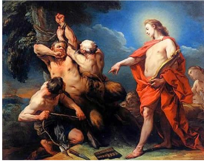
Şekil 19. Charles Andre Van Loo (1734-1735) – Apollon'un emriyle Marsyas'ın derisinin yüzülmesi.