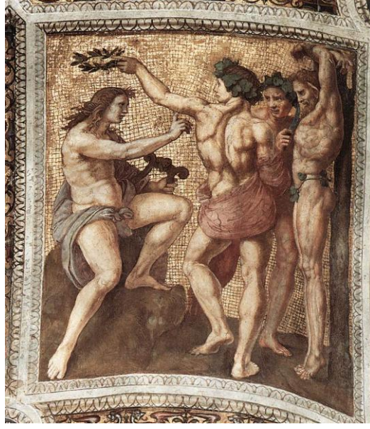
Şekil 9. Sanzio Raffaello (1509-1511) – Apollon ve Marsyas (Tavan Paneli)

Sahnelerin büyük çoğunluğunda Marsyas ağaca yaslanarak bağlanmış bir şekilde derisi yüzülürken resmedilmişken az sayıdaki örnekte ise ayaklarından baş aşağı biçimde bir ağaca asılmış, derisi yüzülürken resmedildiği görülmektedir. Sanzio Raffaello (1509-1511) (Şekil 9) tarihli fresk tavan paneli çalışmasında (bazı tarihçilere göre eser Raffaelloya ait değildir) uzatılmış figürlerin ilahi uyumun dünyevi tutkulara galip gelişini göstermektedir. Bartolomeo Manfredi'nin (1615-1620) (Şekil 10) eserinde daha dar bir kareyi tercih ederken, Giovanni Francesco Romanelli (Şekil 11) ise satir özellikleriyle yansıttığı Marsyas'ı ağaca bağlanmaya karşı koyar resimlerken, Apollon cezalandırıcı pozisyonda işaret ederek hükmün uygulanmasını emreder görünmektedir. Apollon müzik aleti olarak lyra, Marsyas ise pan flüt ile betimlenmiştir.