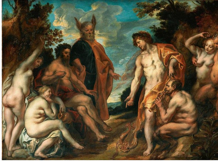
Şekil 27. Jacob Jardeans (1637) – Apollon ve Marsyas'ın müzik yarışması.