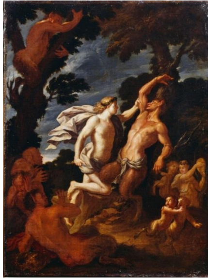
Şekil 17. Filippo Lauri (17. yy) – Apollon ve Marsyas.