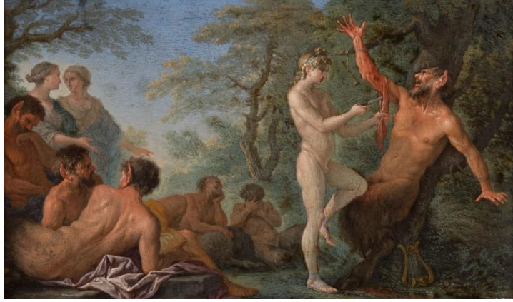
Şekil 16. Filippo Lauri (1681) – Apollon Marsyas'ın derisini yüzüyor (Bakır Levha).