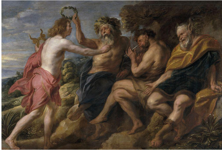
Şekil 28. Jacob Jordaens (1637) Apollon'un Marsyas'a karşı zaferi.