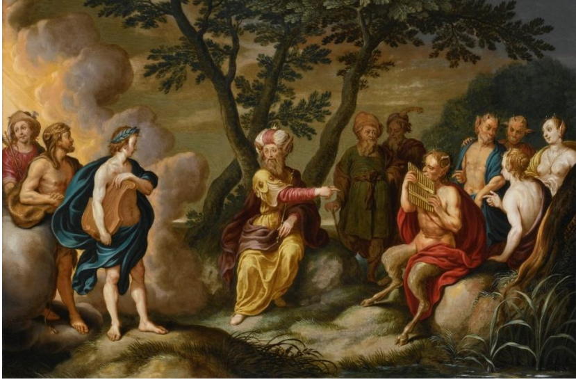
Şekil 26. Simon Floquet (1634) – Apollon ve Kral Midas.