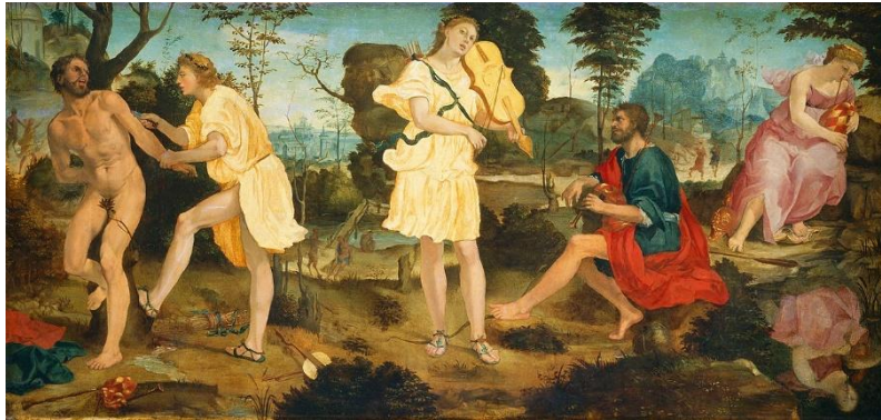
Şekil 7. Michelangelo Anselmi (1540) – Apollo and Marsyas.

Kimi sahnelerde de kompozisyonda oldukça kalabalık bir anlatım yolunun tercih edildiği görülür. Çoğunlukla daha erken anlatımlarda efsane baştan sona tek bir karede işlenmiştir. Michelangelo Anselmi (1540) (Şekil 7) ve Jacopo Bertoia'nın eserlerinde (16. yy.) (Şekil 8) görüldüğü üzere efsane tek bir anlatımda tümüyle verilmeye çalışılmıştır. Her iki eser anlatımını Ovidius'un "Dönüşümler"ine dayandırmaktadırlar. 16. yy. İtalyan sanatçıların gravür eserlerinde de görüldüğü üzere aynı anlatımı tercih etmişlerdir (Chiquet, 2016, s.7-11). Anselmi soldan daha çok sağ kenardan efsaneyi başlatmış ve Marsyas'ın cezalandırılmasını sol kenara planlamıştır. Bertoia ise müzik yarışmasını sahnenin önüne alırken cezalandırıldığı sahneyi arka plana yerleştirmiştir. Her iki eserde de Marsyas ağaca dikey bağlanarak cezalandırılmıştır. Bertoia ayrıca Marsyas'ı insani vasıflarından çok satir (Antik Yunan Mitolojisinde yer alan yarı keçi yarı insan formundaki canlı) özellikleriyle resimlemiştir.