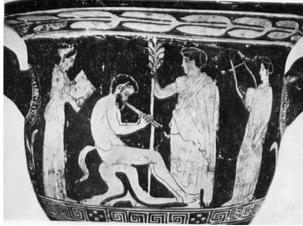
Şekil 2. Pothos ressamı (M.Ö. 410)- Marsyas, Apollo ve Museler. (Van Keer, 2004, s. 30. Fig. 6)