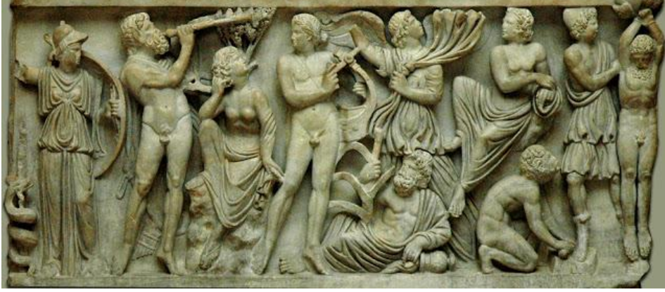
Şekil 4. (MS 290-300) Apollon ve Marsyas lahiti. (Demiralp, 2014, s. 95. Fig. 3)

ilham perisi) ve onun da sağında Apollon sanki kıskançlık ve kızgınlıkla Marsyas'ı hem dinliyor hem de sıranın kendisine gelmesini beklemektedir. Apollon'un sağında bir mousa ve yerde uzanan büyük olasılıkla Nehir Tanrısı yer almaktadır. Üstte görülen figürün Midas olma olasılığı yüksek olmakla birlikte yine de kıyafet ve efsanede geçen özellikleri olan büyük kulaklı ya da Phrygia giysileri ile betimlenmemesi nedeniyle şüphe uyandırmaktadır. Sahnenin sonunda sağda ise yarışmayı kaybeden Marsyas'ın derisi yüzülmektedir.