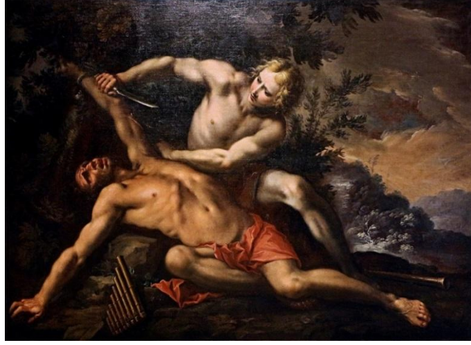
Şekil 15. Giovanni Stefano Danedi (1665) – Apollon ve Marsyas