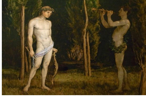
Şekil 6. Hans Thoma (1888)- Apollo ve Marsyas.

Kimi sahnelerde de kompozisyonda oldukça kalabalık bir anlatım yolunun tercih edildiği görülür. Çoğunlukla daha erken anlatımlarda efsane baştan sona tek bir karede işlenmiştir. Michelangelo Anselmi (1540) (Şekil 7) ve Jacopo Bertoia'nın eserlerinde (16. yy.) (Şekil 8) görüldüğü üzere efsane tek bir anlatımda tümüyle verilmeye çalışılmıştır. Her iki eser anlatımını Ovidius'un "Dönüşümler"ine dayandırmaktadırlar. 16. yy. İtalyan sanatçıların gravür eserlerinde de görüldüğü üzere aynı anlatımı tercih etmişlerdir (Chiquet, 2016, s.7-11). Anselmi soldan daha çok sağ kenardan efsaneyi başlatmış ve Marsyas'ın cezalandırılmasını sol kenara planlamıştır. Bertoia ise müzik yarışmasını sahnenin önüne alırken cezalandırıldığı sahneyi arka plana yerleştirmiştir. Her iki eserde de Marsyas ağaca dikey bağlanarak cezalandırılmıştır. Bertoia ayrıca Marsyas'ı insani vasıflarından çok satir (Antik Yunan Mitolojisinde yer alan yarı keçi yarı insan formundaki canlı) özellikleriyle resimlemiştir.