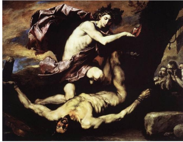
Şekil 23. Jusepe De Ribera (1637) – Apollon ve Marsyas.