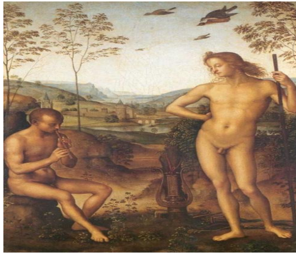
Şekil 5. Pietro Perugino (15. yy. sonları) – Apollo ve Marsyas.

Sanat tarihinde örneklerine en sık rastlanan mitolojik sahnelerden biri olan Apollon ve Marsyas arasındaki müzik yarışması 15. ve 19. yy.lar arasında sıklıkla konu edilmiştir. Bu uzun dönem boyunca konu çok farklı anlatımlara sahne olmuştur. Eserler farklı dönemlerde bile yapılmış olsa bile Pietro Perugino (15.yy. sonları) (Şekil 5) ve Hans Thoma'ya ait resimlerde (1888) (Şekil 6) sadece Marsyas ve Apollon'un yeteneklerini gösterir şekilde yer aldıkları görülür. Sahneler kompozisyon kurgusu olarak birbirine çok benzemektedir. Figürlerin yerleşimleri farklı olmakla birlikte her iki resimde de Marsyas elindeki kavalı ile yeteneğini gösterirken, Apollon Marsyas'ı tüm dikkati ile dinlemektedir.