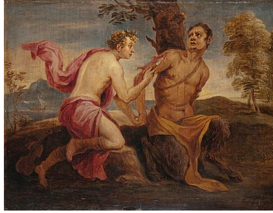
Şekil 14. David Teniers (1655-56) – Apollo ve Marsyas.

Marsyas'ı bir satir olarak gösteren Teniers Giovanni Stefano Danedi'nin (1665) eserinde de görüldüğü gibi (Şekil 15) Apollon için müzik aleti olarak kenara bırakılmış keman yerleştirilmiştir. Danedi eserinde Marsyas'ı ne ağaca tam bağlamış ne de gövdesine yaslamıştır. Bir kolundan bağladığı Marsyas'ı boylu boyunca yere uzatmış Apollon'a karşı koyamaz çaresizliği içinde teslim olmuş göstermiştir. Filippo Lauri (1681) (Şekil 16) aynı yüzyıl içinde yaptığı aynı temalı eserinde (Şekil 17) Marsyas'ı ağaca dikey olarak bağlamıştır. Jan van Orley (1685-1735) sahneye sadece Apollon ve Marsyas'ı eklediği gravür eserinde (Şekil 18) Marsyas'ı bağladığı ağaçta acı çekerken Apollon'un derisini yüzerken göstermiştir. Charles Andre Van Loo (1734-1735) (Şekil 19-20) iki farklı çalışmasında detayları farklılaştırarak aynı konuyu ele almıştır. Her iki eserde de Marsyas ağaca bağlanmasına karşı koymakta olduğu görülmektedir. Şekil 19'da bu karşı koyuşu daha da vurgulamıştır. Arka planda şaşkınlıkla olacakları izleyen kişiler de sahneye eşlik etmekte ve bu telaşı güçlendirmektedir.