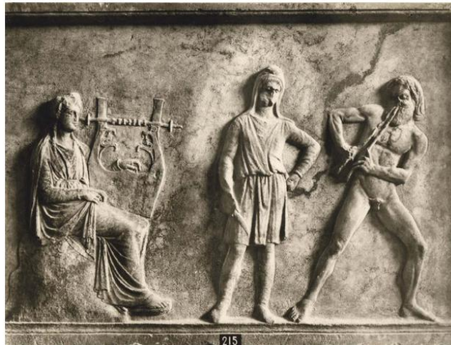
Şekil 3. Praxiteles (M.Ö. 335 civarı) Apollon ve Marsyas rölyefi.

İtalya'nın Toskana bölgesinde, 1853 yılında bulunan ve bugün Louvre Müzesi'nde sergilenmekte olan M.S. 290-300'lere tarihlendirilen Apollon ve Marsyas Lahiti'nin (Şekil 4) olağanüstü bir bütüncül anlatımı vardır (Reclams, 2001, s.327-328). Muhtemelen öykü onunla başladığı için en solda kalkanı ile Athena görülmektedir. Daha sonra Marsyas aulosuyla yeteneklerini göstermektedir. Marsyas ve Apollon'un arasında kulak kabartmış bir mousa (Yunan Mitolojisinde