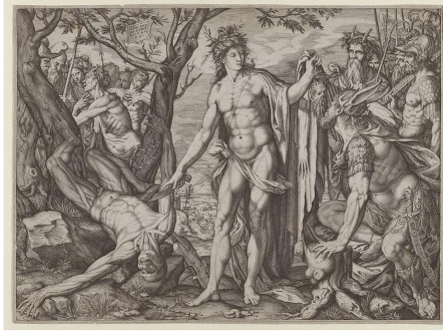
Şekil 22. Melchior Meier'in (1581) – Apollon Marsyas'ın derisini yüzüyor.