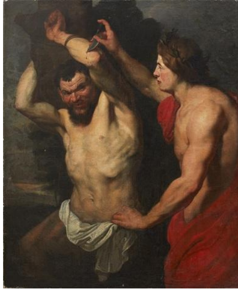
Şekil 13. Peter Paul Rubens – Apollon ve Marsyas.