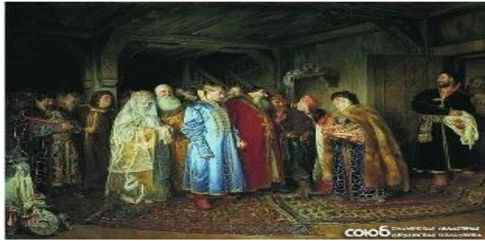
Fotoğraf 2: ‘Söz kesme’ ve ‘el vurma’ geleneğinden temsili bir görüntü

‘Daha sonra masaya oturulur, çay ve şarap içilir, hafif hafif atıştırılır’ (Kayyev, 1949, s.44). Türklerde bu tarz bir adet ve uygulama yoktur; ancak Türk toplumunda da hayır duanın gücüne olan inanç son derece büyüktür.