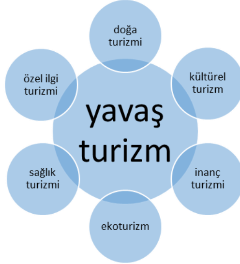
Şekil 2. Yavaş Turizm dięer turizm şekillerini kapsacıyı ancak bağımsız bir turizm şekli olarak ele alınabilir

alanlarının mekânsal deęişiminde birçok sorun yaşanabilmektedir. Kıyı çizgisi ve art bölgesi boyunca gelişen plansız yapılaşma, çoęunlukla orman, tarım alanları ve tüm çevre üzerinde de bir baskı oluşturmakta ve bu alanların tahrip edilmesine neden olmaktadır. Oysa yavaş şehirlerle birlikte ortaya çıkan yavaş turizmde böyle bir kaygı yoktur. Zira bu turizmin temelinde, zengin kültürel yapıya ve çekici mekânlara sahip olan bu alanların; herhangi bir fiziksel deęişime uğramaması, mevcut yapının bozulmadan korunması felsefesi yatmaktadır. Günümüzde turizm faaliyetinin türü ne olursa olsun, her turizm şekli zamanla talepler doğrultusunda, beklentileri karşılamak amacıyla coęrafî görünüm üzerinde bir takım deęişikliklere yol açar. Yavaş turizmde önemli bir mekânsal deęişim beklentisi yoktur, ancak kentsel yaşamı kolaylaştırıcı ve teknolojiyi kullanarak yerleşmenin negatif yönde bir deęişime uğramadan eski yapısını sürdürebilme çabası vardır.