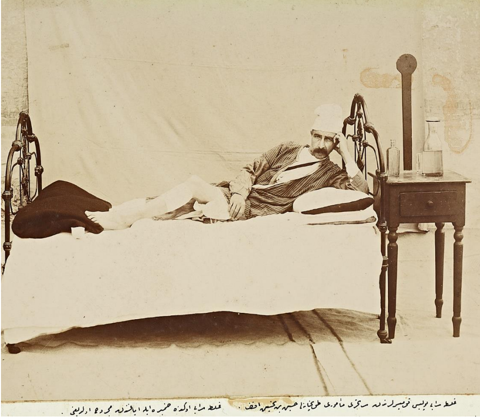
( http://nek.istanbul.edu.tr:4444/ekos/FOTOGRAF/779-71---0011.jpg )