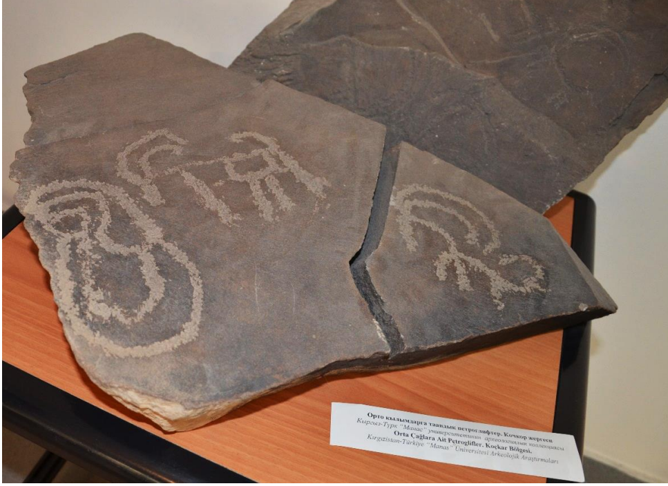
Foto 31: Üzerinde kaya üstü tasvirleri barındıran bir eserin görüntüsü