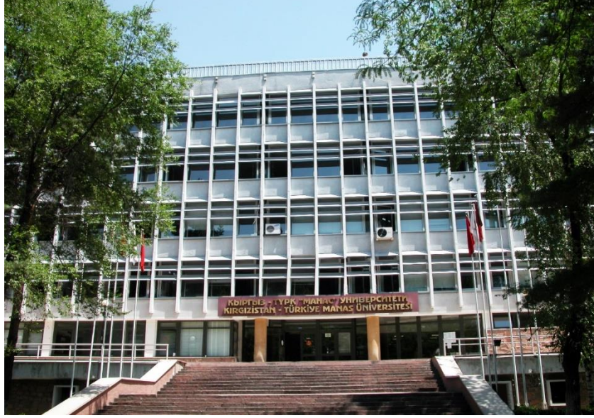
Foto 2: Manas Üniversitesinin şehir merkezindeki binasının giriş kapısından bir görüntü

Manas Üniversitesi kuruluş yıllarında Bişkek şehir merkezinde eğitim öğretime başlamıştır.