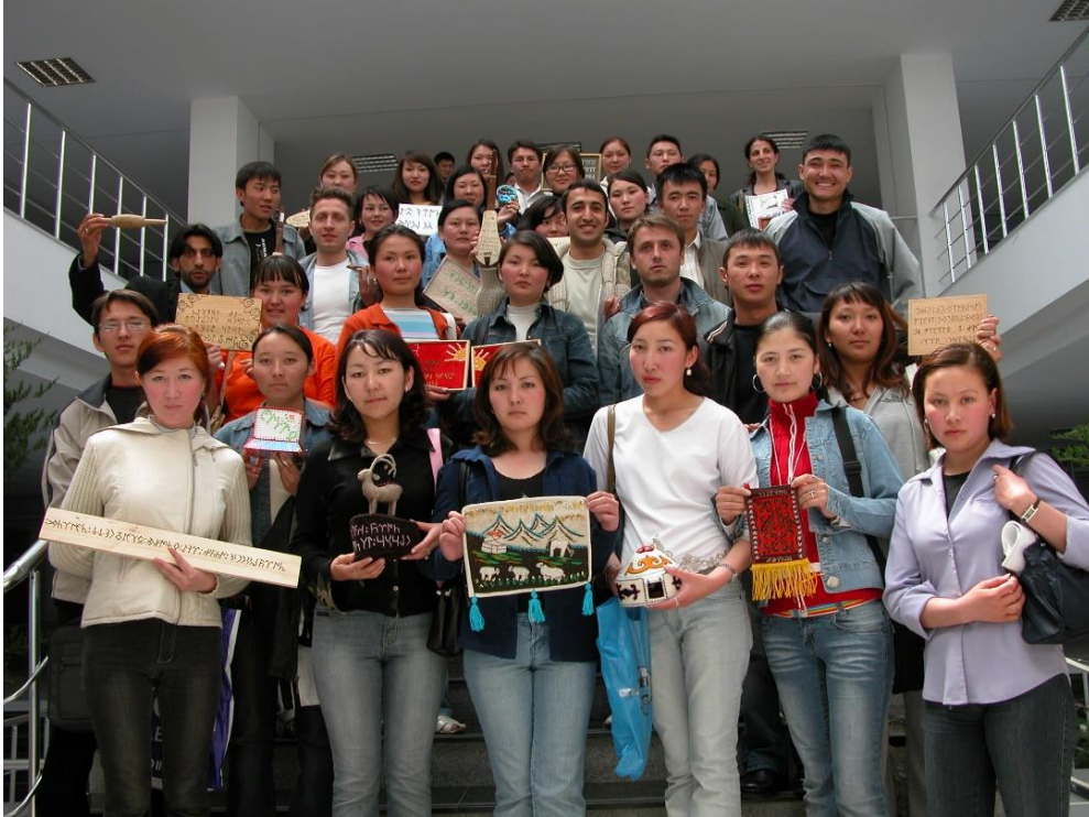
Foto 19: Manas Üniversitesi Türkoloji Bölümü öğrencileri 2004 yılında yaptıkları (Kök)türk harfli objelerle 11

Tarihe, bilime, kültüre, sanata, edebiyata, dile... ait varlıkların korunup sergilendikleri müzeler her yaşta ve her seviyede insanın bilgilendirilmesinde ve bilinçlendirilmesinde de önemli rol oynayan eğitim öğretim kurumlarıdır. Bu sebeple insanlar atalarına ait mirası korumak ve eğitim öğretim materyali olarak kullanmak için önceleri şehirlerde, kasabalarda, köylerde; sonraları ise, eğitim kurumlarında (okullarda ve üniversitelerde) müzeler açmışlardır.