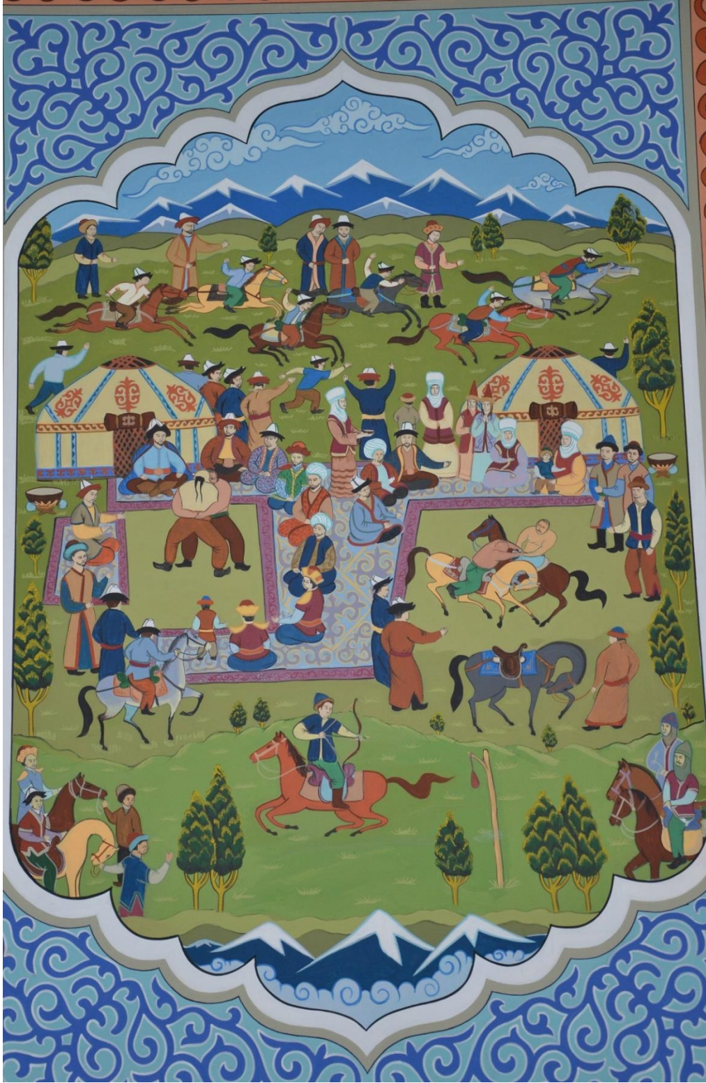
Foto 49: Manas Üniversitesindeki duvar resimlerinden birinin görüntüsü