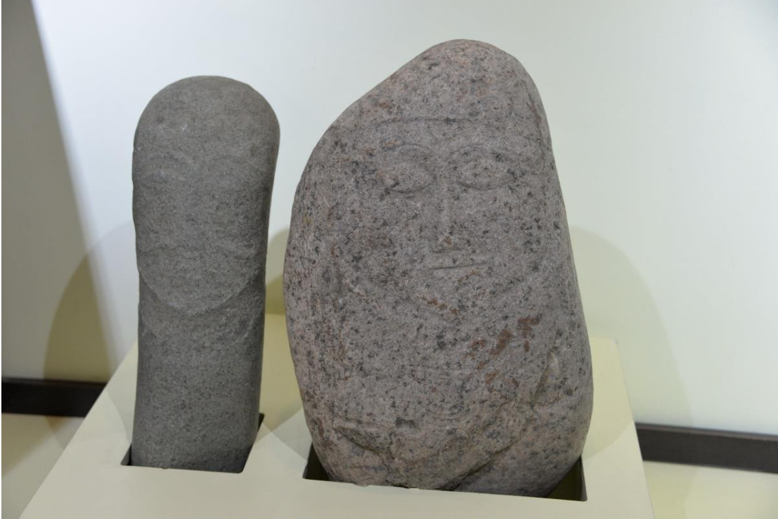
Foto 38: Manas Üniversitesi Arkeoloji - Etnografya Müzesindeki taş babalardan ikisinin görüntüsü

Manas Üniversitesinde açık alanda bulunan taş babaların mümkün olan en kısa sürede Arkeoloji - Etnografya Müzesinde oluşturulacak taş eserler bölümünde sergileneceğine olan inancımızı belirterek; üniversitedeki bazı taş babaların görüntülerini ilgilileriyle paylaşmak yerinde olacaktır: