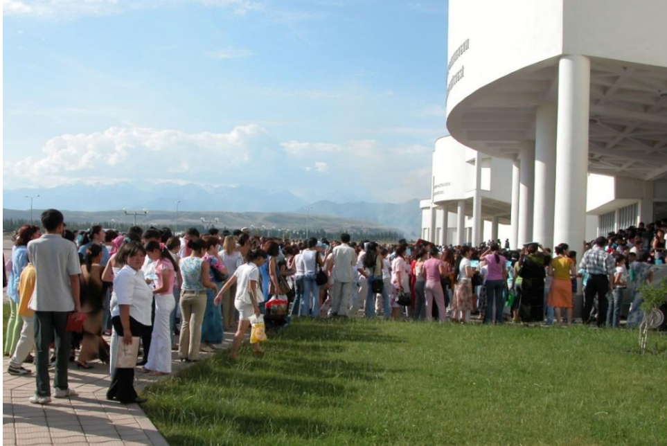
Foto 9: Manas Üniversitesine girmek için sınav sırasında bekleyenlerin görüntüsü 8

Manas Üniversitesinde 16 ülkeden 5000 civarında öğrenci Türkçe ve Kırgızca olarak öğrenim görmektedir. Türkiye Cumhuriyeti vatandaşı öğrenciler üniversiteye ÖSYM tarafından Türkiye’de yapılan sınavlarla; Kırgızistan Cumhuriyeti vatandaşları ile diğer ülkelerden, Türk cumhuriyetlerinden ve akraba topluluklardan gelenler ise ÖSYM’nin Manas Üniversitesindeki temsilciliğinin ve Kırgızistan yetkili makamlarının birlikte yaptıkları sınavlarla kabul edilmektedirler.