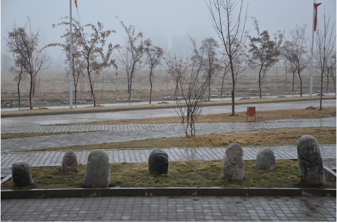
Foto 39: Manas Üniversitesinin İktisadi ve İdari Bilimler Fakültesinin bahçesindeki taş babaların genel görüntüsü