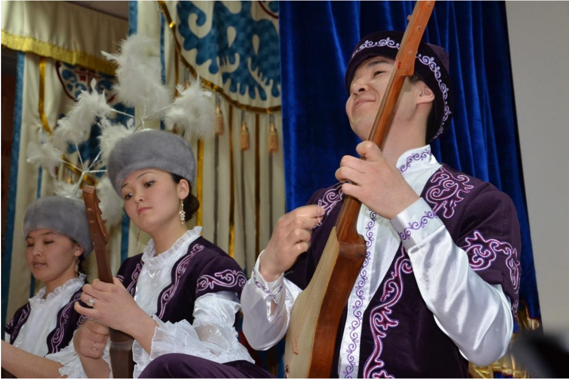
Foto 18: Manas Üniversitesinin kopuzcularından birkaçının icra sırasındaki görüntüsü