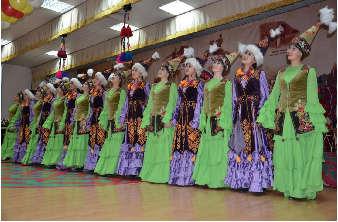
Foto 15: Manas Üniversitesindeki folklor ekiplerinden birinin görüntüsü