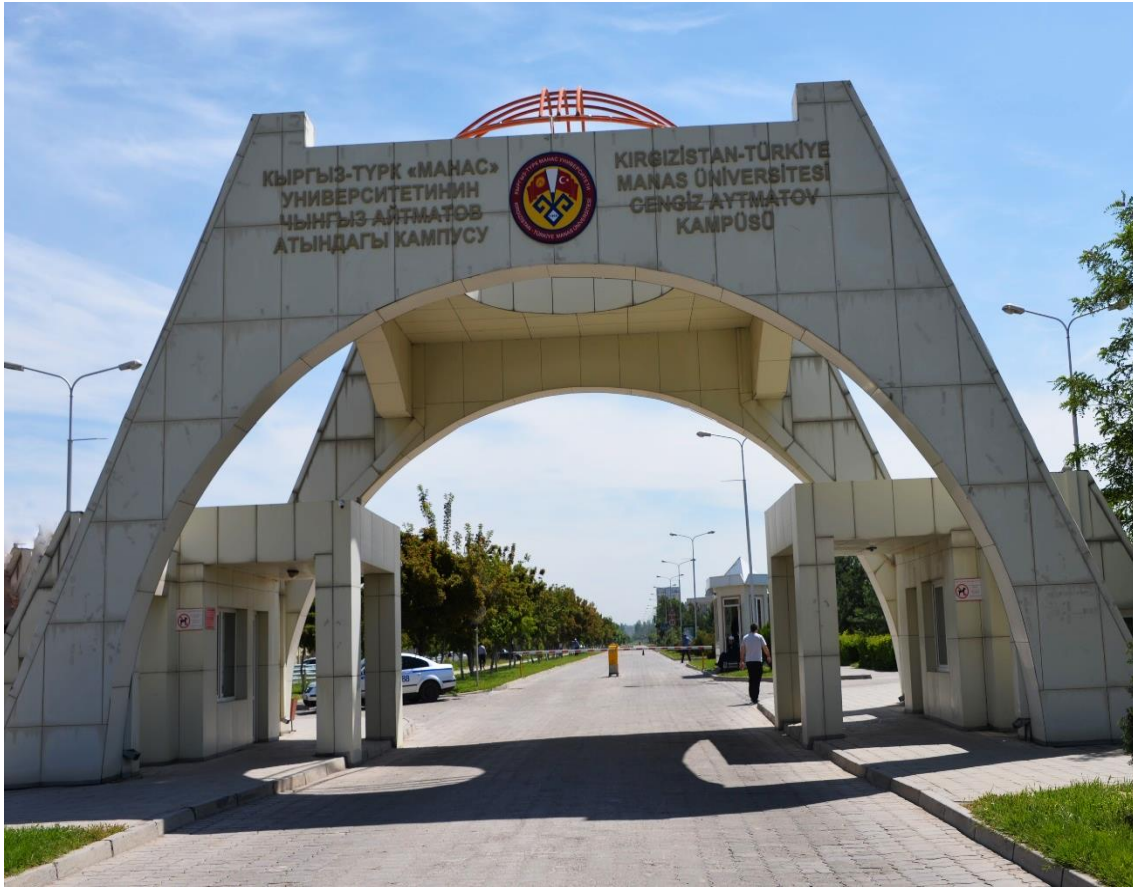
Foto 4: Manas Üniversitesinin Cengiz AYTMATOV Yerleşkesi'nin giriş kapısının görüntüsü 4

Eğitim öğretim esas itibarıyla (sonraki yıllarda Ünlü Kırgız Yazar ve Devlet Adamı Cengiz AYTMATOV'un adı verilen) bu yerleşkedeki (son derece modern) binalarda sürdürülür. 3