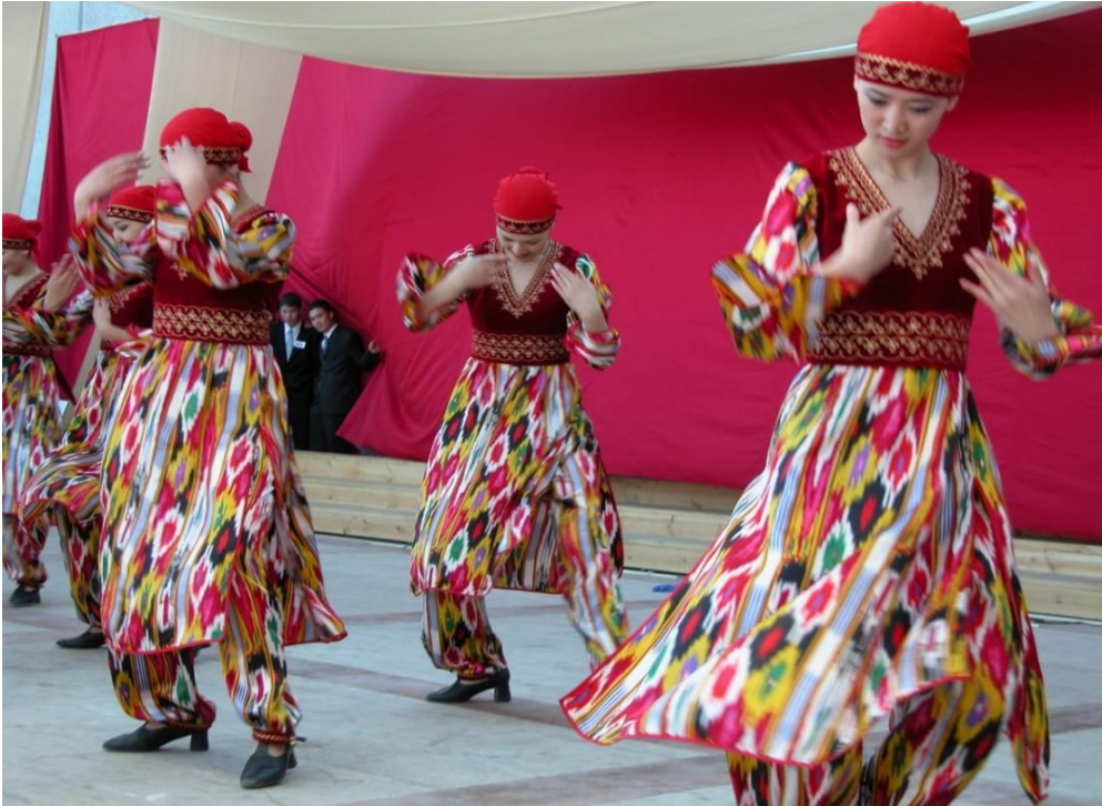
Foto 14: Manas'ın Kızları Anadolu halk oyunlarını icra ederlerken