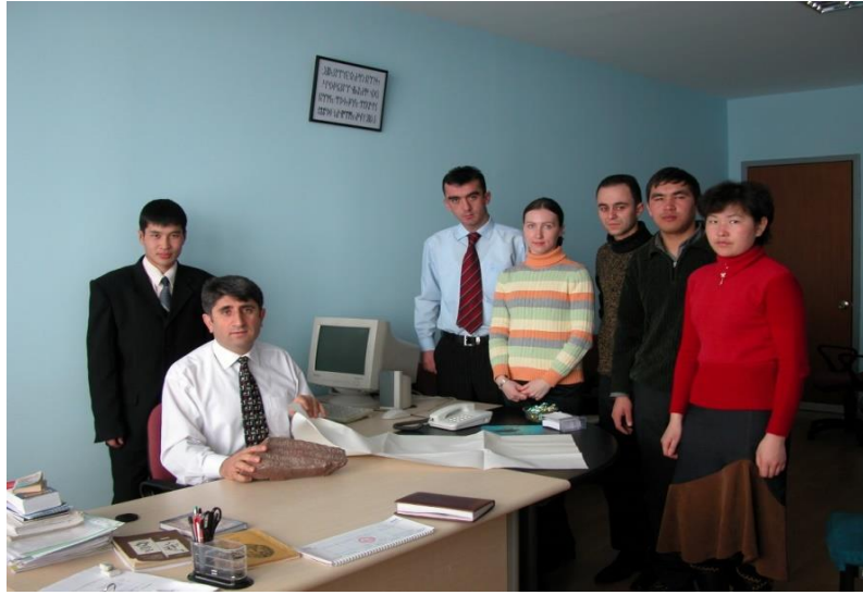
Foto 21: 2004 yılında Manas Üniversitesindeki yüksek lisans öğrencileriyle yazıt bilimi dersinde

bu oda ihtiyaca binaen kapatılmış; söz konusu envanterin tarihî eser niteliği taşıyanları Manas Üniversitesindeki “Arkeoloji - Etnografya Müzesi”ne taşınmış; öğrencilerim tarafından farklı objeler üzerine (Kök)türk harfli metinlerin işlendiği objeler ise konuyla ilgili hocaların odalarına nakledilmiştir.