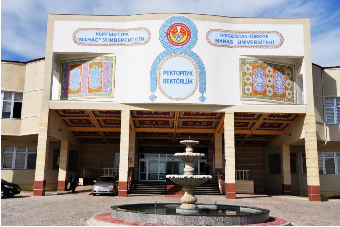
Foto 5: Manas Üniversitesi'nin Cengiz AYTMAOV Yerleşkesi'ndeki rektörlük binasının giriş kısmının görüntüsü