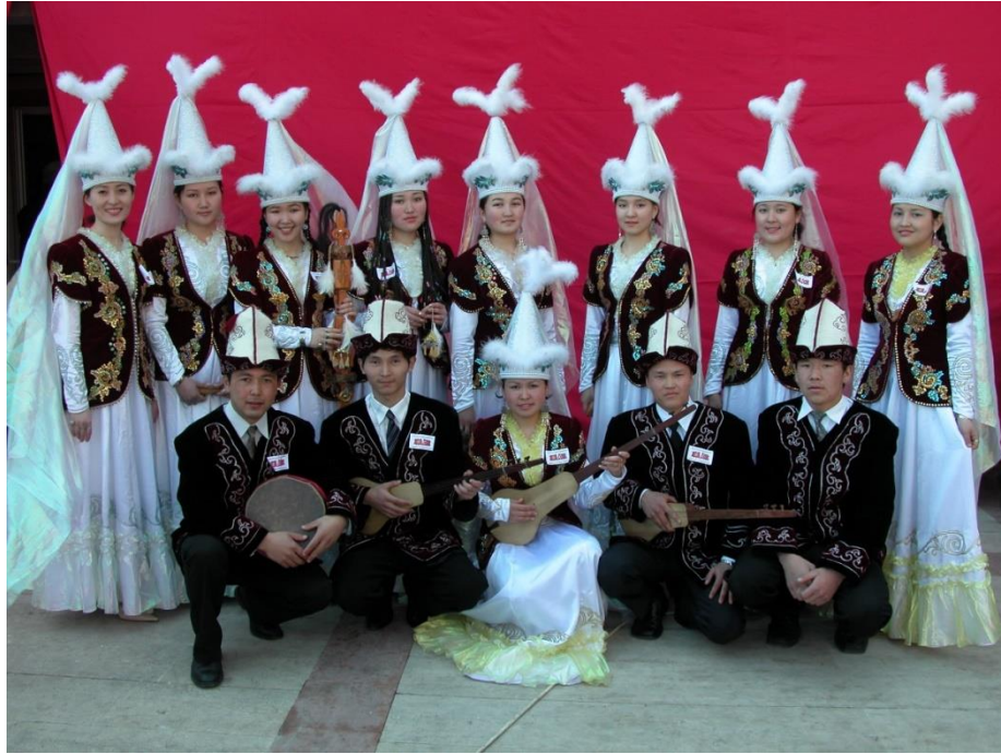
Foto 10: Manas Üniversitesindeki folklor ekiplerinden birinin görüntüsü

Manas Üniversitesindeki folklor ekipleri ve müzik grupları yaptıkları başarılı faaliyetlerle Kırgızistan'da ve Asya coğrafyasında adlarından sürekli söz edilir hâle gelmişlerdir. 10 Bunda söz konusu ekiplerin Türk boy ve topluluklarının yaşayışlarına, inanışlarına ait tarihî değerlerden, verilerden, bilgi ve birikimlerden yararlanmalarının rolü büyüktür. Bu bağlamda Manas Üniversitesinin son derece zengin bir kostüm ve musiki aletleri arşivine sahip olduğunu belirtmek gerekir.