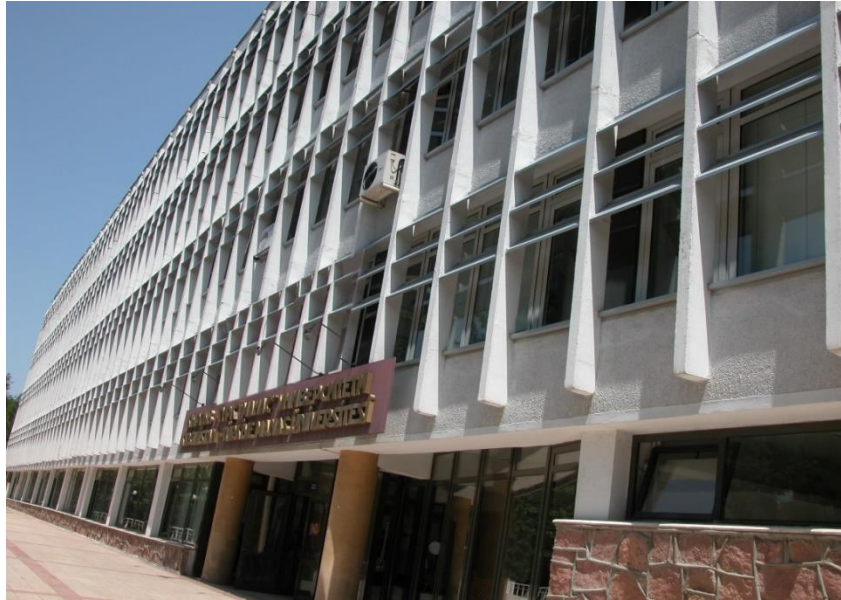
Foto 3: Manas Üniversitesinin şehir merkezindeki binasından bir görüntü