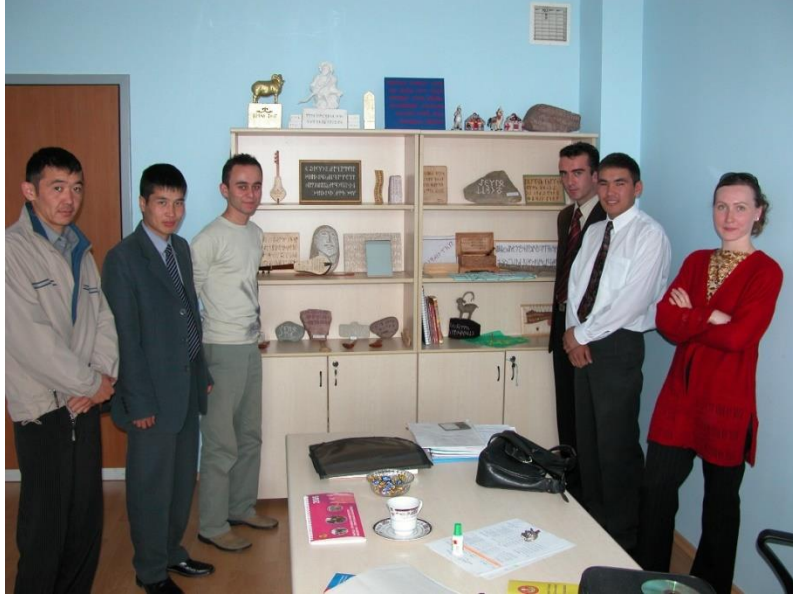
Foto 20: Manas Üniversitesi yüksek lisans öğrencileri 12 , 2004 yılında kendileri ve Türkoloji Bölümü lisans öğrencileri tarafından yapılan ve üzerlerinde (Kök)türk harfli yazılar bulunan bazı objelerle