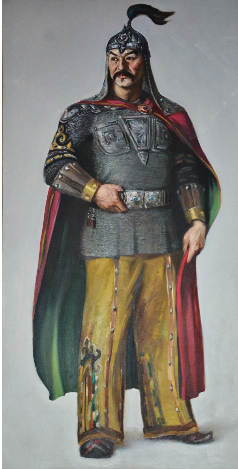
Foto 48: Kırgızların ve bütün Türk Dünyası'nın milli ve efsanevi kahramanı "Manas"ın Manas Üniversitesindeki konferans salonlarından birinin duvarındaki resmi