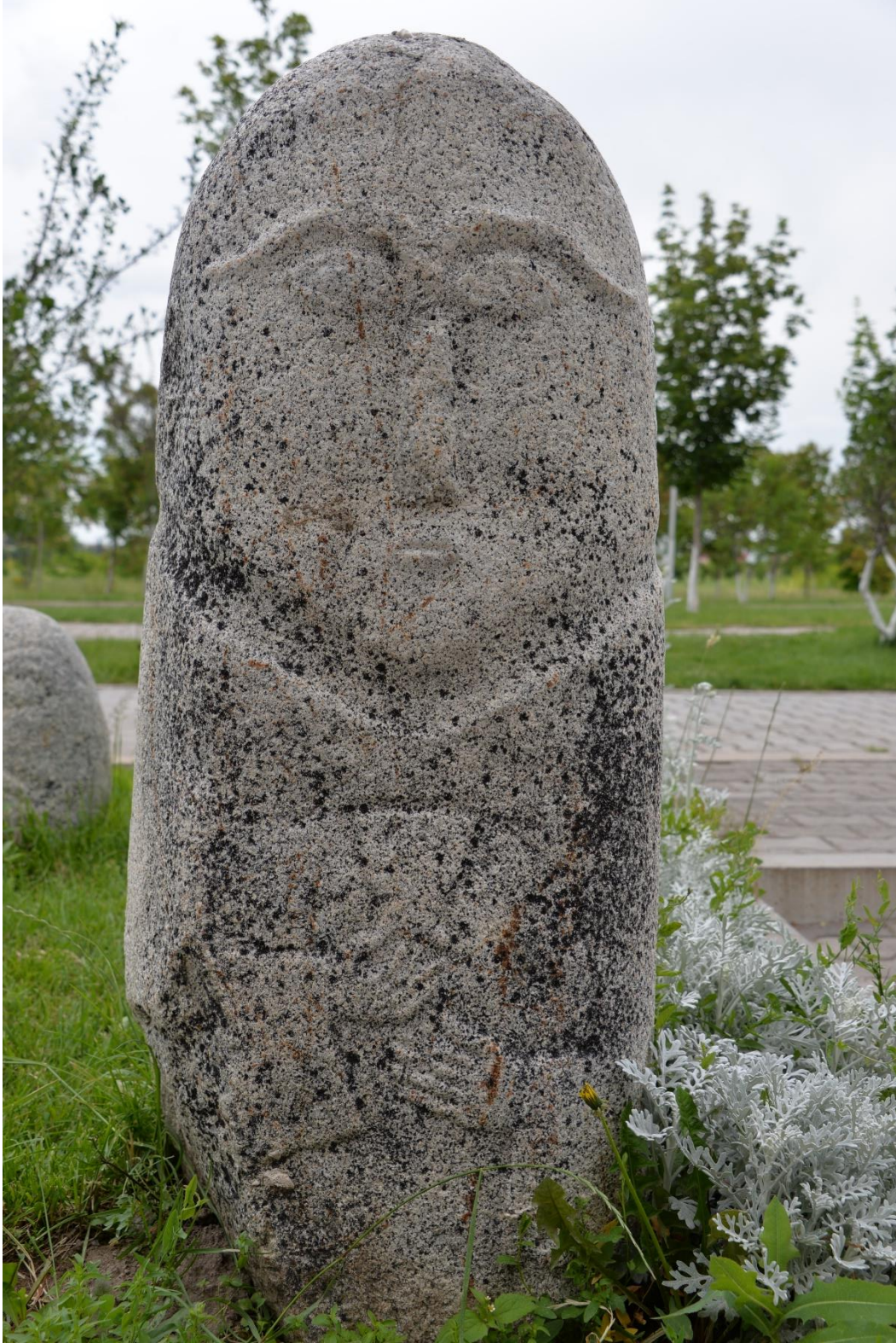
Foto 40: İktisadi ve İdari Bilimler Fakültesinin bahçesindeki taş babalardan birinin görüntüsü