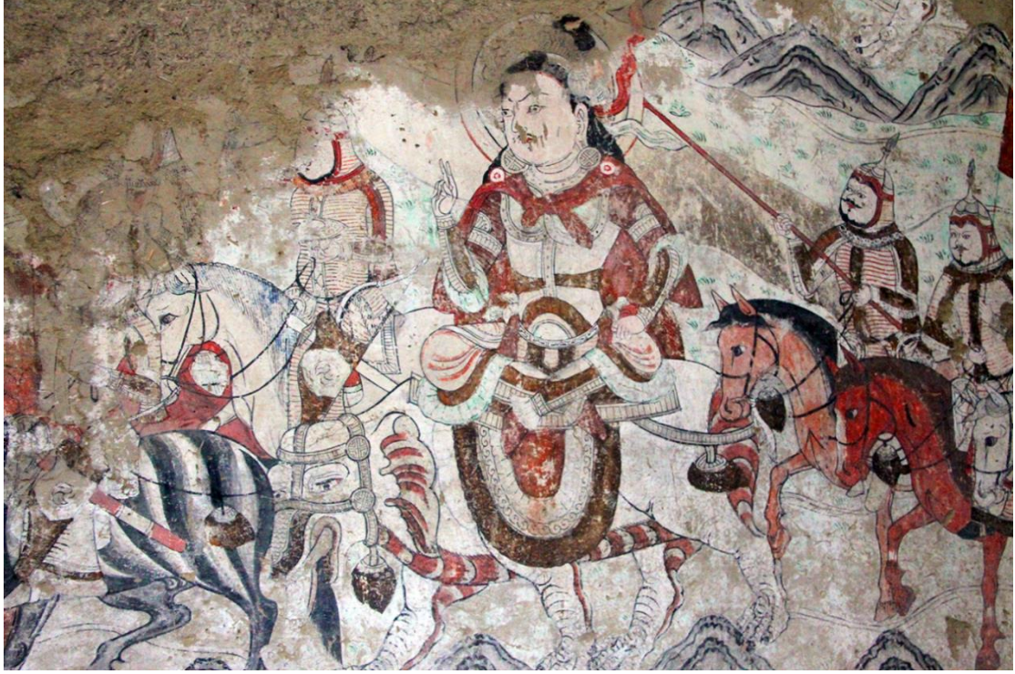
Foto 44: Tarihi Uyghur şehirlerinden Beş Balık'taki duvar resimlerinden bir görüntü (Uyghur Özerk Cumhuriyeti)