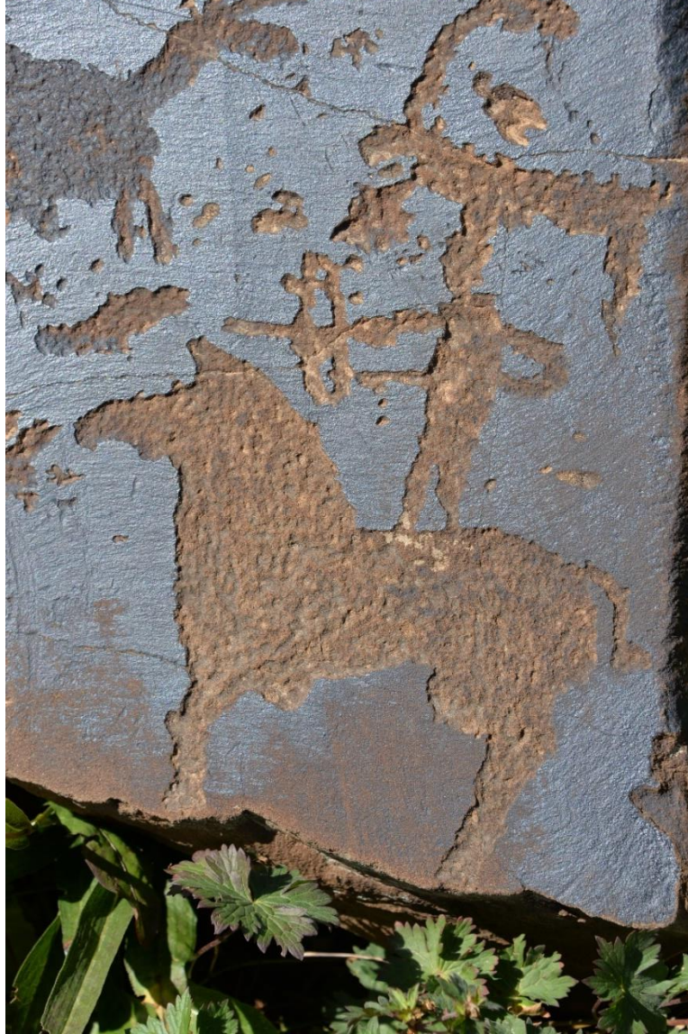
Foto 43: Kırgızistan'da Saymalı Taş'taki kaya üstü resimlerden bir görüntü

Türk boy ve topluluklarının hem grafiksel dil ögesi hem de sanat unsuru olarak resimle ilgileri Milattan Önceki dönemlere dayanır. Asya'dan Avrupa kıtasına kadar Türklerin yaşadıkları bölgelerdeki binlerce yıl öncesine tarihlendirilen petroglifler / kaya üstü tasvirler ve farklı dönemlerde yapılmış duvar resimleri de bunu kanıtlar niteliktedir.