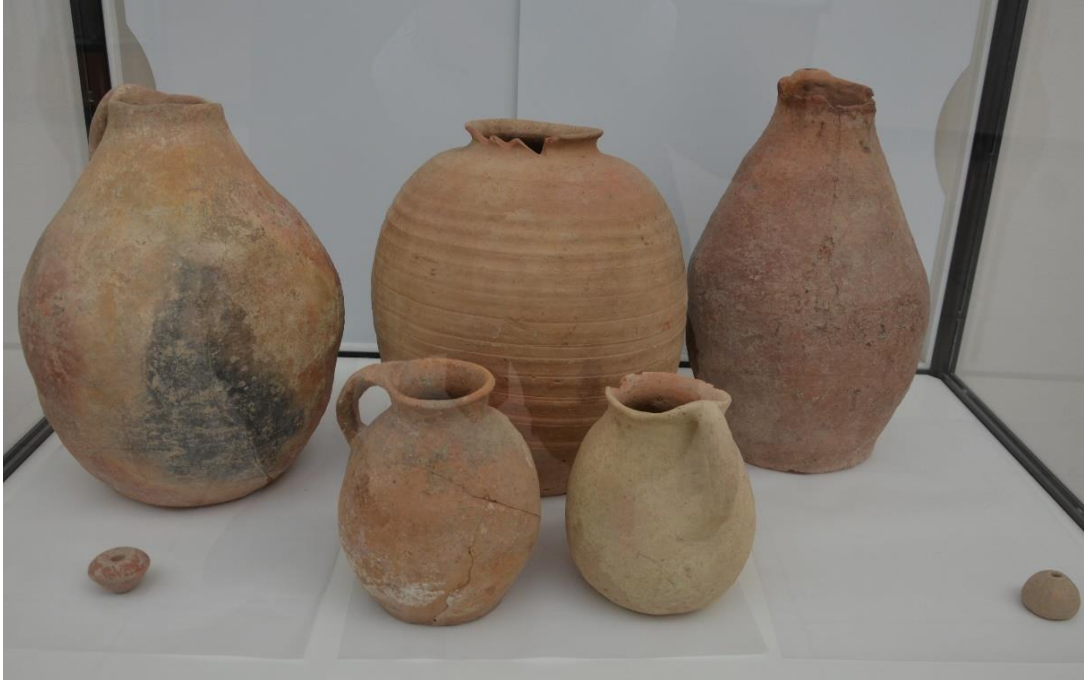
Foto 28: Arkeoloji - Etnografya Müzesindeki saklama kaplarından bir kaçının görüntüsü

Arkeoloji - Etnografya Müzesinde yer alan bazı eserlerin görüntülerini dikkatlere sunmak yararlı olacaktır. 19