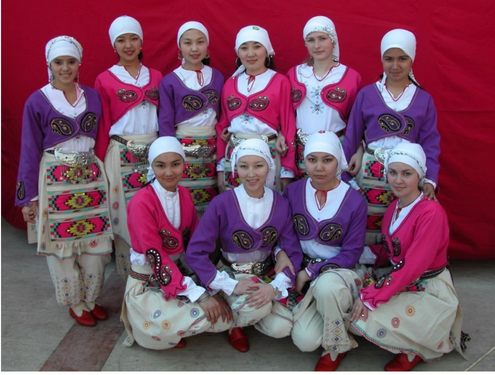
Foto 13: Manas Üniversitesindeki folklor ekiplerinden birinin görüntüsü