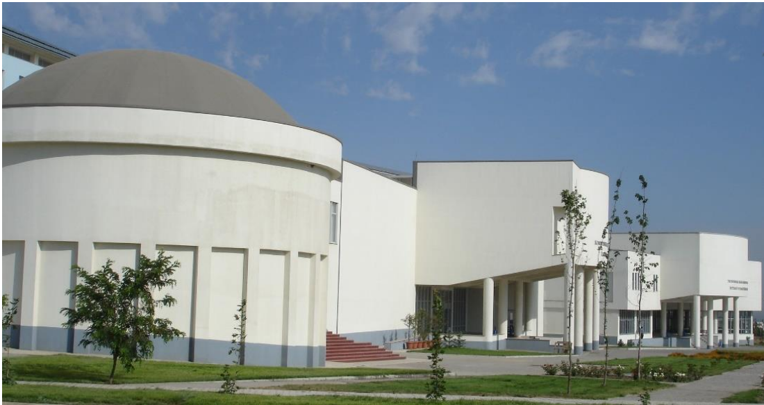
Foto 6: Cengiz AYTMAOV Yerleşkesi'ndeki fakülte binalarından genel bir görüntü