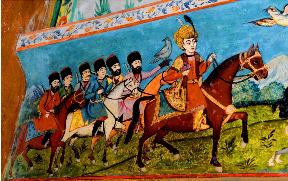
Foto 45: Şeki'deki Han Sarayı'nın duvarlarındaki resimlerinden bir görüntü (Şeki - Azerbaycan Cumhuriyeti)