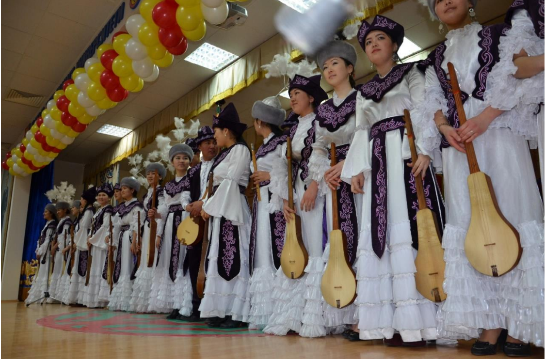
Foto 17: Manas Üniversitesi musiki ekiplerinden birinin dinleti öncesindeki görüntüsü