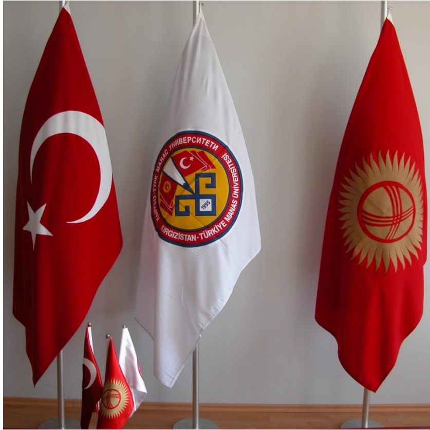
Foto 7: Türkiye Cumhuriyeti'nin ve Kırgızistan Cumhuriyeti'nin bayraklarıyla Manas Üniversitesinin logosunun görüntüsü

Bütçesinin büyük bölümü Türkiye Cumhuriyeti Devleti tarafından karşılanan Kırgızistan - Türkiye Manas Üniversitesinin bünyesinde 9 fakülte (Edebiyat Fakültesi, Fen Fakültesi, İletişim Fakültesi, İktisadi ve İdari Bilimler Fakültesi, Mühendislik Fakültesi, Veteriner Fakültesi, Ziraat Fakültesi, Güzel Sanatlar Fakültesi, İlahiyat Fakültesi), 4 yüksekokul (Yabancı Diller Yüksekokulu, Beden Eğitimi ve Spor Yüksekokulu, Turizm ve Otelcilik Yüksekokulu, Meslek Yüksekokulu), 2 enstitü (Sosyal Bilimler Enstitüsü, Fen Bilimleri Enstitüsü), 6 araştırma ve uygulama merkezi (Türk Uygarlığı Araştırma ve Uygulama Merkezi, Orta Asya Araştırmaları Merkezi, Biyoteknoloji - Biyoçeşitlilik Araştırma ve Uygulama Merkezi, Uzaktan Eğitim Merkezi, Sürekli Eğitim Merkezi, Teknoloji Merkezi, Öğrenci Seçme ve Yerleştirme Merkezi) bulunmaktadır.