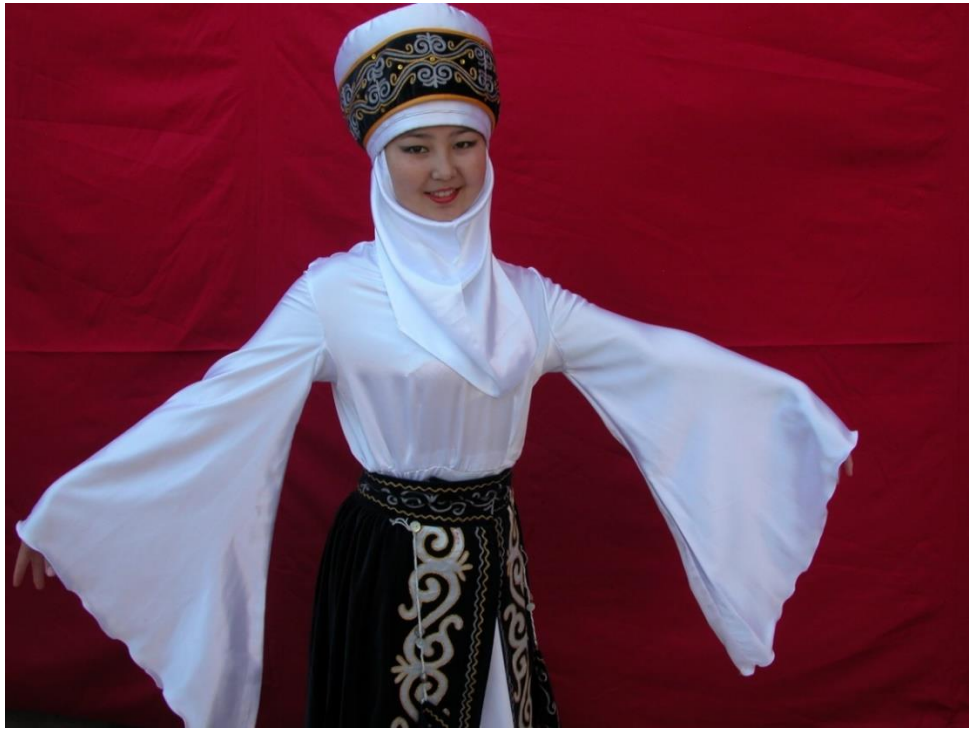
Foto 12: Manas Üniversitesindeki folklor ekiplerinde görev yapan otantik kıyafetler içindeki öğrencilerden birinin görüntüsü