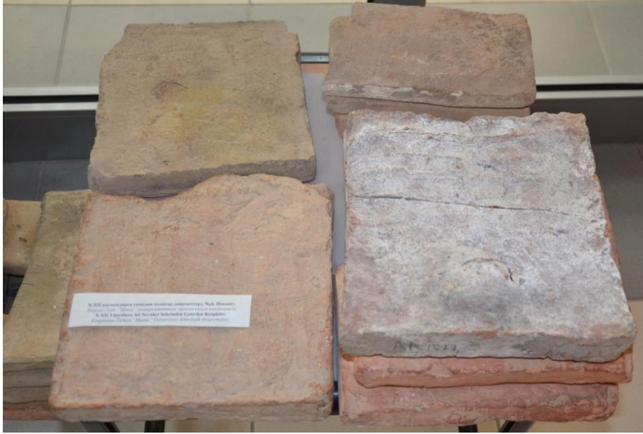
Foto 29: Manas Üniversitesindeki bilim adamları tarafından yapılan kazılarda ortaya çıkarılıp müzeye getirilen bazı kerpiçlerin görüntüsü