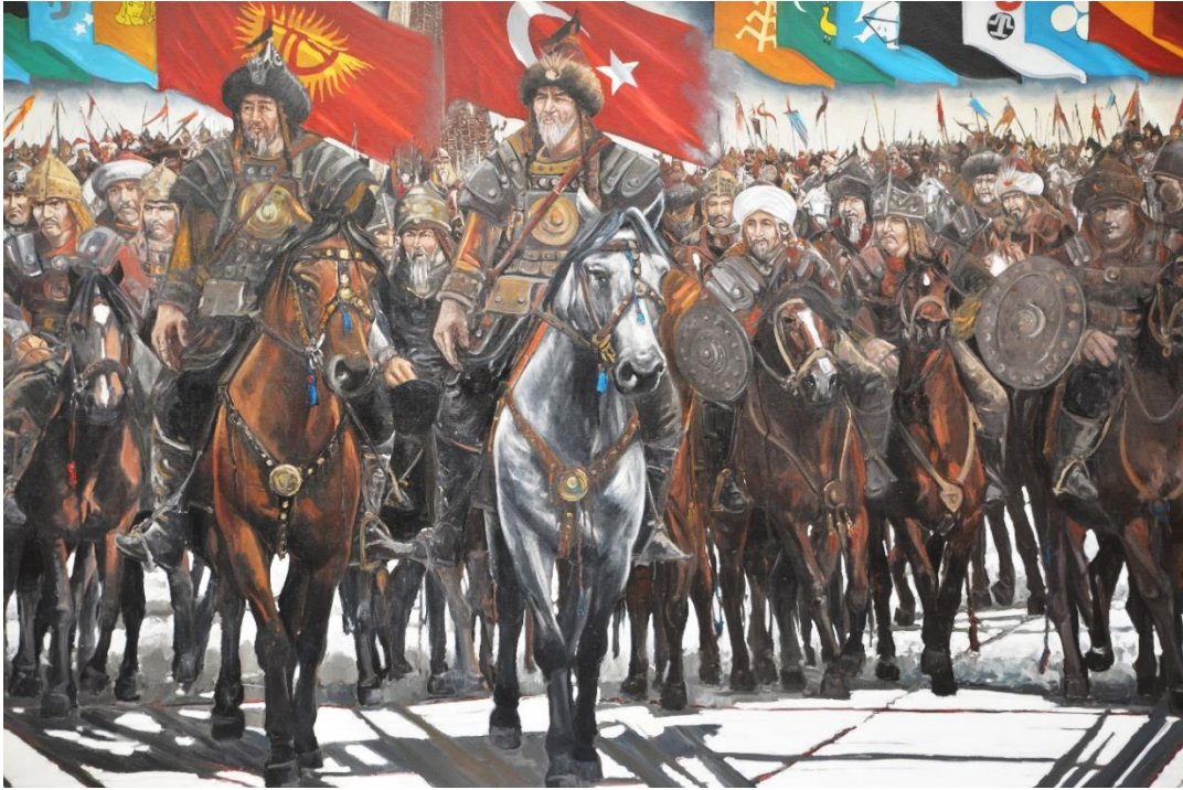
Foto 46: Manas Üniversitesindeki duvar resimlerinden birinin yakın görüntüsü

Manas Üniversitesindeki tarihî, sosyal ve kültürel içerikli bu duvar resimleri ve tablolar hem bir geleneğin devam ettirilmesi hem de toplumsal değerlerin gelecek kuşaklara aktarılması açısından önemlidir.