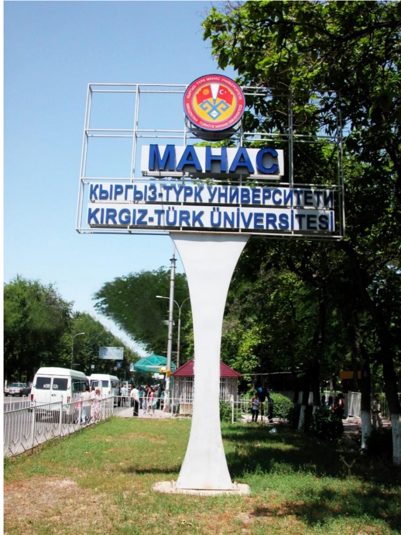
Foto 1: Manas Üniversitesinin şehir merkezindeki 1 binasının önünde bulunan tabelanın görüntüsü 2

Kırgızistan - Türkiye Manas Üniversitesi de iki kardeş devlet arasındaki ilişkilerin taçlandırılması amacıyla İzmir'de imzalanan eğitim ve kültür anlaşmaları çerçevesinde 30 Eylül 1995 tarihinde kurulmuş; 1997-1998 yılında da eğitim öğretime başlamıştır.