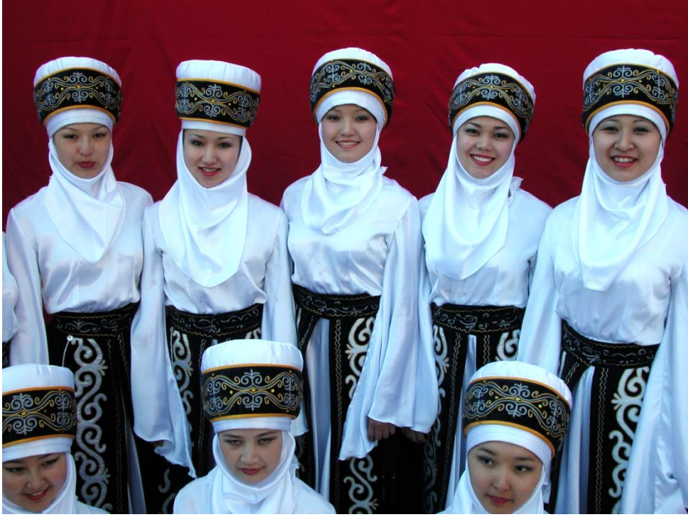
Foto 11: Manas Üniversitesindeki folklor ekiplerinden birinin görüntüsü