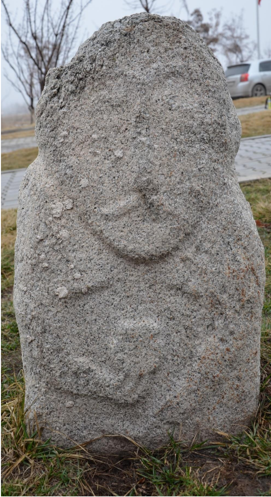
Foto 41: İktisadi ve İdari Bilimler Fakültesinin bahçesindeki taş babalardan birinin görüntüsü