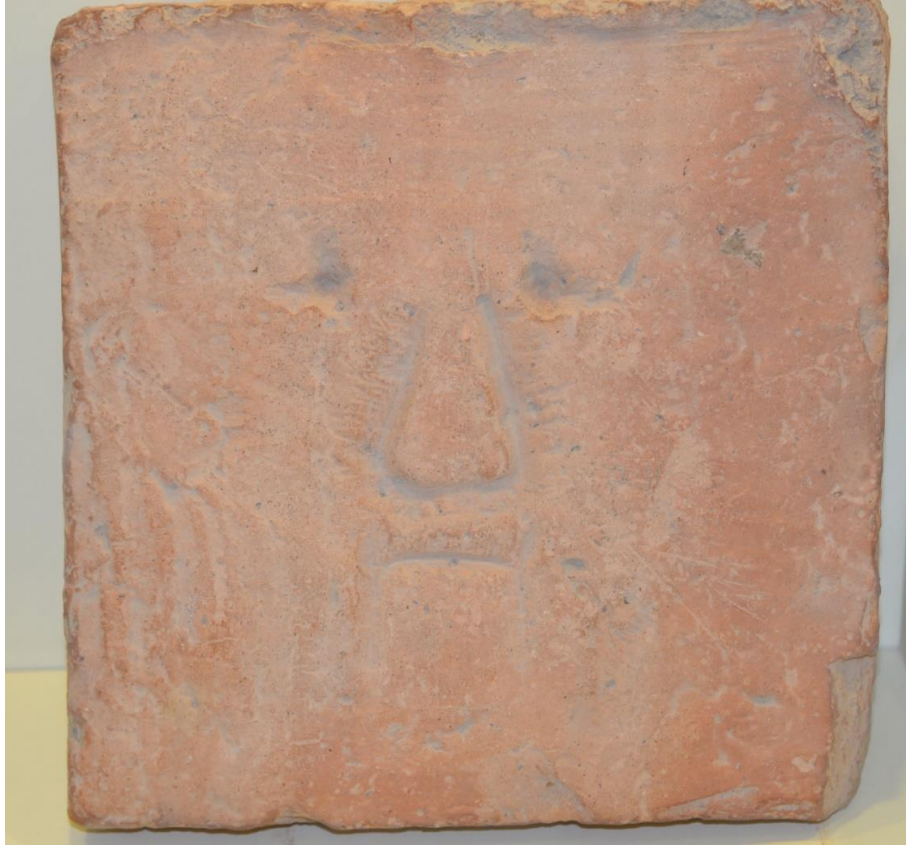
Foto 30: Üzerine insan yüzü tasvir edilmiş bir kerpiğin görüntüsü