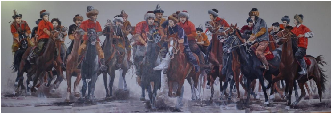
Foto 47: Manas Üniversitesindeki duvar resimlerinden birinin görüntüsü