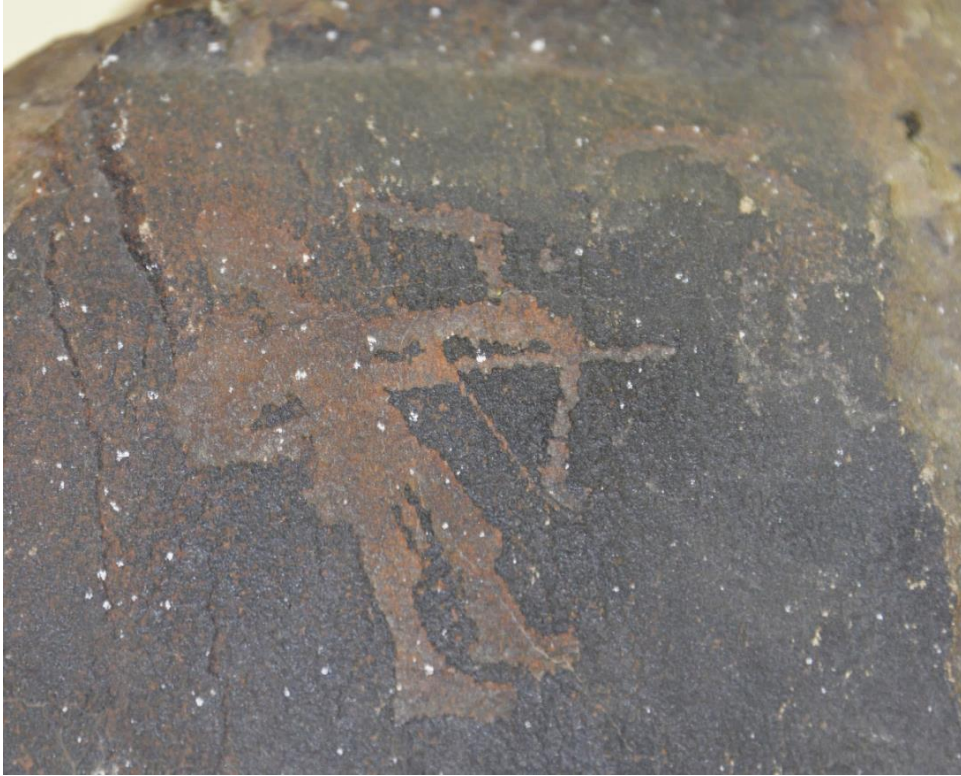
Foto 32: Avlanma sahnesini yansıtan bir eserin / kaya parçasının görüntüsü