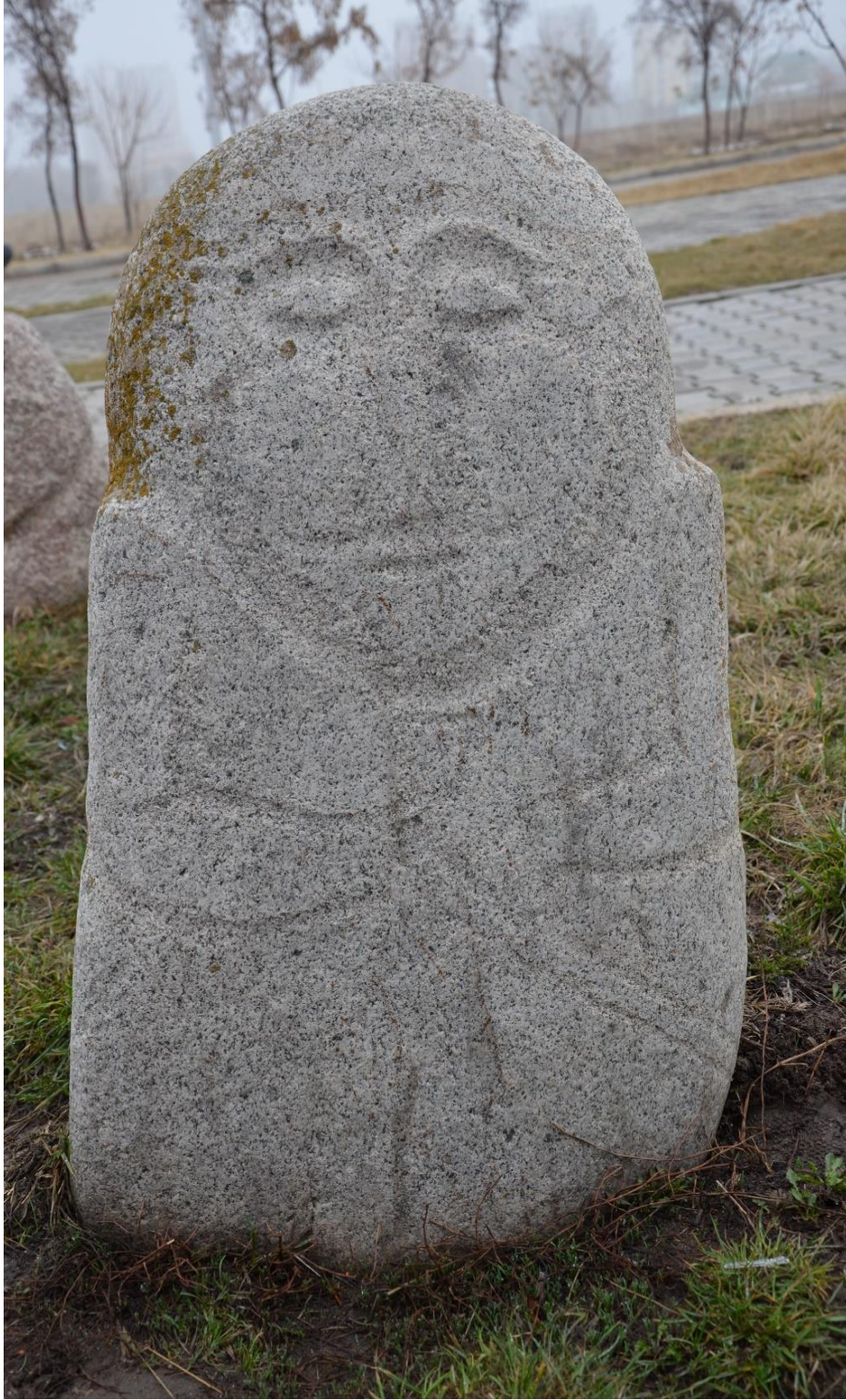
Foto 42: İktisadi ve İdari Bilimler Fakültesinin bahçesindeki taş babalardan birinin görüntüsü