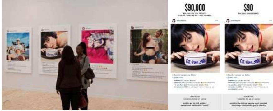
Görsel 9. Sergi alanında yer alan fotoğraf ve SuicideGirls tarafından yapılan satışa dair paylaşım görseli.

2020 yılına kadar Detroit Çağdaş Sanat Müzesi baş küratör ve müdürlük görevini yürüten Elysia Borowy, kişilerin sosyal medya platformlarından elde edilen ve izinsiz olarak kullanılan görüntülerinin kullanımını herhangi bir yerde yürürken veya otururken izin almadan çekilen fotoğraflar kadar özel hayatın mahremiyetini ve gizliliğini ihlal eden bir suç olarak değerlendirmiştir 19 .