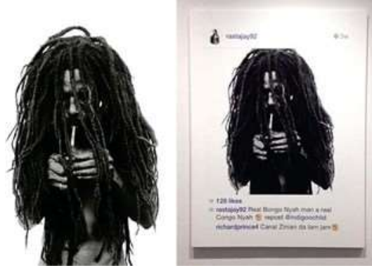
Görsel 7. Donald Graham'ın fotoğrafı ve Richard Prince'in sergisinde yer alan fotoğraf

Serginin açıldığı galerinin sahibi olan Larry Gagosian, bir Graham fotoğrafını ne göstereceğini ne de satın alacağını belirtmiş, fotoğrafçının onun sergisinden sonra tanındığı ve fiyatlarının arttığını 14 iddia etmiştir. 2 Mart 2018'de Prince attığı tweet'te: "LACMA'da (Los Angeles Şehir Sanat Müzesi) dün gece. Sanatçılar başka sanatçılara dava açmaz. Bir araya gelirler, bir fincan kahve içerler, tartışırlar, tenekeyi tekmelerler, içindekini dökerler, Barnett Newman hakkında ve kuşlar için ornitoloji olduğu gibi sanatçılar için estetiği konuşurlar." 15 sözleri ile kendisine açılan davalara dair yorum yapmıştır.