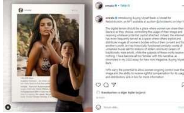
Görsel 11. Emily Ratajkowski'nin NFT satışını duyurduğu Instagram paylaşımı

Emily Ratajkowski evinin duvarında asılı olan, Prince'in sergisinde yer alan fotoğrafının önünde fotoğraftaki gibi aynı pozu verirken fotoğrafını çekirmiştir. "Kendimi Geri Satın Almak: Bir model ne zaman kendi imajının sahibi olur?" (Buying Myself Back: A model for Redistribution) adını verdiği fotoğrafının NFT'si oluşturulmuş, 140 bin dolara, Christie's Müzayede Evi'nde 14 Mayıs 2021'de gerçekleştirilen açık arttırma ile ismi açıklanmayan bir kişi tarafından da satın alınmıştır (Görsel 10).