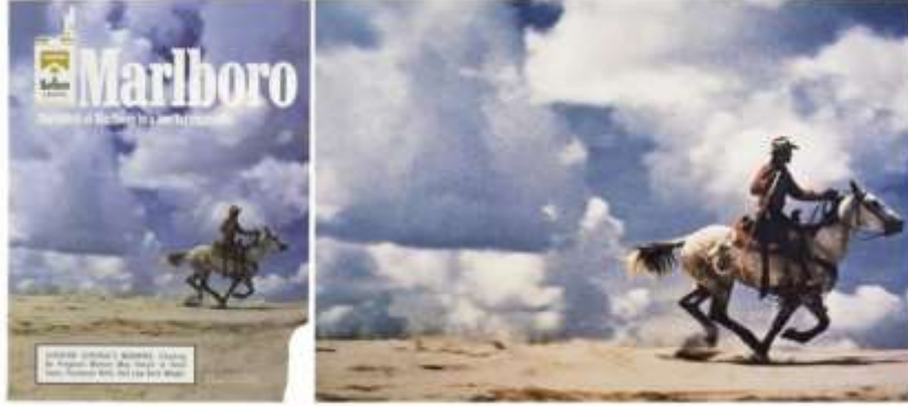
Görsel 1. Sam Abell tarafından çekilen ve Marlboro markasının reklamlarında kullanılan fotoğraf ve Richard Prince tarafından yeniden yorumlanan fotoğrafı.

Norm Clasen'ın Marlboro için 1985 ve 1987 yıllarında çekmiş olduğu "Kovboy" serisinde yer alan fotoğraflar, Prince tarafından "İsimsiz (Kovboy)" olarak adlandırıldığı bir seride kullanılmıştır (Görsel 2). Prince, Clasen'in fotoğraflarını reklam fotoğrafı niteliğinden çıkarmış, bir galeri duvarlarına asarak sanatsal bir fotoğraf haline getirmiş ve satışlarından da 1 milyon dolar gelir elde etmiştir. Clasen fotoğraflarının kullanılması ile ilgili görüşlerini şöyle aktarmaktadır: "Birinin çalışmanızı kopyaladığını görürseniz, içinizde "Bu benim" diyen bir ses vardır. Birisi o işi aldı ve yeniden fotoğrafını çekti. Orada çingiraklı yılanlarla, karıncalarla, sivrisineklerle yatanlar değil." 7 Bu sözleriyle Clasen fotoğrafçıların çekim aşamasında ortamın koşulları nedeniyle maruz kaldıkları karşısında Prince'in bu zor koşulları, sıkıntıları yaşamadan sahiplenmesine dikkat çekmektedir. 2018'de Prince LACMA'da, "İsimsiz (Kovboy)" Clasen ise M+B Photo Galerisi'de "Başlıklı (Kovboy)" adlı sergisi ile fotoğraflarını eş zamanlı olarak sergilemiştir. Clasen bu sergideki satıştan elde edeceği gelirin bir kısmını da APA Amerikan Fotoğraf Sanatçıları platformuna, telif hakkı savunma fonuna bağışlama kararı almıştır.