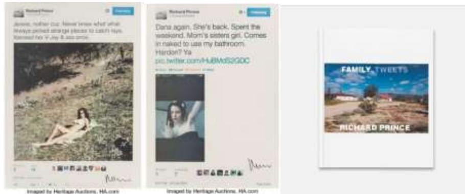
Görsel 6. Richard Prince, Family Tweets serisinden fotoğraflar ve albüm kapağı.

Giderek artan kullanıcı sayısına ulaşan ve kişilerin hayatlarında önemli bir yer edinen sosyal paylaşım platformları ve bu platformlarda paylaşılan görüntüler, kendine mal eden sanatçılar için de yeni sanatsal malzeme bulma anlamında önemli bir mecra olma özelliği göstermektedir. Richard Prince anne, kardeşler, yeğenler, kuzenler, amcalar, teyzeler, kayınvalideler üvey çocuklar, erkek ve kız arkadaşlardan oluşan aile fotoğraflarına eklediği kısa yorumlarının da yer aldığı 38 tweet'inden Aile Tweet'leri "Family Tweets" serisini oluşturmuştur (Görsel 6). Serideki fotoğrafların yer aldığı aynı adlı sergisini 2017 yılında açmış ve açılışın 15'nci dakikasında sergilenen fotoğrafların hepsi satılmış, sonrasında da bu serginin albümü basılmıştır. Sergi en son 2021 yılında tekrar açılmıştır.