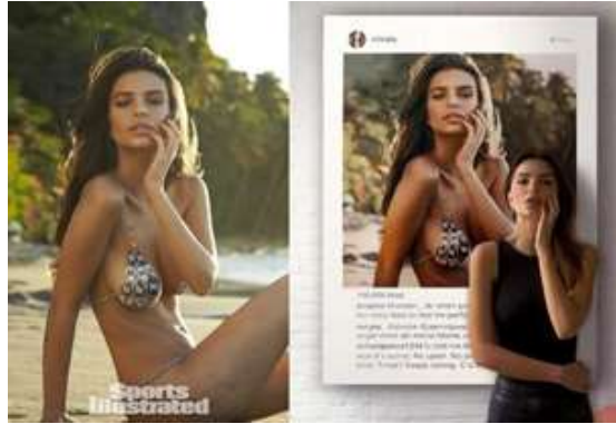
Görsel 10. Emily Ratajkowski'nin Sports Illustrated için çekilen fotoğrafı ve “Kendimi Geri Satın Almak: Bir model ne zaman kendi imajının sahibi olur?” adlı NFT'si üretilen fotoğrafı.

Ratajkowski fotoğrafının sergilenmesine dair duygularını şu sözleriyle ifade etmiştir: “Erkek arkadaşım bana seriye dahil olmaktan onur duymam gerekiyormuş gibi hissettirdi. Richard Prince önemli bir sanatçı ve görüntümü bir tabloya layık gördüğü için ona minnettar olmam gerektiği ima edildi. Ne kadar onaylayıcı... Ve bir yandan onur da duymuştum. UCLA'da sanat okudum ve Prince'in Instagram'a Warholcu yaklaşımını takdir edebilirim. Yine de hayatımı fotoğraflar için poz vererek kazanıyorum ve benden çok daha fazla para eden, zirvedeki, gösterişli bir sanatçının Instagram gönderilerimden birini alıp kendisininmiş gibi satabilmesi garip geldi” 24 .