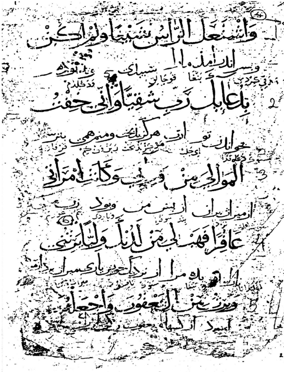
EK: British Library Nüshasının 1b Varağı