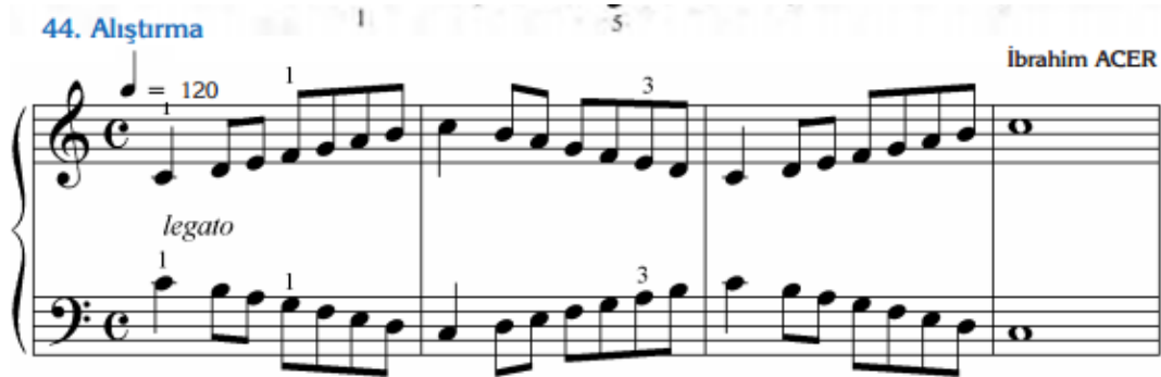
řekil 4. Ters Hareket İçeren Dizi Çalıřmasının Bulunduđu Eser Örneđi

Say'a göre; "dizi; ses perdelerinin belirli kurallara göre birbirini izleyerek bir müzik sistemine temel olan ardılıđıdır. Sadece bir soyutlama özelliđinde olan ses dizileri, melodinin kaynađıdır. Melodinin gezinme alanını dizideki perdeler belirler. Latince scale, Fransızca gamme, Almanca Tonleiter, Skala, İtalyanca scala, gamma, İspanyolca, Escala, gamma." (2005; 159) řeklinde adlandırılır. řekil 3'te, 9. Sınıf pişano ders kitabında bulunan ters hareketli dizi çalıřması yer almaktadır. Ter hareketli dizi çalıřmasından sađ el çıkıcı dizi yaparken, sol el inici dizi, sađ el inici dizi yaparken, sol elde çıkıcı dizi çalıřması yapmaktadır.