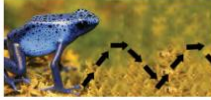
Şekil 9. Legato Tekniğini Anlatan Görsel

Şekil 9’da yer alan, legato tekniğinin anlatıldığı görselde kurbağa zıplaması örneğine yer verilmiştir. Ancak kurbağa örneği legato terimini anlatmak amacıyla değil de, staccato terimini anlatmak amacıyla daha uygun olabilir. Sağer’e göre; “legato, notaların birbirine bağlanarak seslendirilmesi” anlamına gelirken staccato ise “notaların sıçratılarak seslendirilmesi anlamına gelmektedir. Bu doğrultuda kurbağa sıçrayışıyla staccatonun bağdaştırılmasının uygun olabileceği düşünülmektedir.