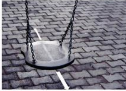
Şekil 10. Legato Tekniğini Anlatan Görsel

Şekil 9’da yer alan, legato tekniğinin anlatıldığı görselde kurbağa zıplaması örneğine yer verilmiştir. Ancak kurbağa örneği legato terimini anlatmak amacıyla değil de, staccato terimini anlatmak amacıyla daha uygun olabilir. Sağer’e göre; “legato, notaların birbirine bağlanarak seslendirilmesi” anlamına gelirken staccato ise “notaların sıçratılarak seslendirilmesi anlamına gelmektedir. Bu doğrultuda kurbağa sıçrayışıyla staccatonun bağdaştırılmasının uygun olabileceği düşünülmektedir.