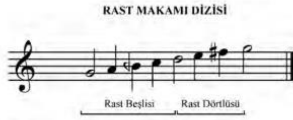
Şekil 7. Rast Makamı Dizisi

Şekil 7’de Rast Makam dizisi yer almaktadır. 9. Sınıfta bulunan öğrencilerin piyanoda çalmak üzere karşılaştıkları ilk makamsal çalışma için yalnızca rast makam dizisi verilmiştir. Ancak makamsal dizinin piyanoda nasıl çalınacağı hakkında bilgi verilmemiş ve uygulanabilmesi için sağ ve sol elin birlikte kullanılabilmesi bir makamsal dizi çalışması yer almamaktadır. Ayrıca şekil 7’de yer alan bir koma bemolün piyanoda nasıl çalınacağı hakkında bilgiye yer verilmemiştir.