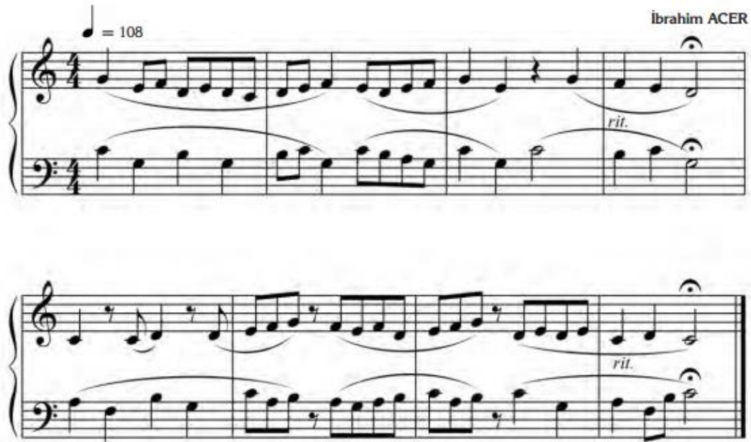
Şekil 2. Akor Çalışmalarının Ardından Gelen Destekleyici Eser

“Bir esas ses üzerine üçlü aralıklarla kurulan ve en az üç sestten oluşan ses kümelerine akor denir”( Sağer, 2004;42). Şekil 1’de, 9. Sınıf piyano ders kitabında bulunan sol el akor çalışmaları yer almaktadır. Teknik çalışmanın anlatımı, kitapta bu şekilde gerçekleştirilmiştir.