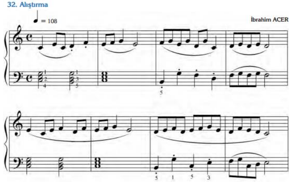
Şekil 12. Staccato Tekniği İçeren Eser Örneği

Şekil 12’de görüldüğü gibi staccato tekniğini anlatan bir ölçülük çalışmaya yer verilmiştir. Ardından gelen kısa alıştırmalardan sonra, Şekil 12’de bulunan staccato tekniğini içeren bir esere yer verilmiştir. Bitapta bulunan staccato çalışması için yazılmış alıştırmanın yeterli olduğu ancak eserde staccato tekniğine yer verilme durumu yeterli görülmemektedir. Bu doğrultuda, eserin staccato tekniğini desteklemediği yorumunu yapılabilir.