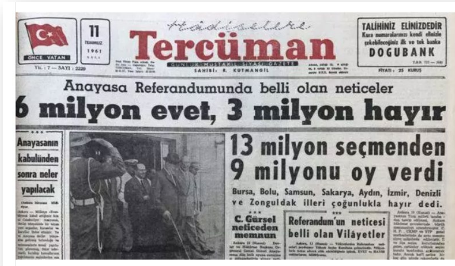
EK 8: Tercüman Gazetesi, 11 Temmuz 1961, Anayasa'nın Halk Oylamasına Sunulmasının Sonucu