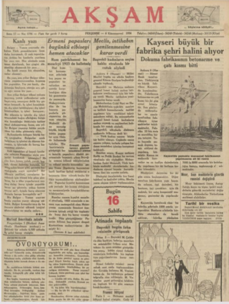
EK 6: Akşam Gazetesi,

6 Ekim 1934 Kadınlara Seçilme Hakkının Verilmesi Üzerine Seçimlerin Yenilenmesine Karar Verilmesi