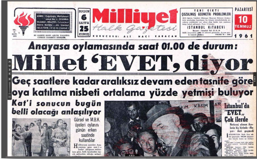
EK 7: Milliyet Gazetesi, 11 Temmuz 1961, Anayasa'nın Halk Oylamasına Sunulmasının Sonucu