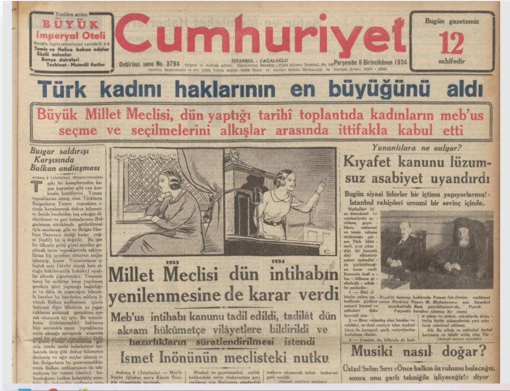
EK 9: Cumhuriyet gazetesi,

6 Aralık 1934, Kadınlara Seçme ve Seçilme Hakkının Verilmesi