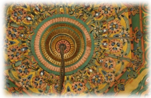
Fot. 47 Bindirme tavanın göbeğinden detay