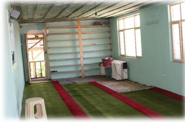
Fot. 11 Mahfilin kuzeyindeki ek bölüme orijinal minare tarafından giriş