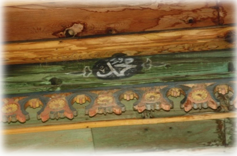
Fot. 32 Bindirme tavandaki Muhammed yazısı