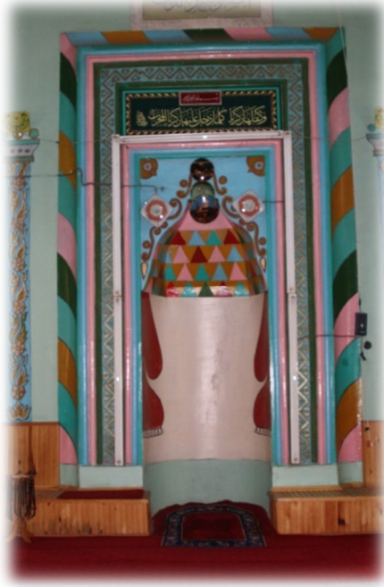
Fot. 12 Mihraptan görünüm