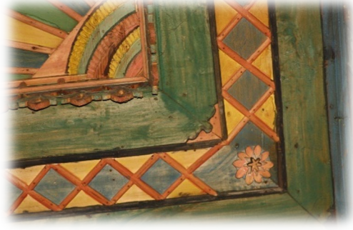
Fot. 45 Bindirme tavandaki köşe motifi