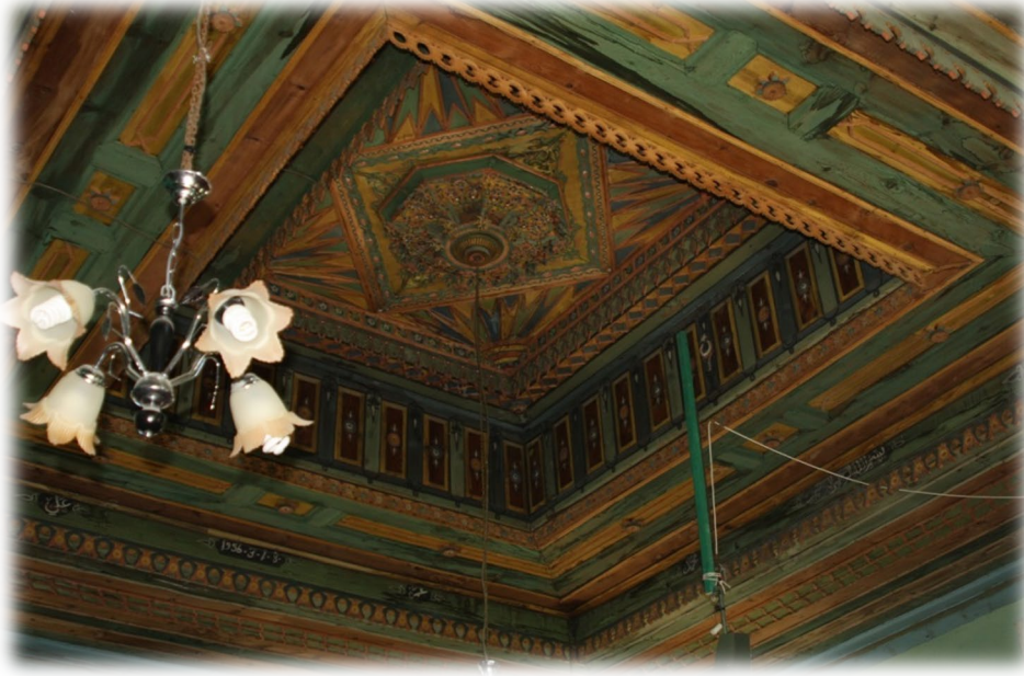
Fot. 8 Harimin tavanından genel görünüm