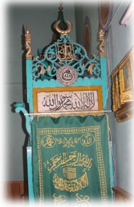
Fot. 16 Minber kapısından görünüm