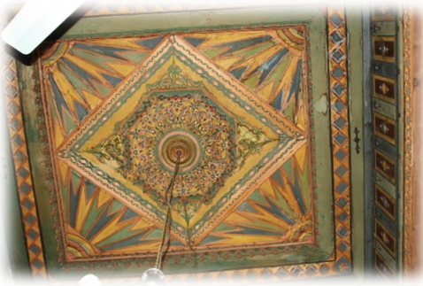
Fot. 46 Bindirme tavanın göbeği