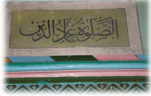
Fot. 21 Mihrap üzerindeki yazı