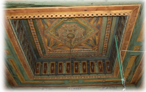
Fot. 27 Bindirme tavandan görünüm