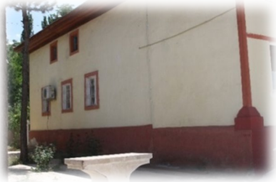
Fot. 5 Yapının doğu cephesinden görünüm