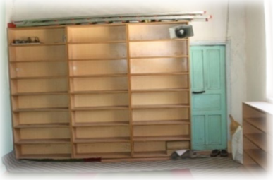
Fot. 3 Son cemaat yerinden minareye çıkış