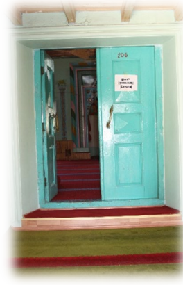
Fot. 15 Harime girişi sağlayan kapı