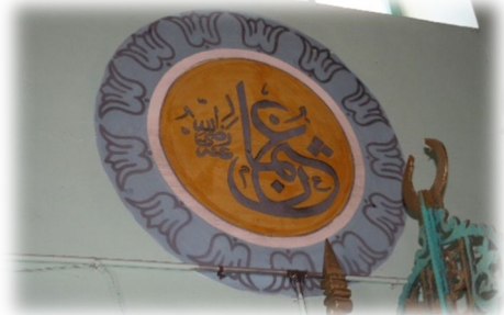
Fot. 19 Osman Radiyallahu anh yazısı