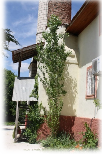
Fot. 2 Orijinal minarenin kaidesi