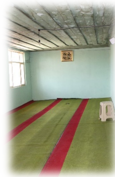
Fot. 10 Mahfilin kuzeyindeki ek bölüm