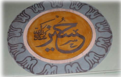
Fot. 24 Hüseyin Radiyallahü anh yazısı