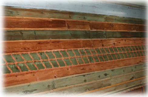
Fot. 28 Tavanın yanlarından görünüm