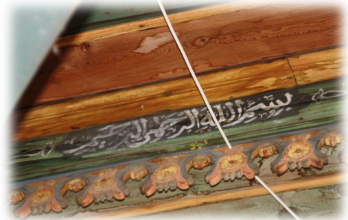
Fot.31 Bindirme tavandaki Bismillahirrahmanirrahim yazısı