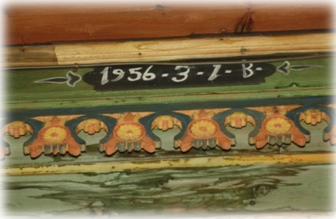
Fot. 34 Bindirme tavandaki İnşa başlangıç tarihi