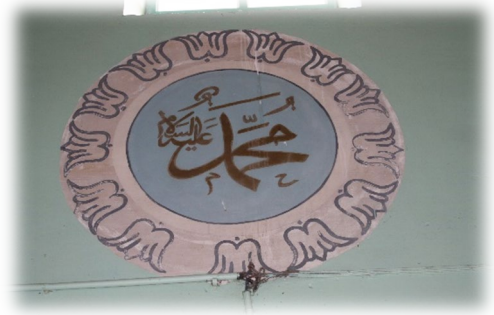
Fot. 23 Muhammed Aleyhisselam yazısı