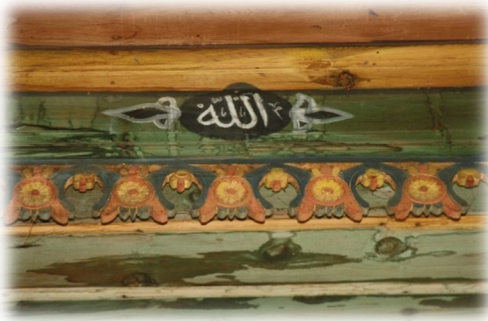
Fot. 30 Bindirme tavandaki Allah yazısı