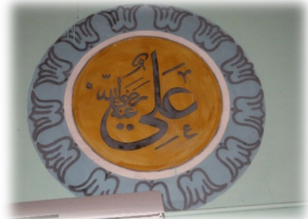
Fot. 25 Ali Radiyallahü anh yazısı