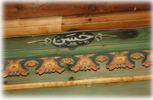
Fot. 38 Bindirme tavandaki Hüseyin yazısı