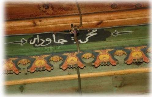
Fot. 37 Bindirme tavandaki Mehmed Çavdar yazısı