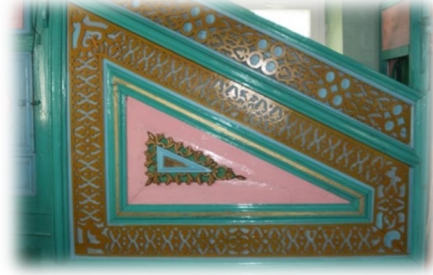
Fot. 17 Minberin aynalık kısmından görünüm