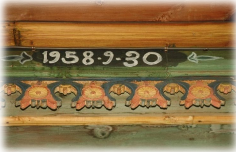
Fot. 40 Bindirme tavandaki inşa bitiş tarihi