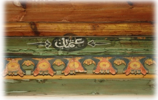
Fot. 39 Bindirme tavandaki Osman yazısı