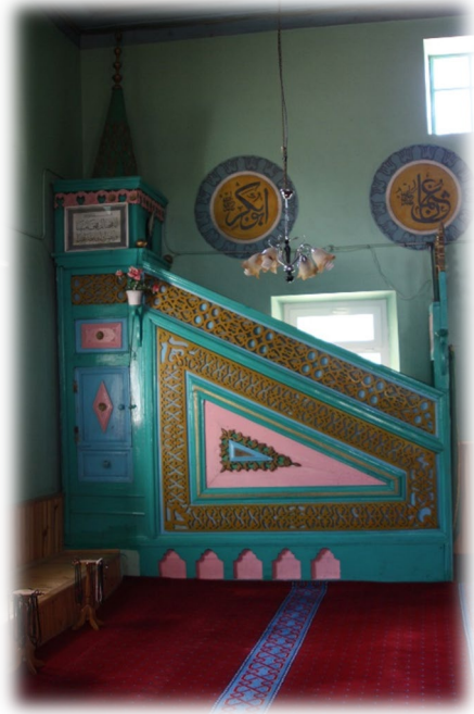
Fot. 13 Minberden görünüm