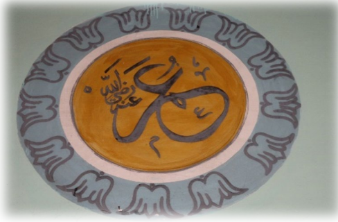
Fot. 26 Ömer Radiyallahü anh yazısı