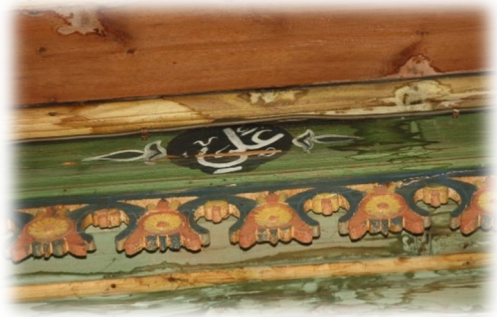
Fot. 35 Bindirme tavandaki Ali yazısı