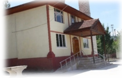
Fot. 4 Yapının kuzey cephesinden görünüm