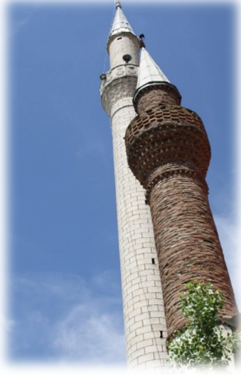
Fot. 1 Yapının minareleri