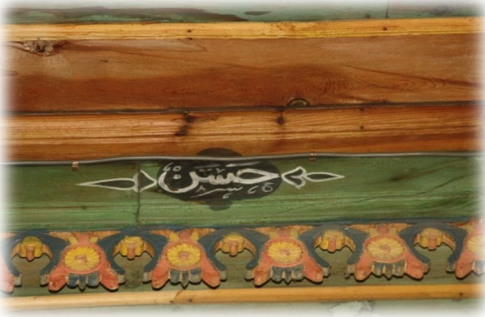
Fot. 36 Bindirme tavandaki Hasan yazısı