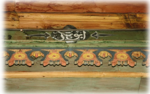
Fot. 41 Bindirme tavandaki Ebubekir yazısı