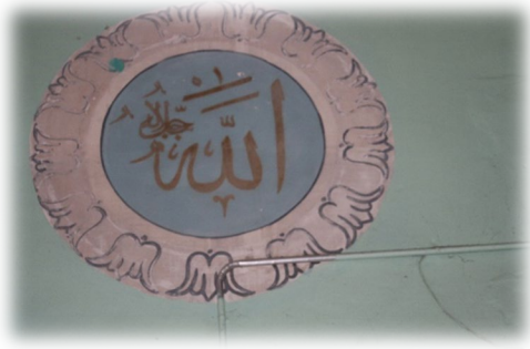
Fot. 22 Allah Celle Celalühü yazısı