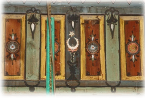
Fot. 44 Bindirme tavandaki hilal ve yıldız motifi