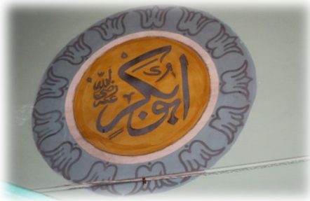
Fot. 18 Ebu Bekir Radiyallahu anh yazısı