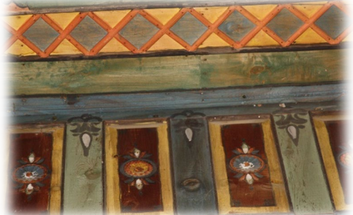
Fot. 43 Bindirme tavandaki ikinci katın kenarı