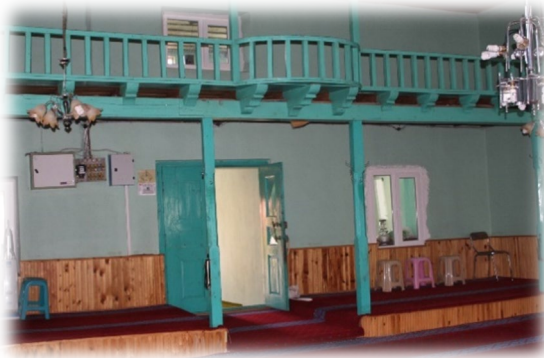
Fot. 9 Kadınlar mahfilinden görünüm