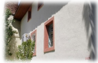
Fot. 6 Yapının batı cephesinden görünüm