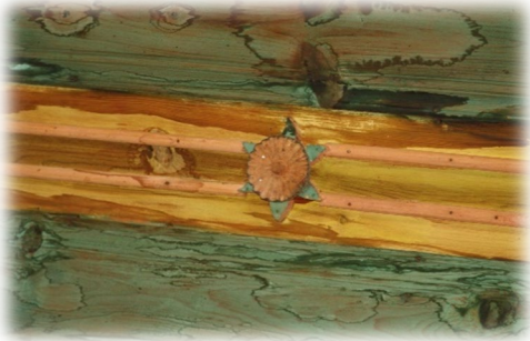
Fot. 42 Bindirme tavandaki altı kollu yıldız motifi