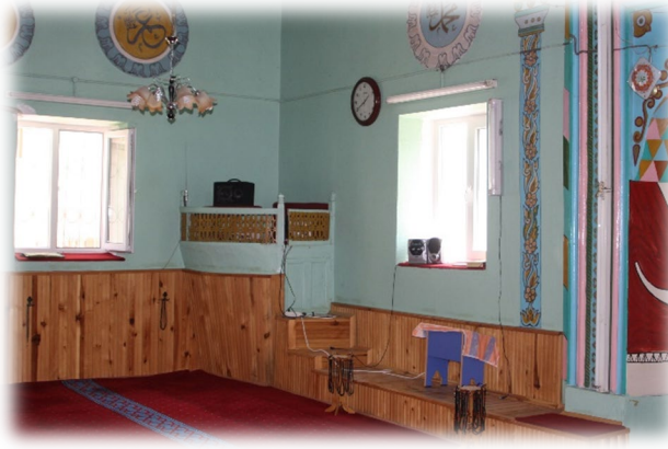
Fot. 14 Vaaz kürsüsünden görünüm