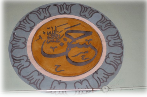
Fot. 20 Hasan Radiyallahu anh yazısı