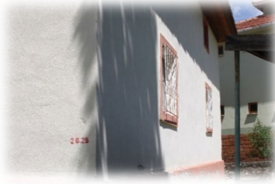
Fot. 7 Yapının güney cephesinden görünüm