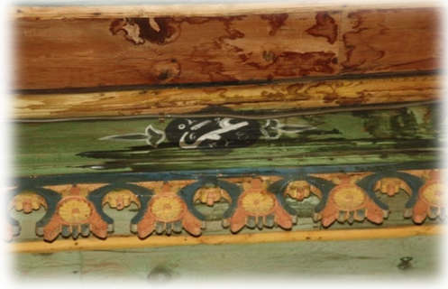
Fot. 33 Bindirme tavandaki Ömer yazısı