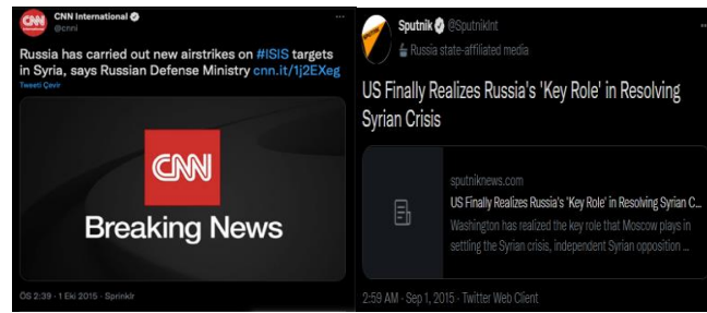
Görsel 3 Rusya'nın Savaşa Dahil Olmasına İlişkin Twitter Paylaşımları

CNN ve Sputnik 1 Eylül tarihinde Rusya tarafından düzenlenen operasyonları Twitter hesaplarında şu şekilde duyurmuşlardır;