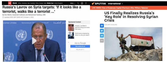
Görsel 4 Rusya'nın Savaşa Dahil Olmasına İlişkin Web Paylaşımları

CNN, olaya ilişkin olarak "Rusya Suriye'deki ISIS hedeflerine yeni hava saldırıları düzenledi, Rus Savunma Bakanı açıkladı" paylaşımını, Sputnik ise "ABD Rusya'nın Suriye Krizinin Çözümündeki 'Kilit Rolünü' Nihayet Anladı" paylaşımını yapmıştır.