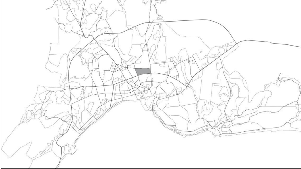
Şekil 1. Karşıyaka Mahallesi'nin kent bütünündeki konumu (Figure 1. Location of Karşıyaka Town in the city)

kent merkezine yakınlığı nedeniyle toplumsal ve mekânsal açıdan deđişim dinamikleriyle karşı karşıya kalmış olmasıdır. Mahalle 1960'lı yıllarda kırsal göçmenin kente tutunma mücadelesine tanık olurken, 1980 sonrasında farklı aktörlerin buradaki topraklar üzerinden rant elde etme çabasına sahne olmuştur.