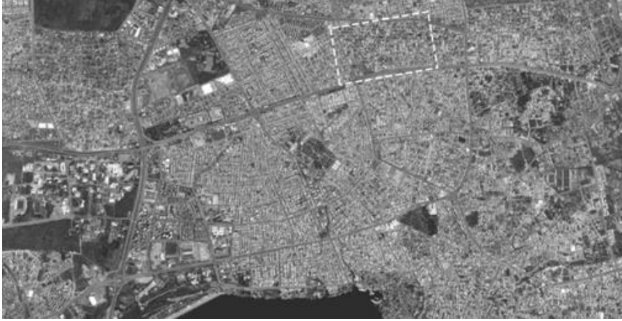
Şekil 2. 2015 yılına ait uydu fotoğrafında Karşıyaka Mahallesi'nin dokusu (Figure 2. Texture of Karşıyaka Town with satellite pictures from 2015)